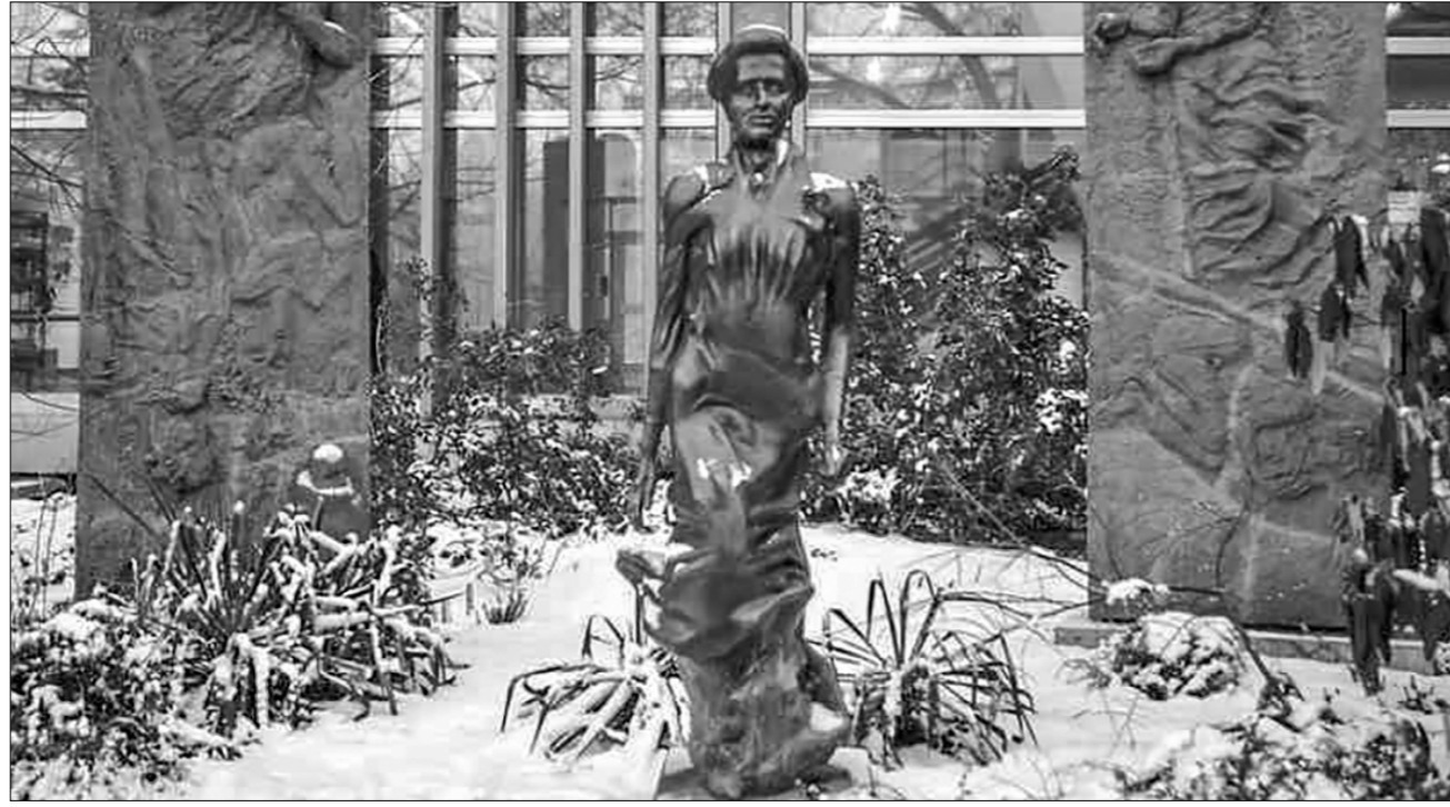
Памятник Розе Люксембург перед зданием редакции бывшего органа ЦК СЕПГ «Нойес Дойчланд» в Берлине.

литить её ранний труд «Кризис социализма во Франции», в котором она последовательно проанализировала ошибки Жана Жореса и французских социалистов начала XX века, когда социалист Мильеран вошёл в состав коалиционного правительства. С ленинской точностью и беспристрастностью Люксембург диалектически проанализировала беспомощность Жореса, его идеологическую эклектику и путаную тактику, приведшие к принятию противоречивого трудового законодательства, к соглашательским позициям и утрате доверия со стороны рабочего класса. Люксембург подчёркивает в своей работе, что рабочие находятся в состоянии классово-войны с эксплуататорами, тем самым принципиально отвергая сотрудничество с буржуазией.