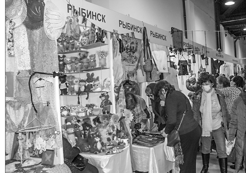
Выполнено из экологичных материалов: берёзы, рябины, дуба. Огромное внимание посетителей привлекает экспозиция Всероссийской выставки конкурса «Великая Отечественная война в произведениях художественных промыслов», посвящённая 75-летию Великой Победы, которое отмечалось в прошлом году. Разделённая на отдельные тематические стенды («Блокада Ленинграда», «Оборона Москвы», «Жди меня...», «Письма с фронта», «Отды после боя» и т.д.), она представила полную палитру чувств и эмоций, которые люди испытывали во время войны: это любовь и боль, страх и потеря, надежда и вера.