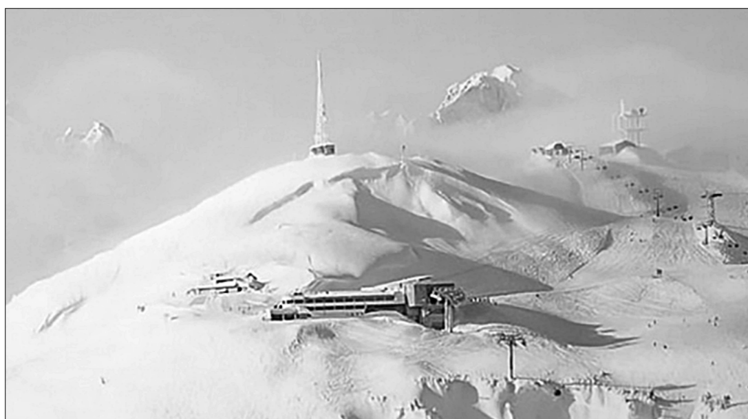
Так безжизненно выглядят сейчас горнолыжные курорты австрийского Тироля.

Ещё в середине февраля австрийские власти забили тревогу: в крупнейшем горнолыжном регионе страны, федеральной земле Тироль, были почти одновременно обнаружены два новых штамма коронавируса — британский и южноафриканский. Власти немедленно закрыли территорию региона на карантин и ввели жёсткие ограничительные меры.