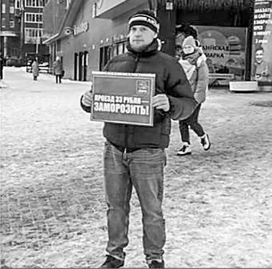
Пресс-служба Екатеринбургского горкома КПРФ.