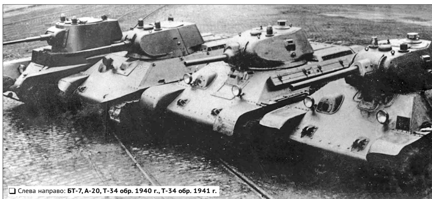
□ Слева направо: БТ-7, А-20, Т-34 обр. 1940 г., Т-34 обр. 1941 г.