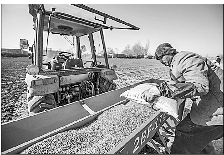
Недавно во всём Нинся-Хуэйском автономном районе (Северо-Западный Китай) приступили к весенне-полевому работам. В нынешнем году здесь планируется засеять около 700 тысяч гектаров зерновых культур, в том числе 65 тысяч гектаров пшеницы.