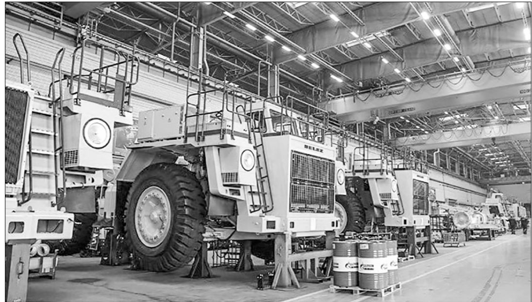
БелАЗ представил новый «антисанкционный» 25-тонный карьерный самосвал МоА3-75053. Он состоит из белорусских, российских и китайских комплектующих. Серийное производство машин развернуто на предприятии в Могилёве. Полноприводный грузовик предназначен для работы в горнорудной промышленности: он зaimётся перевозкой насыпных грузов. Сейчас инженеры проверяют силовую установку и дорабатывают техническую документацию.

Бастующий персонал берлинского аэропорта.