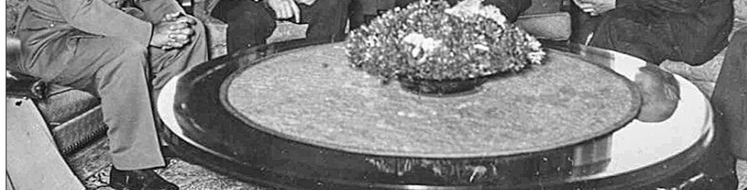
Б. Муссолини, А. Гитлер, Э. Даладь, Н. Чемберлен на конференции в Мюнхене.

Пользуясь попустительством и прямым пособничеством со стороны англосаксонских и польских правящих элит, Гитлер приступил к реализации зловещих планов по завоеванию «жизненно необходимого пространства». Уже 12 марта 1937 года была оккупирована Австрия. Отметим, что только СССР резко осудил акт нацистской агрессии. Однако конструктивные предложения Советского Союза не нашли поддержки у западных держав. Более того, продолжавшаяся англосаксонская политика умиротворения влечётную подвала Европу к Мюнхенскому сговору. Судьба Чехословакии была предана на итогах встречи Чемберлена с Гитлером 15 и 22 сентября 1938 года.