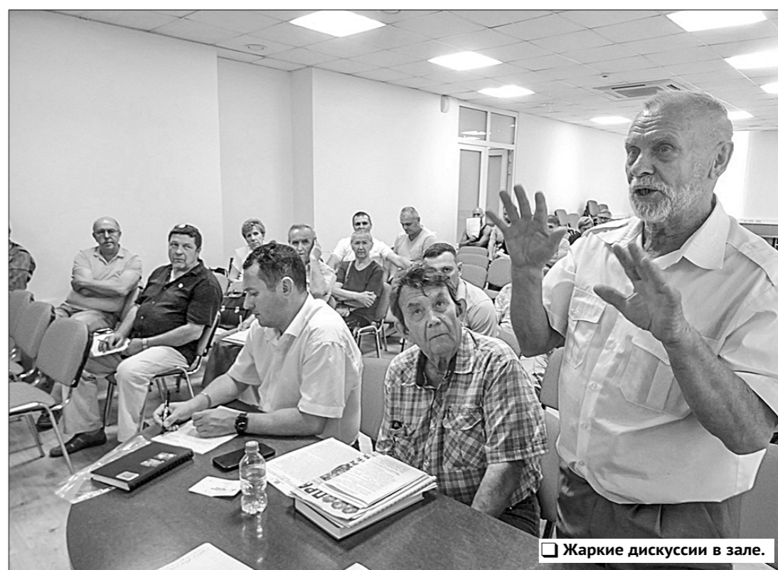
Жаркие дискуссии в зале.

С другой стороны, буржуазные власти стремятся ослабить любую действующую коммунистическую организацию в обществе. Куда зовут рабочий класс оппортунисты-империалисты, выступающие на поражение буржуазной России? Что получит пролетариат после поражения России на Украине? Очевидно, что пролетариат получит интервенцию, раздел страны, репарации, нищету и приход к власти ультраправых.