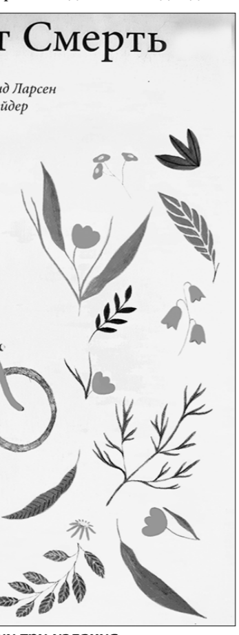
Эта книга выдержала в России три издания.

Да-да, нашим детям предлагают книги, оправдывающие предательство. Не одну, не две — десятки! Инокаательно детям внушается, что предательство — это норма, что ничего страшного в этом нет, что оно — твой естественный выбор. А значит, можно предавать родителей, сверстников, тех, с кем ты дружишь. Главное, достигай поставленной цели. Если ради её достижения ты кого-то предад — ты молодец.