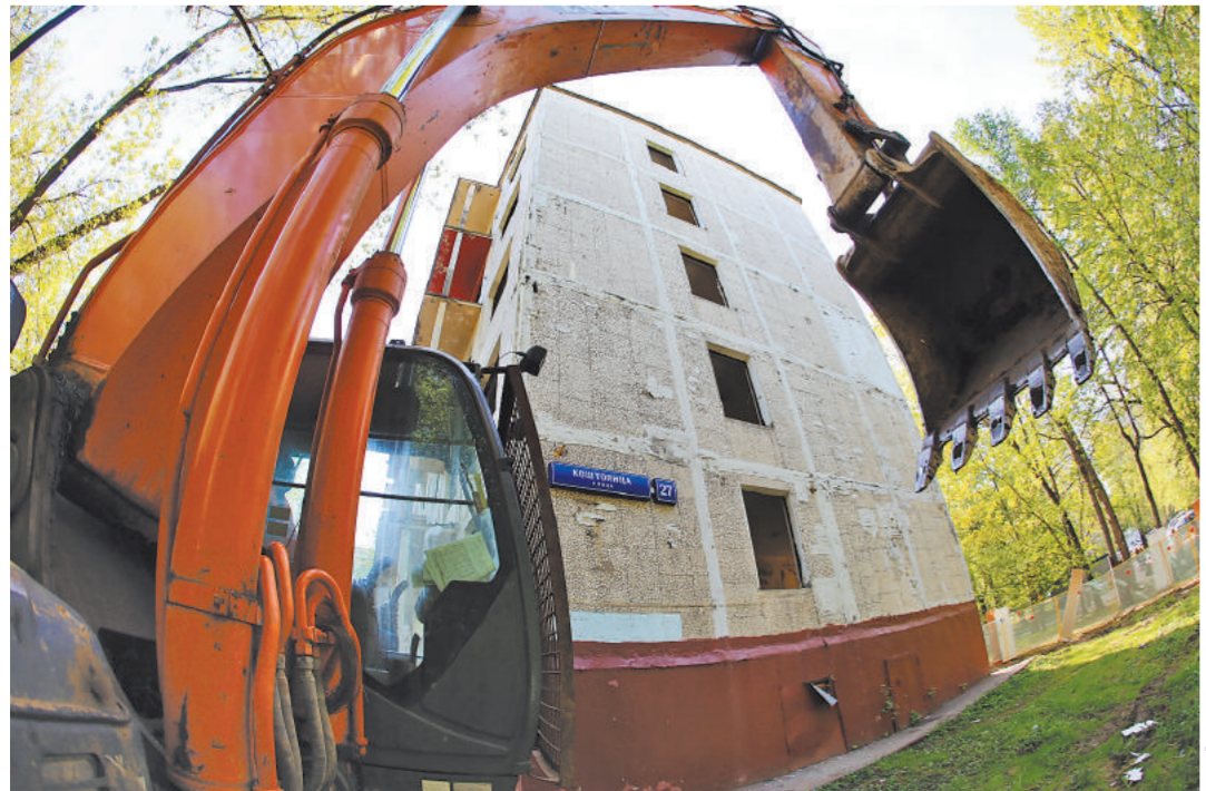
Многие пятиэтажки и сейчас дышат на ладан: едва ковш касается конструкции — бетонная плита рушится.

Подробнее о реновации — на сайте rg.ru/sujet/5833