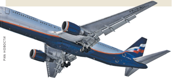
Самолеты группы компаний «Аэрофлот» в прошлом году перевезли 43,4 миллиона пассажиров.

Правительство утвердило директиву для «Газпрома» выплачивать годовые дивиденды по результатам деятельности в 2016 году в размере 190,327 миллиарда рублей, что составляет 20 процентов чистой прибыли по МСФО и на 3,5 миллиарда рублей больше аналогичных выплат прошлого года.