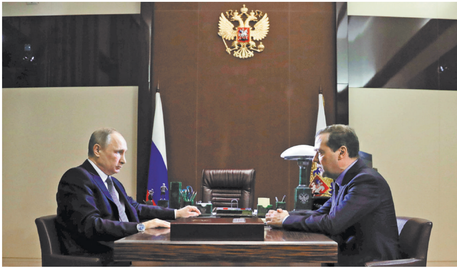
МИХАИЛ КОМИЛЬНИЧЕВ / ПРЕСС-СЛУЖБА ПРЕЗИДЕНТА РФ / ТАСС