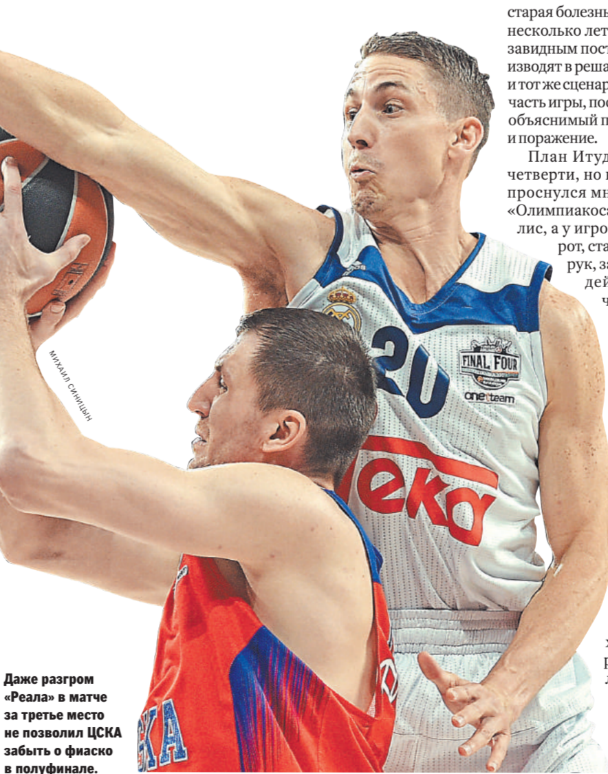
Даже разгром «Реала» не позволил ЦСКА забить о финале в полуфинале.

В полуфинале, который ЦСКА проиграл греческому «Олимпиакосу» (78:82), напомнила о себе