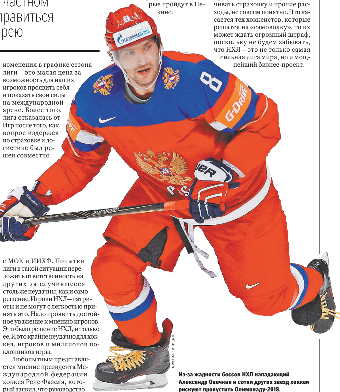
Из-за жадности боссов НХЛ нападающий Александр Овечкин и сотни других звезд хоккея рискуют пропустить Олимпиаду-2018.

И все-таки небольшой шанс увидеть звезд НХЛ в форме сборных России, Швеции или Финляндии сохраняется. Это станет возможно только если руководители клубов НХЛ в «частном порядке» разрешат игрокам отправиться в Корею. Другое дело, что кто будет оплачивать страховку и прочие расходы, не совсем понятно. Что касается тех хоккеистов, которые решатся на «самоволку», то их может ждать огромный штраф, поскольку не будем забывать, что НХЛ — это не только самая сильная лига мира, но и мощнейший бизнес-проект.