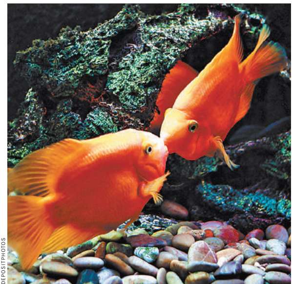
Умные рыбы предпочитали самых ярких самцов, искали именно их, расходуя на поиск силы и время.

Сами ученые говорят, что у них пока больше вопросов, чем ответов. Они намерены продолжать исследование. Например, понять, какую роль в эволюции играет зависимость женского отбора от ее ума, как это может сказаться на количестве и жизнеспособности потомства.