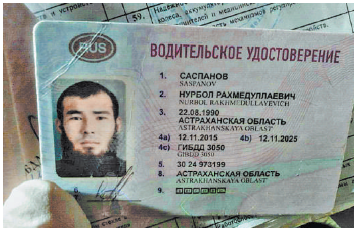
Убийца полицейских объявлен в розыск.

Держакое нападение и убийство инспекторов ГИБДД стало поводом для экстренного заседания региональной антитеррористической комиссии и оперативного штаба. Семьям погибших власти региона окажут материальную помощь.