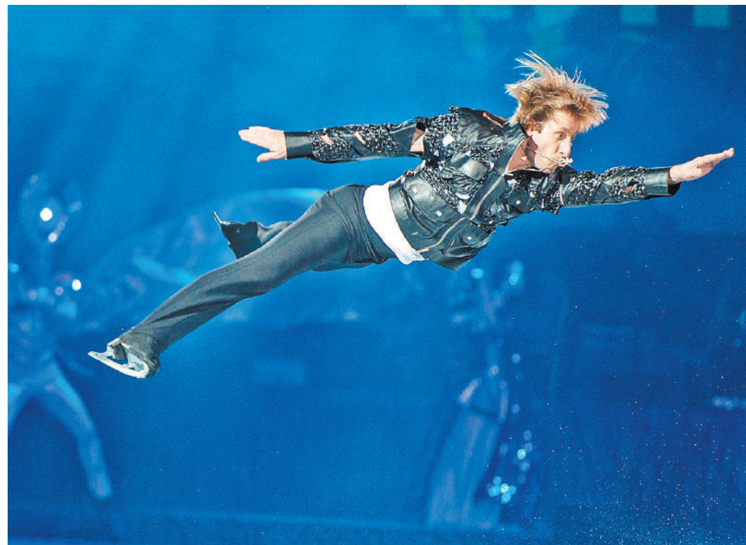
Евгений Плющенко решил передать богатый опыт молодым и посвятить себя тренерской карьере.

Кубок России по футболу: следите за новостями на сайте rg.ru/sujet/5739