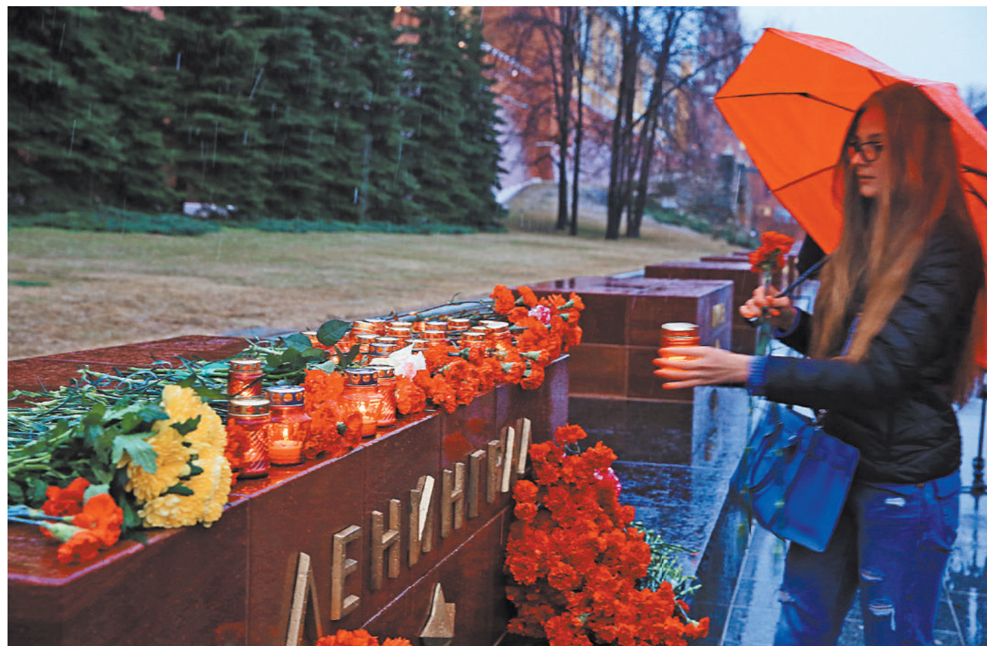
Москвичи и гости столицы несут цветы и зажигают свечи в Александровском саду на аллее городов-героев.