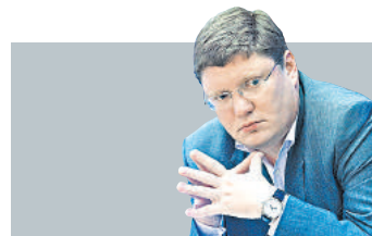
Андрей Исаев первый заместитель руководителя фракции «Единая Россия» в Государственной Думе