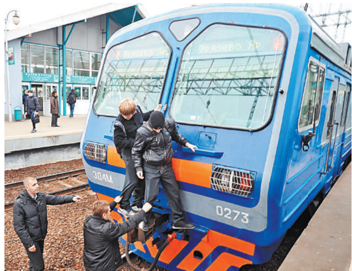
Теперь в УК появилась специальная статья, под которую попадут зацеперы.

До этого зацеперы рисковали попасть только под статью КоАП. Штрафы по ней невелики. Так что наказание людей не останавлива-