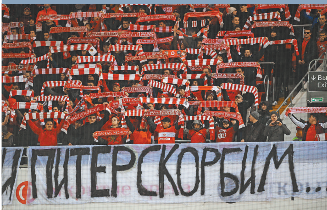
Футбольные болельщики на матче «Спартак — Оренбург» забили о клубно-фанатском противостоянии двух столиц. Соборезнования в адрес пострадавших и родственников погибших пришли со всего света — из Парижа и Берлина, из Вашингтона и Пекина, из Токио и Буэнос-Айреса, а также из многих других стран.