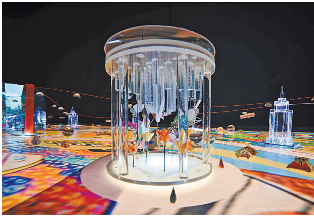
На ВДНХ появятся подвесные карусели: на одной из них посетители смогут полетать, «оседлав» бабочек.

парка известный режиссер Андрей Болтенко заявил, что это будет один из самых мощных проектов в сфере индустрии развлечений. Ожидается, что только за один год аудитория парка развлечений превысит два миллиона человек. Качели, детские площадки, небольшие аттракционы 3D-реальности — во всем этом не будет недостатка. В обсервацию инвесторы намерены вложить в проект 11 млрд руб. По