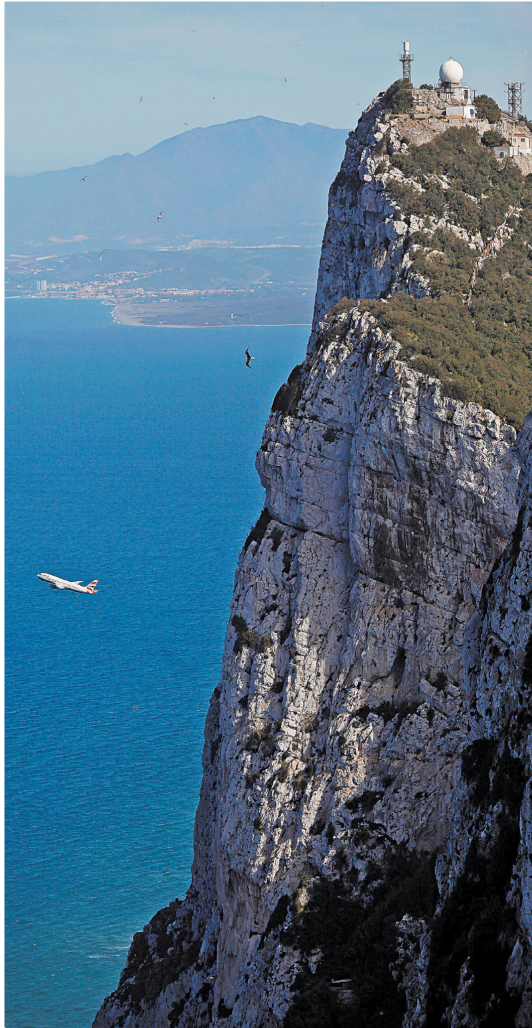
Знаменитая Гибралтарская скала стала «яблоком раздора» между Лондоном и Мадридом.

Что касается мнения самих гибралтарцев, то тут ситуация сложнее. Жители полуострова оказались перед сложнейшей дилеммой. С одной стороны, «при котором жители Гибралтара перейдут под власть другого государства, против их свободного и выраженного демократического волеизъявления». Вдогонку британский министр обороны Майкл Фаллон пригрозил, что Британия готова объявить войну, чтобы защитить суверенитет Гибралтара. О возможности военного конфликта с Испанией заговорил и другой влиятельный британский политик, бывший лидер консервативной партии королевства Майкл Ховард. Он сравнил спор с Мадридом по поводу Гибралтара с ситуацией, которая сложилась вокруг Фолклендских островов в