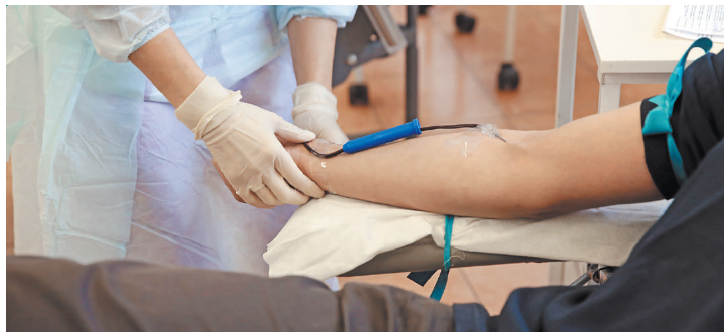
Петербуржцы сдают кровь в Марининской больнице для пострадавших в теракте.