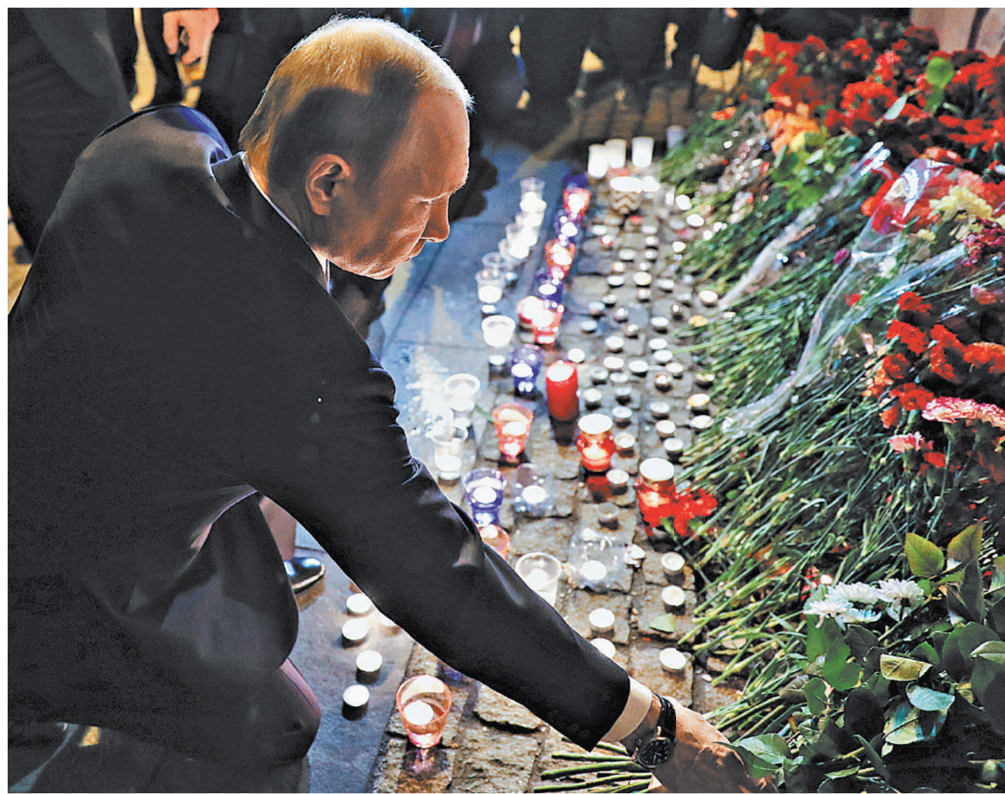
Владимир Путин приехал к станции метро «Технологический институт», где произошел теракт, и возложил цветы к народному мемориалу у входа на станцию.

—Сегодня город за помощью в федеральный центр не обращался. У нас имеются все средства и возможности для того, чтобы оказывать медицинскую помощь и поддержку всем, кому это необходимо, — рассказал губернатор Георгий Полтавченко. — Меди-