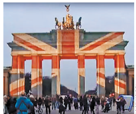
Всякий раз, когда теракты случались в Лондоне, Париже или Иерусалиме, Бранденбургские ворота подсвечивались цветами национальных флагов стран, подвергшихся атакам.

ние по поводу решения городских властей и мэра Михаэля Мюллера, который представил Социал-демократическую партию Германии — партнеров Меркель по коалиции. В частности, на сайте городской газеты Berliner Zeitung было запущено голосование по вопросу: «Должны ли Бранденбургские ворота окраситься в цвета российского флага?» 90 процентов читателей выразили уверенность, что такой жест солидарности с россиянами был бы правильным и нужным.