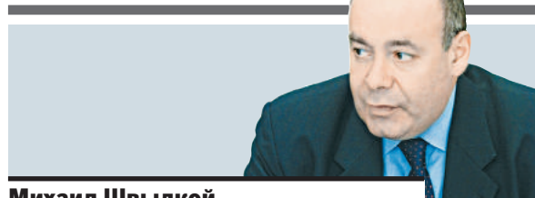
Михаил Швыдкой доктор искусствоведения