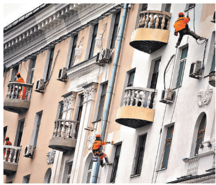
Ремонт памятников в центре города требует совсем других денег — намного больше, чем ремонт стандартных многоквартирных домов в спальных районах.