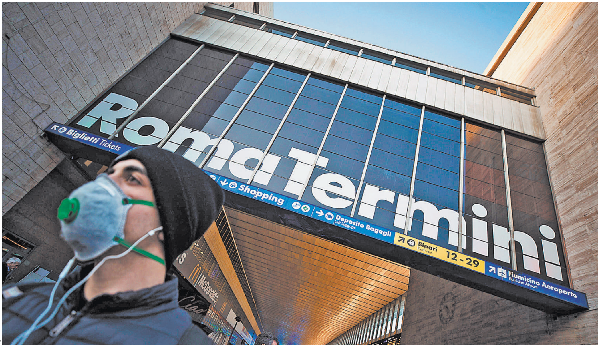
И в Риме тоже появились люди в масках.