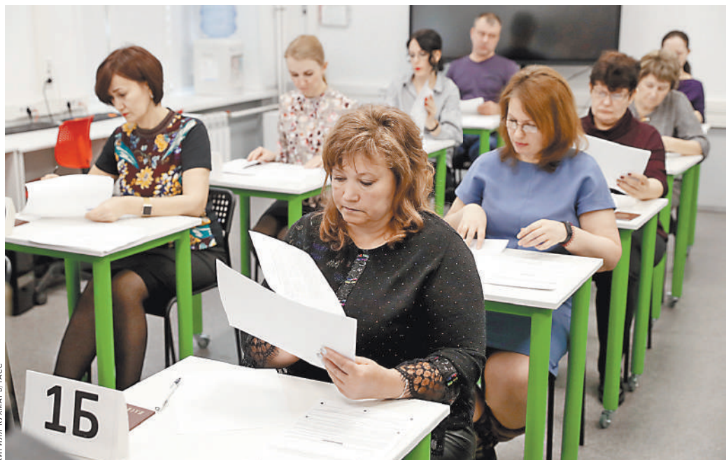
ЕГЭ для взрослых: вроде, не страшно, но познакомиться пришлось...