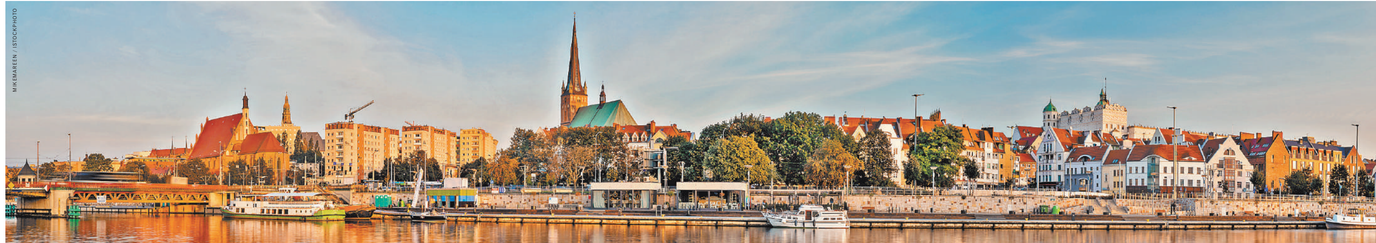
Щецин — один из крупнейших портовых городов и промышленных центров Польши, с уникальными памятниками истории и архитектуры. В основе планировки старого города — система звездобразных площадей, которые украшают исторические здания в стилях барокко, готики и классицизма.

Сегодня инфраструктура западных земель все еще выгодно отличается от остальных регионов страны. Кроме того, в этих регионах выше зарплата и уровень жизни в целом, меньше безработица, более распространено владение иностранными языками. В современном Щецине, как и во Вроцлаве, Гданьске и Эльблонге, а также остальных «обретенных землях», как их называют поляки, видно, что «немецкие яства» пошли «польскому гусю» на пользу, хоть и несколько притупили его память. ●