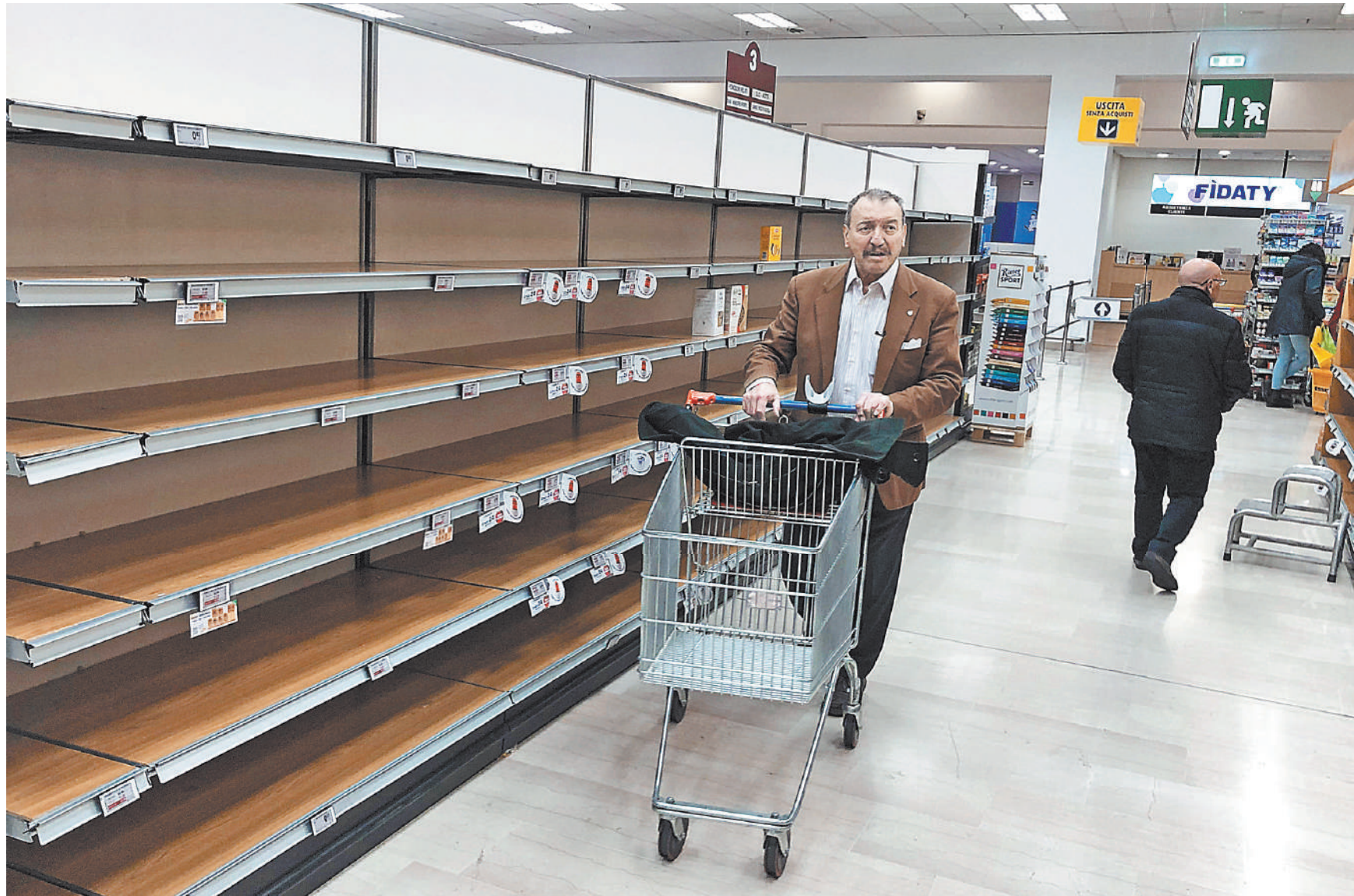
Коронавирус поставил экономику всего мира на паузу.

Если эпидемия будет нарастать, то российский фондовый и валютный рынки будут ждать