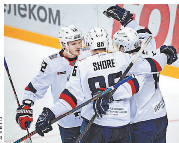
Победа над финским «Йокеритом» позволила хоккеистам нижегородского «Торпедо» оформить путевку в плей-офф.