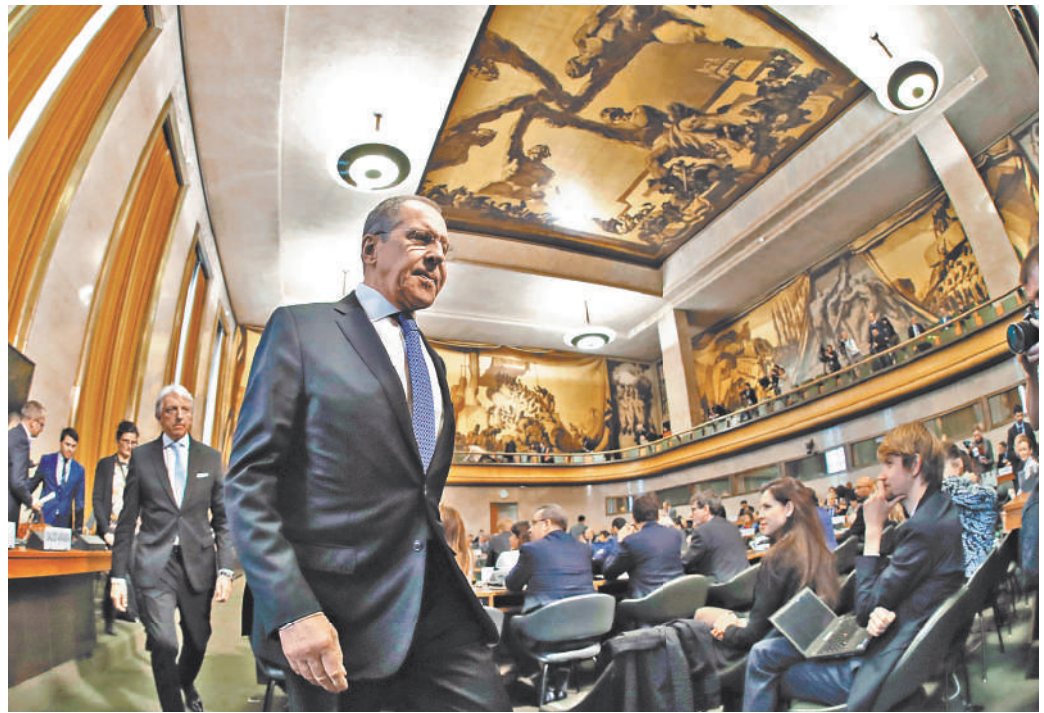
В Женеве Сергей Лавров заявил, что изначальный дух ООН подрывается бюрократическими препонами.

В свете планов ряда стран Запада, в первую очередь США и Франции, по военному освоению космоса Сергей Лавров призвал к мерам по предотвращению силового противостояния в этом пространстве. Глава МИД России указал, что до сих пор в рамках КР было сформулировано только одно конструктивное предложение по этой проблеме, а именно — российско-китайский проект договора о предотвращении размещения оружия в космическом пространстве.