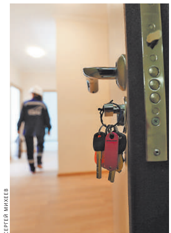
По прогнозам, в 2020 году средняя стоимость метра на вторичном рынке вырастет примерно на 6%.

На вторичном рынке жилья — стагнация. Цены больше не растут, а спросом пользуются только небольшие, ликвидные квар-