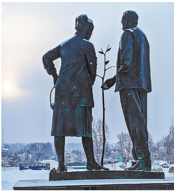
Памятник музейщикам Пушкиногорья.