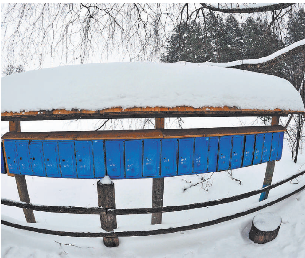
Прогулки по пушкинским местам.