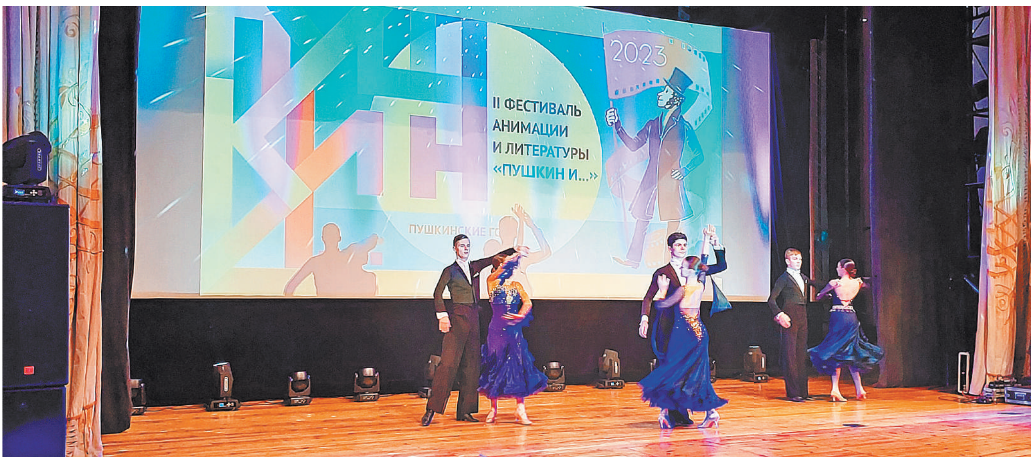
Открытие II фестиваля «Пушкин и...».