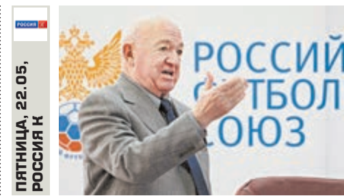
ПЯТНИЦА, 22.05, РОССИЯ К

Вплоть до конца 1980х годов в СССР сама практика отказа от животной пищи не по диетическим, а по этическим соображениям была делом единиц. На рубеже XIX и XX веков вегетарианство развивалось во всем мире как массовое явление, и Россия не была исключением. Возможен ли жизнь человечества без мяса?