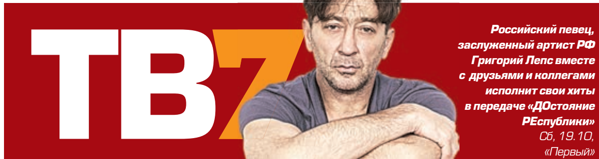
Российский певец, заслуженный артист РФ Григорий Лепс вместе с друзьями и коллегами исполнит свои хиты в передаче «Достоиние Республики»