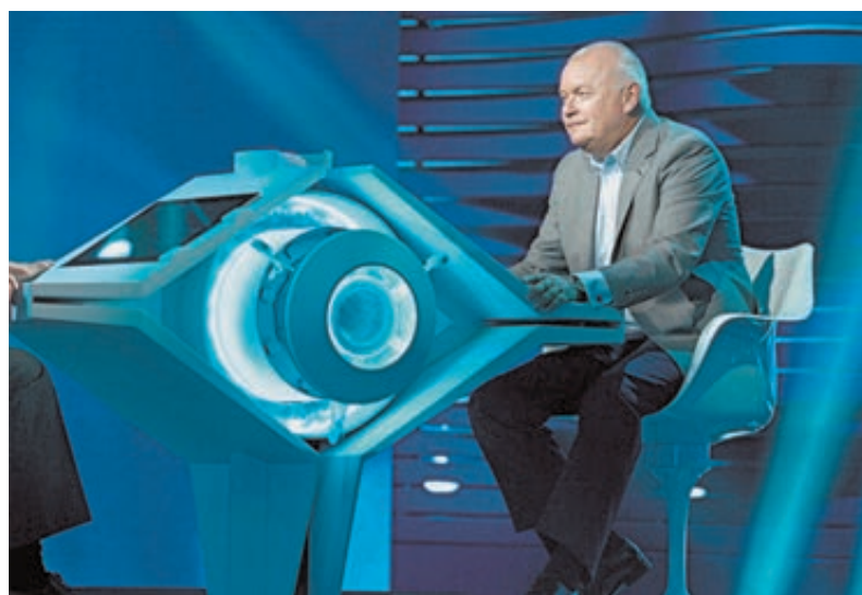
Игрой «Знание – сила» управляет Дмитрий Киселев.

С началом каждого телесезона в эфире появляются новые передачи. Зачем? Ответ, кажется, лежит на поверхности: чтобы предложить зрителю еще больше информации и, разумеется, развлечения.