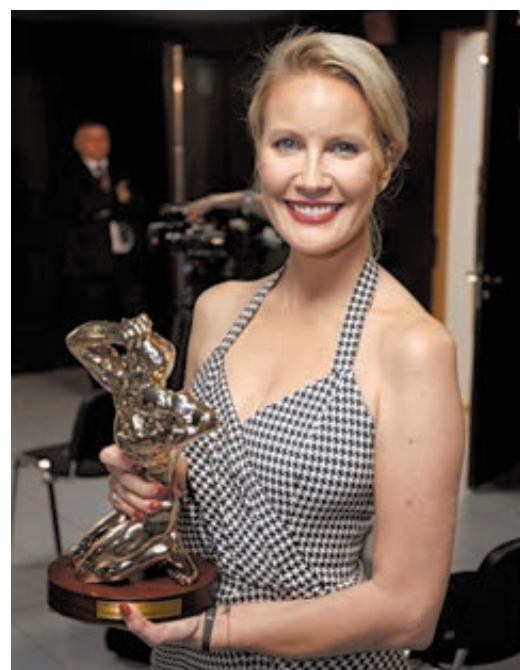
ТЭФИ за лучшее вечернее шоу получила программа «Ревизорро».

нее развлекательное ток-шоу» и «Социально-политическое».