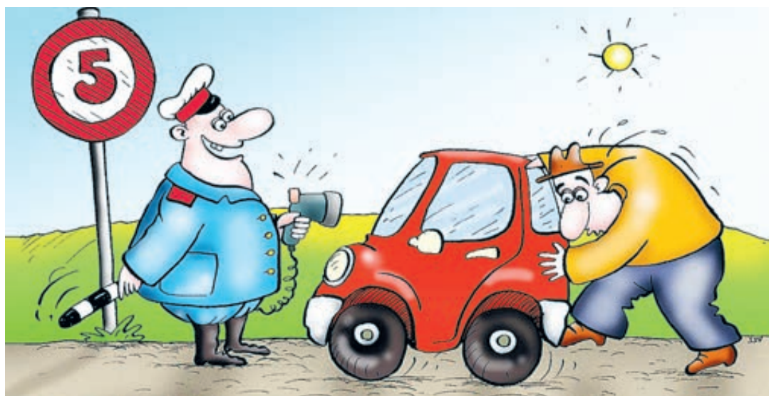
ИЛЛЮСТРАЦИЯ СЕРГЕЯ СОКОЛОВА, САНКТ-ПЕТЕРБУРГ

Л идером по числу подделок является сайт гибдд.рф: мошенники из кожи вон лезут, чтобы сделать свои странички максимально похожими на оригинал и получить доступ к многомиллионной армии платежеспособных водителей. Для лучшей убедительности жулики используют аббревиатуру Gibdd (и как только регистратор разрешает это делать?). А все для того, чтобы не слишком внимательный автолюбитель пришел с внешней ссылкой на этот сайт и попытался выяснить количество штрафов. Ко-