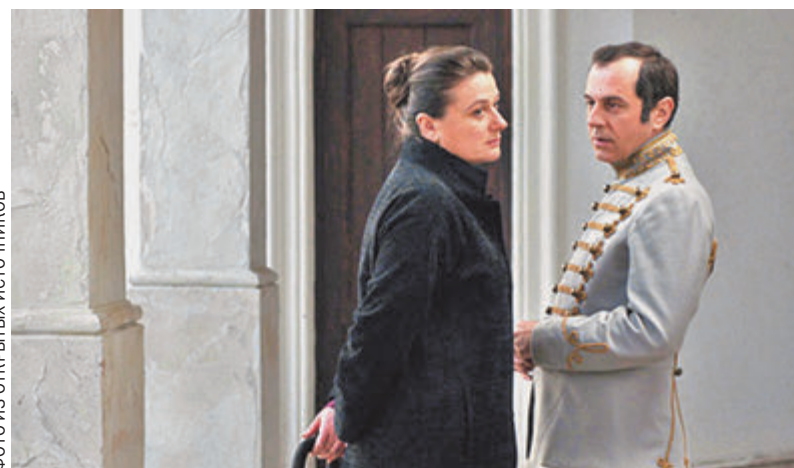
Кадр из фильма «Под электрическими облаками».

Большая удача: фильм Алексея Германа-младшего «Под электрическими облаками» попал в сильнейший основной конкурс. Шесть историй о разных героях предвзвешают разные миры, разный возраст, социальное положение людей текущего времени. Да и вообще «русский след» на Берлинале-2015 на редкость внушительный.