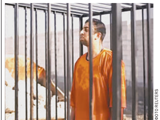
XXI век, февраль 2015-го. Казнь летчика.

В политическом закулисье в белые одежды давно не рядятся — негигиенично. Но в данном случае налицо кризис всей мировой дипломатической культуры. В последние 100–200 лет подобные инициативы старались не оглашать, оберегая хоть внешне, но все-таки правила