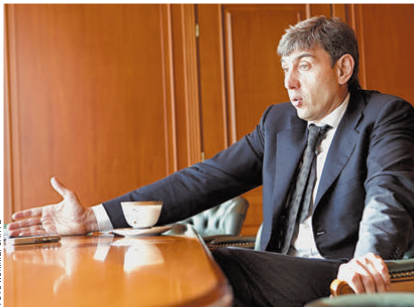
Сергей Галицкий, владелец торговой сети «Магнит»: «У нас правило: если кто-то что-то украл, мы вызываем полицию».

Больше никаких комментариев представители правоохранительных органов не дают. Разве что уточняют, что одета бабушка была просто, но аккуратно, на нищенку совсем