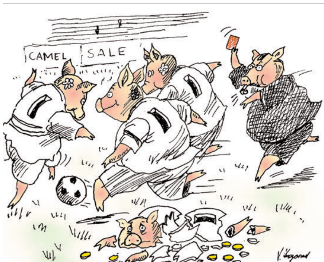
ИЛЛЮСТРАЦИЯ ВИКТОР БОГОРАД/CARTOONBANK.RU

Весомую покупку позволил себе только самый богатый клуб