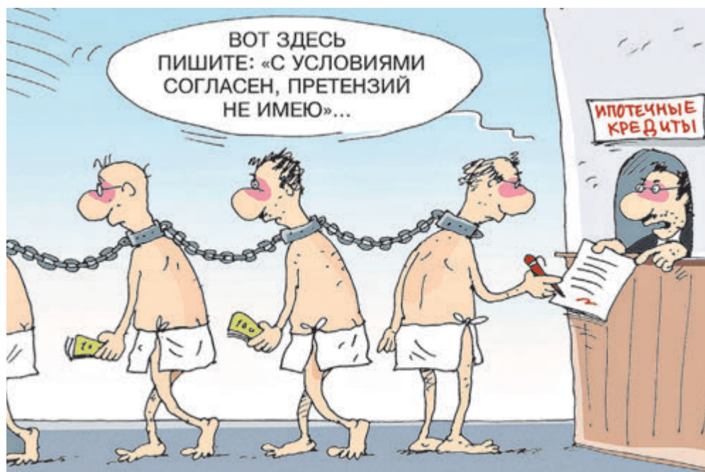
ИЛЛЮСТРАЦИЯ СЕРГЕЯ КОКАРЕВА/САРГОТОВАНК.РУ