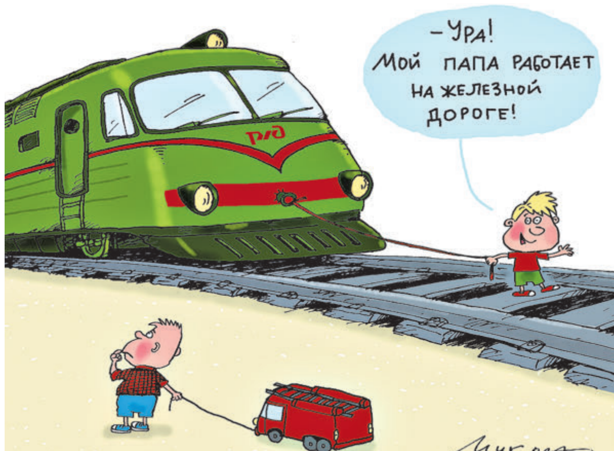
ИЛЛЮСТРАЦИЯ НИКОЛАЯ ВОРОНЦОВА/CARTOONBANK.RU

А они и в прежние годы сотнями убывали на запасной путь. По одной простой причине – эти перевозки нерентабельны. Как уверяют железнодорожники, проездной билет должен быть многократно дороже. Забайкальская пассажирская пригородная компания попыталась с 1 января ввести «экономический обоснованный тариф», и в результате