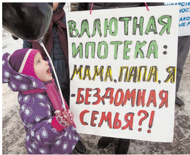
Митинг Всероссийского движения валютных заемщиков.

А ведь многие авторитетные эксперты после изучения антикризисной программы кабинета Дмитрия Медведева говорят, что именно ипотека – как главное