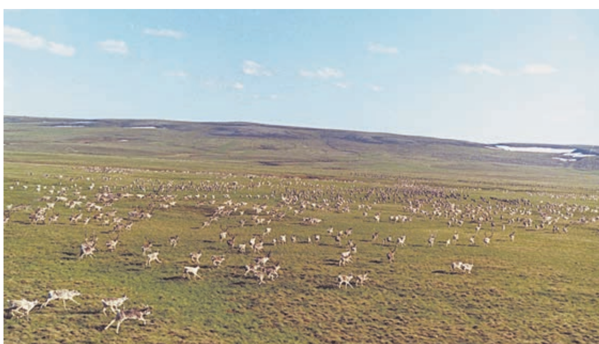
Проект «Эвенкийский олень» помогает отследить пути миграции.