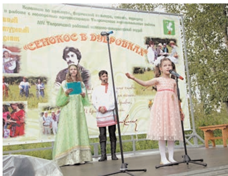
Юные таланты Талдома читают стихи своего знаменитого земляка.