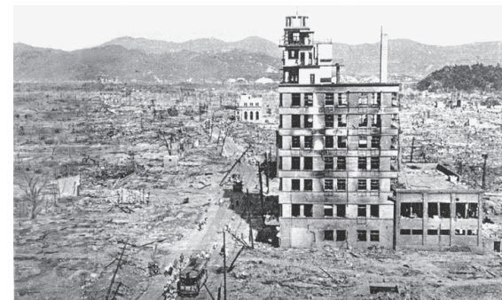
Хиросима: август 1945-го.

Еще в 1965-м известный американский историк и политолог, автор книги «Атомная дипломатия» профессор Гар Алперович признавал: военного смысла применение атомных бомб не имело. О радиации тогда никто ничего не знал. К тому же американцы сбросили бомбы не на места дислокации армейских частей, а на мирные города. Пострадали некоторые военные заводы