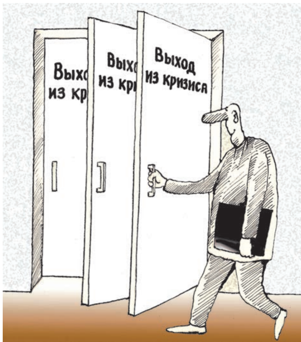
ИЛЛЮСТРАЦИЯ НИКОЛАЙ КИНАРОВ / CARTOONBANK.RU

Вопервых, непонятно, что должно наладиться и почему. В ближайшие годы прежние цены на углеводороды точно не вернутся, а ведь нефть давала российскому бюджету больше половины всех поступлений. Об опасности такой зависимости давным-давно предупреждали и президент, и эксперты, но другой «соломки» нет, судя по планам правительства, даже не ищется.