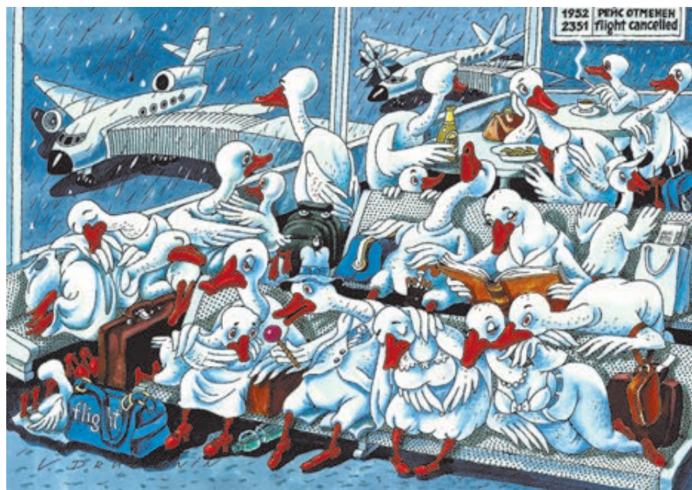
ИЛЛЮСТРАЦИЯ ВАЛЕНТИНА ДРУЖИНИН/САТОНОВАНК.РУ

По оценке Минтранса, около 70% пассажиров, пользующихся услугами наших авиаперевозчиков, составляют граждане Украины. То есть украинские власти, вводя запреты на полеты российских компаний, наказывают прежде всего собственных граждан. Вполне возможно, что это и есть главная цель Киева, который, не считаясь с потерями, проводит курс на разрыв отношений с Россией.