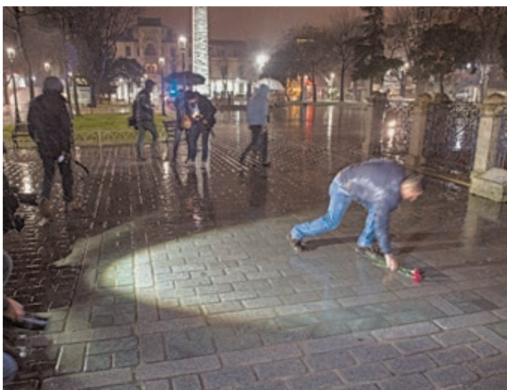
На месте взрыва в центре Стамбула.

Чего добиваются немцы? Они требуют, чтобы виновные были наказаны, они хотят гарантий, чтобы подобное не повторилось. Но власти медлят. Во-первых, все из-за той же толерантности, обращенной почему-то лицом к мигрантам, а к остальным гражда-