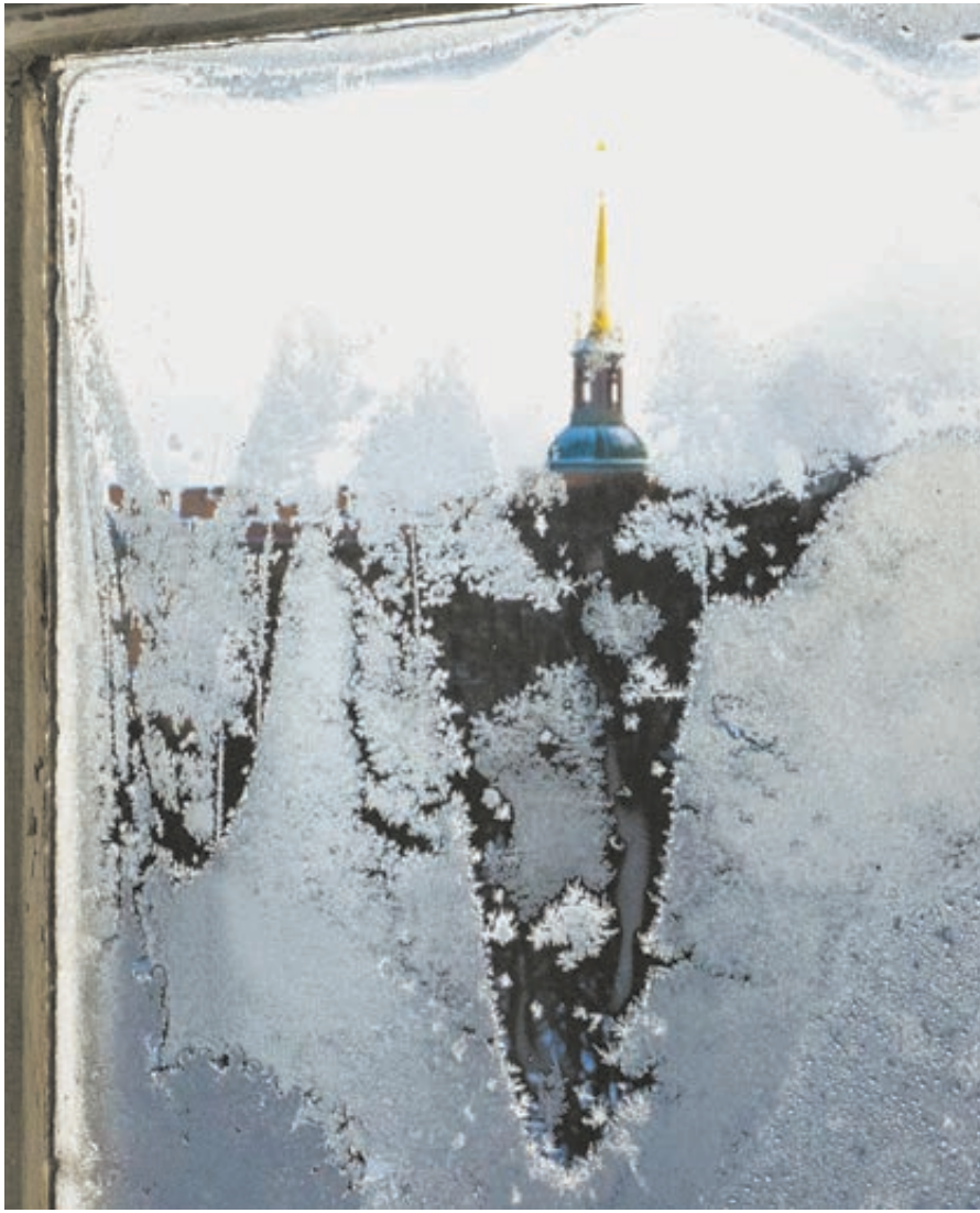
Многим семьям пришлось переехать из центра города на окраины, спасаясь от морозов.

Попали под раздачу и пациенты лечебных учреждений. В Боткинской больнице температура в одном из отделений опустилась 7 января до плюс 9. У Натальи Матценгер в те дни там лежал муж с ангиной. Руководство Бот-