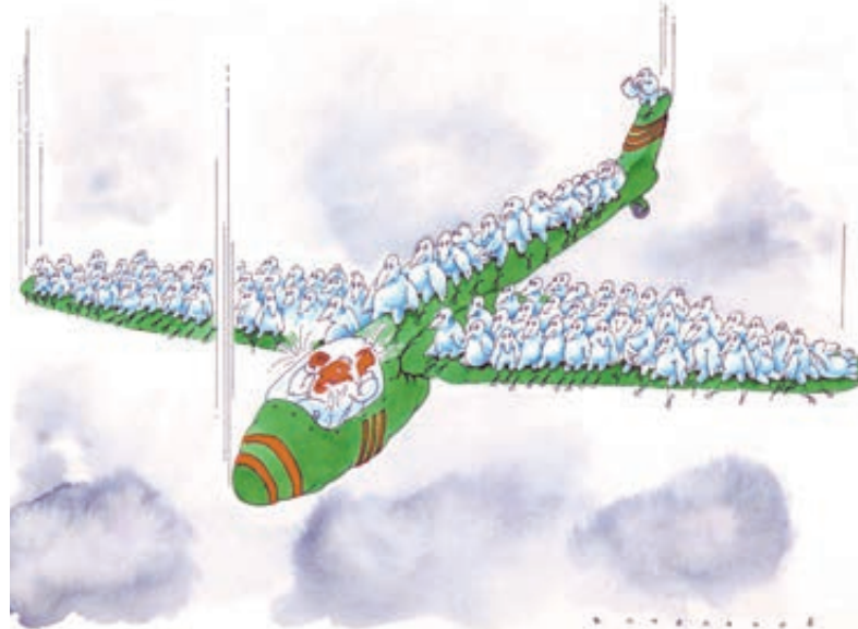
ИЛЛЮСТРАЦИЯ ВЛАДИМИР СТЕПАНОВ/CARTOONBANK.RU

Международная ассоциация воздушного транспорта сообщила, что на этой неделе авиабилеты на зарубежные рейсы снова подорожали на 6–7%. Цены на полеты внутри России пока держатся. Но двумя днями раньше гендиректор «Аэрофлота» Виталий Савельев на встрече с президентом РФ проинформировал, что крупнейший авиаперевозчик будет вынужден через два месяца пересмотреть даже так называемые социальные плоские тарифы в сторону повышения. Если сейчас из Москвы в Калининград и обратно можно слетать за 5 тысяч рублей, с марта, когда начнет действовать летний тариф, билет будет стоить больше 8 тысяч. И это на фоне падающих цен на нефть, а следовательно, и на топливо. Так что же происходит с авиабилетами, которые дорожают с опережением инфляции?