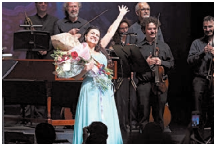
Чечилия Бартоли на сцене Мариинки-2.

Но изюминкой концерта стали арии Франческо Доменико Арайи, Германа Фридриха Раупаха и других европейских авторов, работавших в Петербурге и писавших для русской сцены. Чечилия разыскала их несколько лет назад в архивах Мариинского театра и записала на диск «Санкт-Петербург» (на сегодня самой свежей из ее пластинок), возвратив из