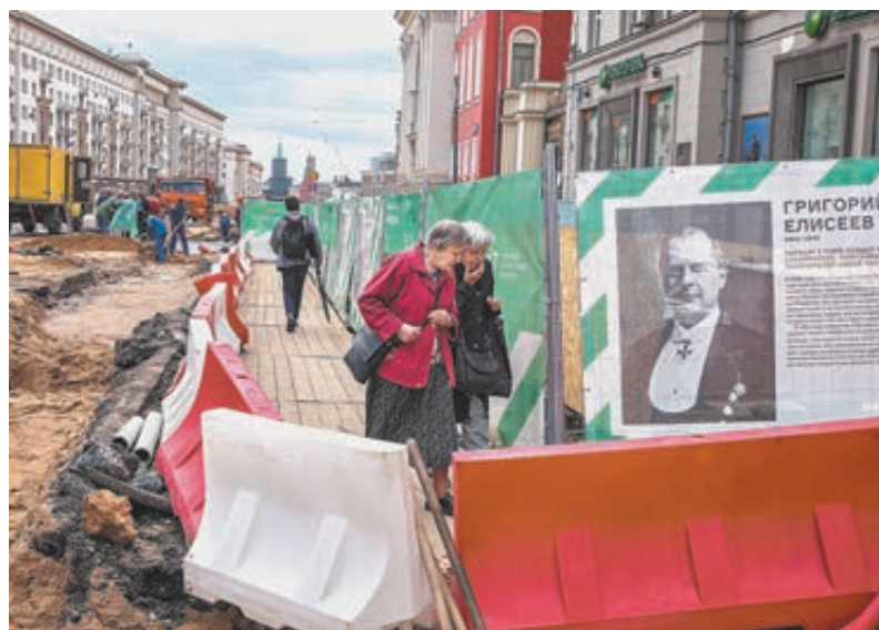
Москва, улица Тверская, лето-2016.