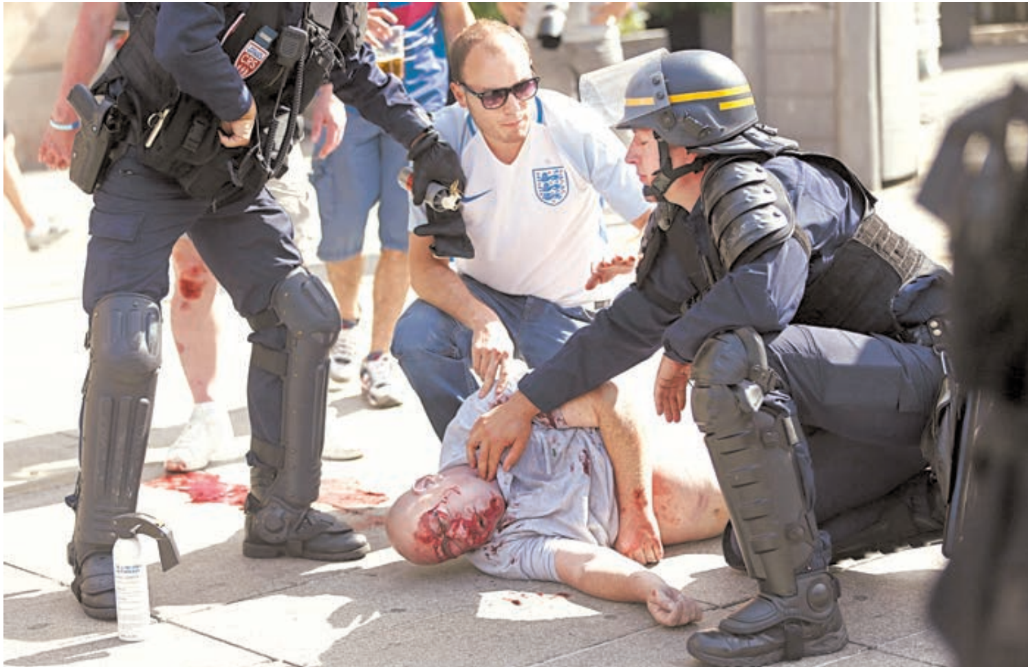
Фанаты. Кровь. А футбол где-то в стороне.

В уличных схватках сильнее оказались российские фанаты, но гордиться здесь нечем