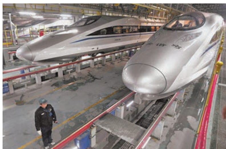
Так выглядит типичное китайское депо...

«Мы надеемся в 2016 году выйти на межправительственное соглашение с Китаем по строительству высокоскоростной магистрали Москва – Казань», – заявил на этой неделе в Шанхае министр транспорта РФ Максим Соколов. Китай согласился дать кредит в 400 млрд рублей на 20 лет на строительство магистрали без госгарантий со стороны России. Если все сложится, РФ получит первую настоящую высокоскоростную железнодорожную ветку. В Китае таких – 20 тысяч километров.