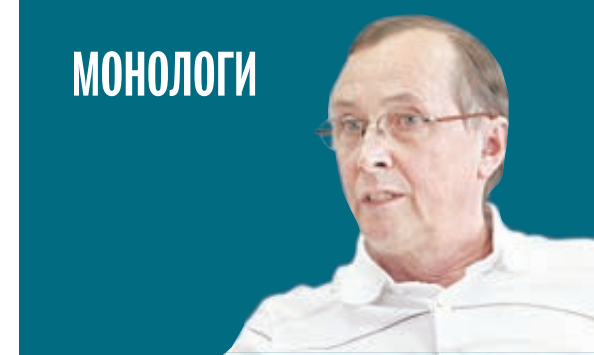
НИКОЛАЙ БУРЛЯЕВ ПРЕЗИДЕНТ МЕЖДУНАРОДНОГО КИНОФОРУМА «ЗОЛОТОЙ ВИТЯЗЬ»