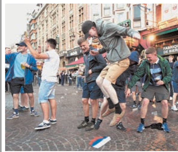
Британские фанаты глумятся над российским флагом.

«Менее чем через два месяца я надеюсь выйти в сектор прыжков с шестом на Олимпийских играх в Рио. Это будут мои пятые и последние Игры в карьере – уникальное дости-