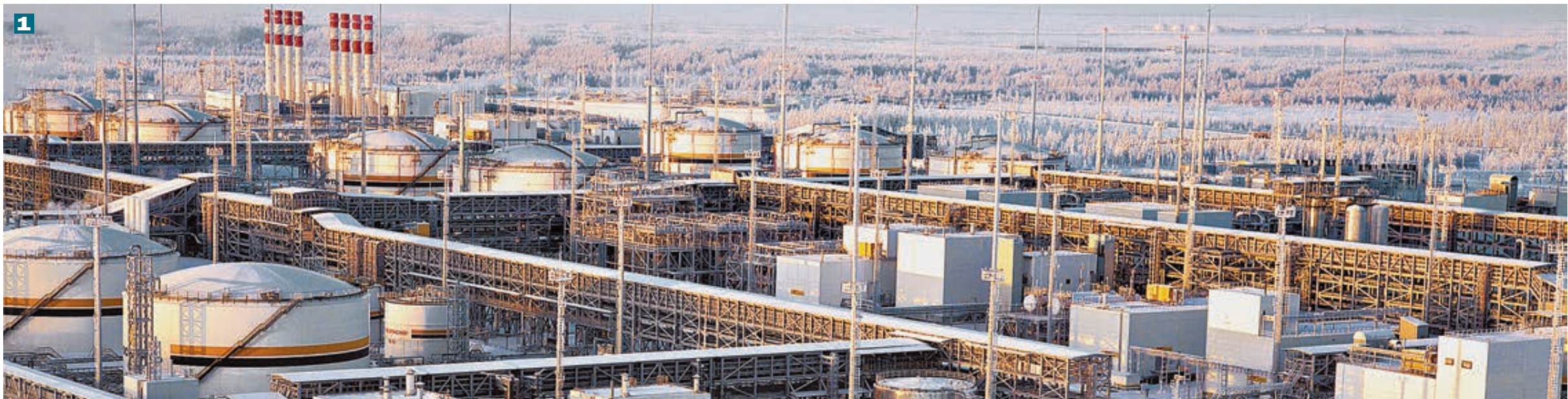
1 Месторождения «Роснефти» на Ванкоре 1, Сахалине 2 и Таас-Юрях 3 представляют огромный интерес для западных инвесторов.

В результате сделки структура акционеров компании включит двух новых якорных инвесторов мирового класса. Государство при этом сохранит контрольный пакет акций, а в целом будет обеспечен баланс интересов государства и акционеров