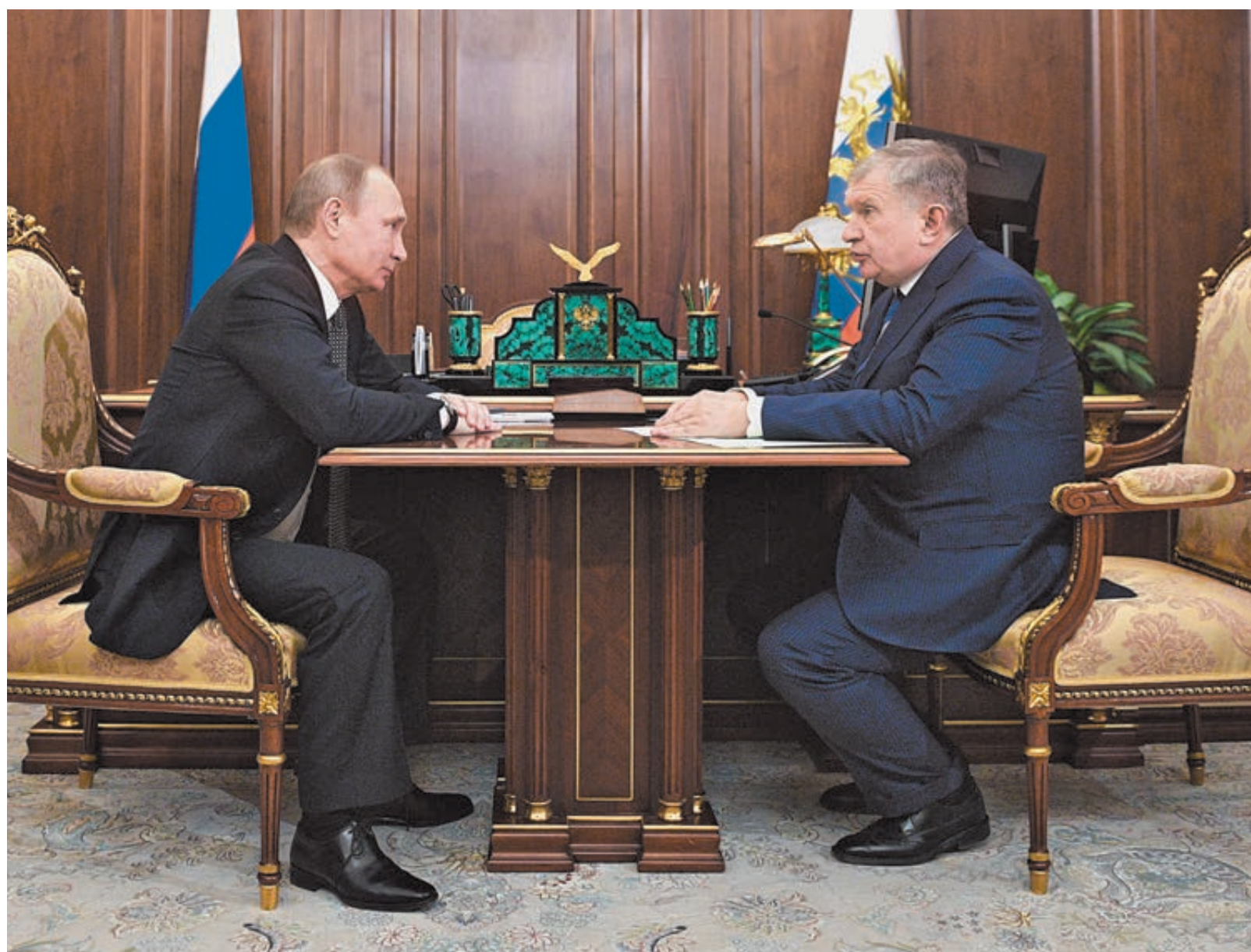
7 декабря в Кремле глава «Роснефти» Игорь Сечин доложил президенту Владимиру Путину о приватизационной сделке.

По оценкам экспертов, все приватизационные сделки в российской нефтянке (кроме «Роснефти») за четверть века оцениваются в 8,2 млрд долларов. При этом только за нынешний год в условиях тяжелой конъюнктуры в отрасли и в связи с острой потребностью бюджета в деньгах практически за два месяца «Рос-