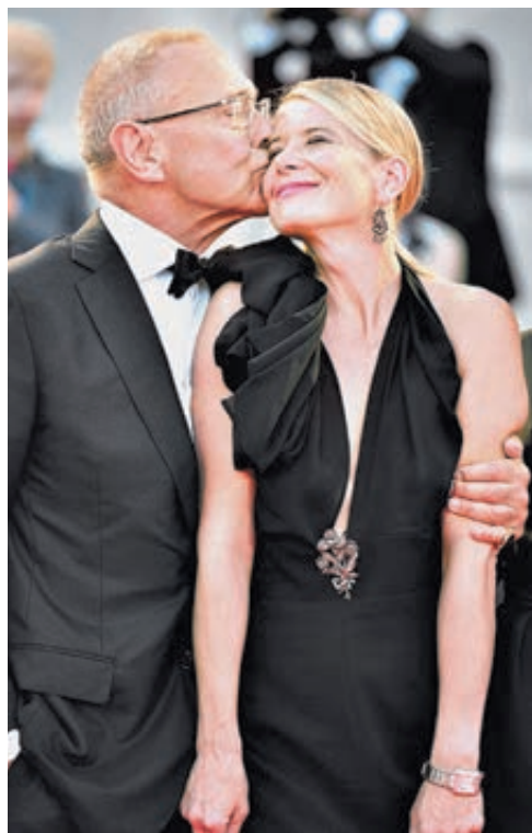
Андрей Кончаловский и Юлия Высоцкая.