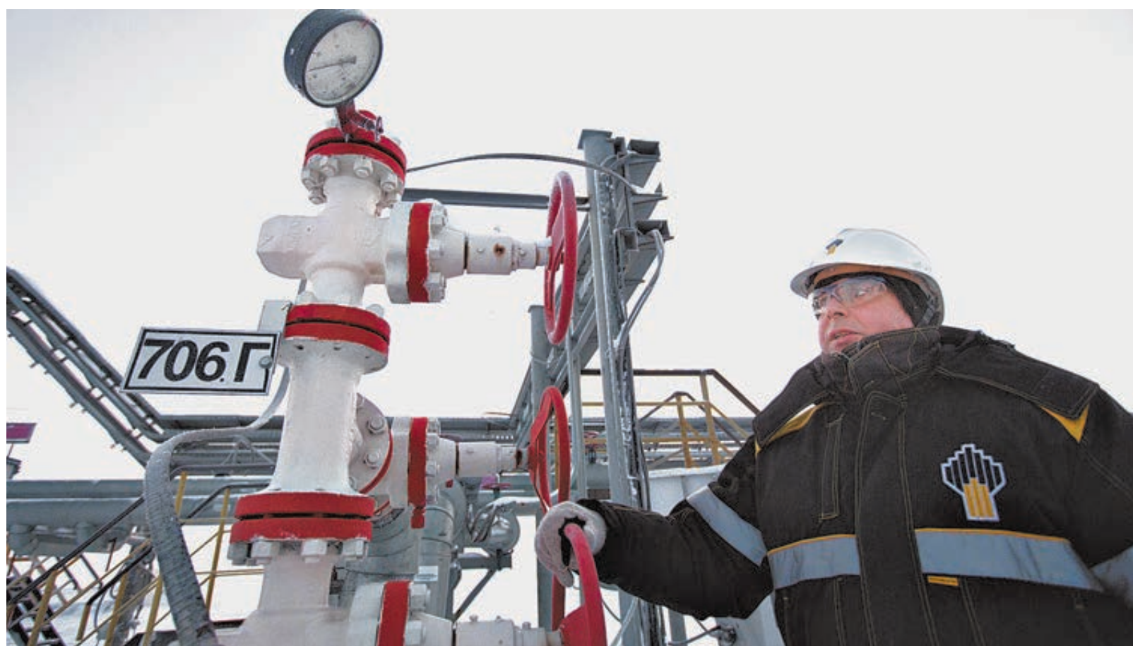
Полярная ночь: на месторождении Русское кипит работа.

А самое главное – ее много под землей: геологические запасы – полтора миллиарда тонн (официально – более 1,4 млрд). Это чуть меньше, чем у всей Мексики, но больше, чем у Эквадора, Азербайджана, Норвегии, Индии... Правда, из-за того что нефть тяжелая, извлекаемых запасов геологи насчитали втрое меньше