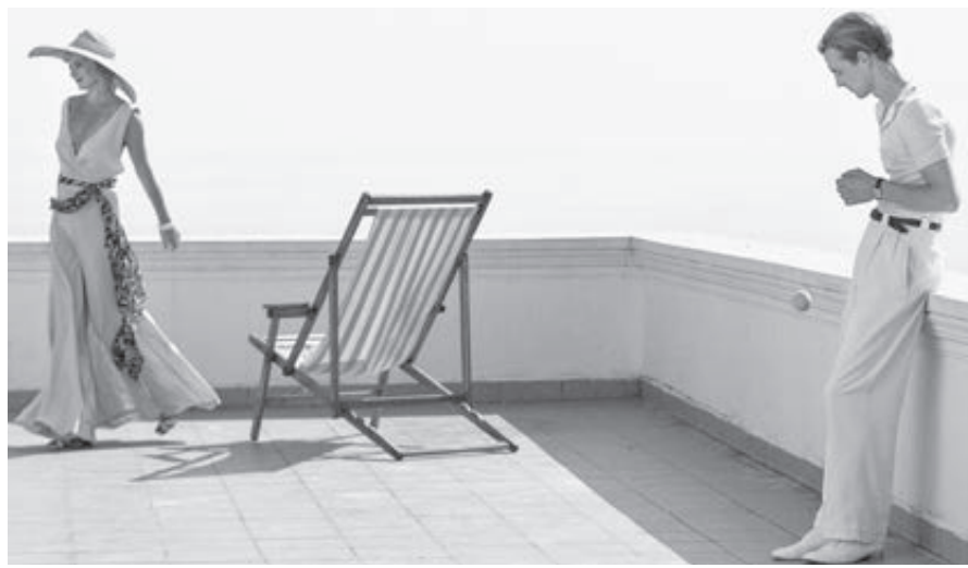
Кадр из фильма «Рай».

Эти разговоры двигают драматургию, обнажают характеры, ведут к неожиданной и весьма драматичной развязке. Одним словом, театр, возможно, редкостно отменный театр, снятый в стильном, весьма любимом фестивалем черно-белом изображении. Но волшебство, неувольную ткань вибрирующей, изменчивой, говоря слогом Льва Толстого, «живой жизни» надо все-таки искать не в статичном «Раю», а где-то в другом месте. Да хотя бы в давних фильмах Кончаловского – «Романс о влюбленных», «Сибиряда», «Ася Клячина», в которых выверенного мастерства было, возможно, чуть меньше, а кинематографическая горькая и неизменно ранящая каждое отзывчивое человеческое сердце тему холокоста. В центре «Рая» три персонажа: французский жандарм-коллаборационист Жюль (Филипп Дюкен), немецкий эсэсовец Хельмут (Кристиан Клаус) и рус-