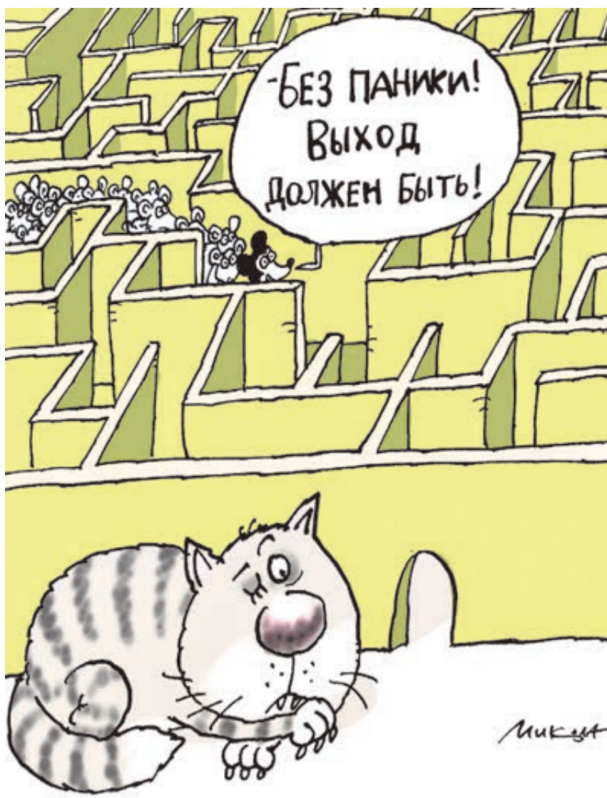
ИЛЛЮСТРАЦИЯ НИКОЛАЯ ВОРОНЦОВА/CARTOONBANK.RU

Тем не менее переходить к зарабатыванию дополнительных доходов правительство, судя по всему, пока не планирует. Составленный «антикризисный план – 2017» ценной в 488 млрд рублей, по мнению экспертов, не содержит реальных мер, направленных на рост эконо-