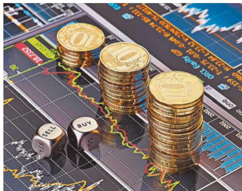
Сразу после сделки акции «Роснефти» выросли на 7%.

с половиной раза превосходящие все приватизационные доходы по всем отраслям! Продажа пакетов акций «Башнефти» и «Роснефти» обеспечила значительные бюджетные поступления, снизив дефицит бюджета на 1,2 процентных пункта. При этом «Роснефть» остается крупнейшим налогоплательщиком страны. В 2015 году компании