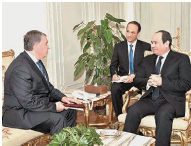
В Каире глава «Роснефти» встретился с президентом Египта.

Стоимость доли, приобретаемой «Роснефтью» у Eni, составляет 1,125 млрд долла-