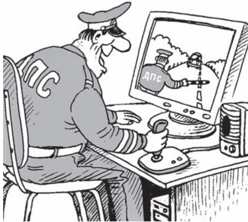
ИЛЛЮСТРАЦИЯ ВАЛЕНТИНА ДУБИНИНА/SARTOONBANK.RU

На мои обращения прокуратура, обязанная надзирать за действиями госструктур, ответила отказом. Письмо на имя начальника ГУ ГИБДД Москвы полковника Коваленко, в котором я предлагал в досудебном порядке компенсировать мне физические и моральные издержки в скромной сумме 5 тысяч рублей, осталось без ответа. То есть меня опять посылают на три буквы: в суд.