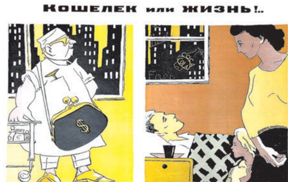
ФОТО ИЗ ОТКРЫТЫХ ИСТОЧНИКОВ

Объективности ради отметим, что есть и определенные успехи в государственном здравоохранении. Так, существенно больше стали делать сложных операций в рамках высокотехнологичной медицинской помощи. Но нельзя не замечать и другого: реформы в нашей медицине не дали ожидаемых результатов. Наоборот, проводимая оптимизация, широкое внедрение в госсектор платных услуг вызывают недовольство и возмущение пациентов, особенно малообеспеченных и пожилых. И не только в глубинке. В докладе «О национальной системе защиты прав потребителей» на заседании президиума Госсовета (вел Владимир Путин) было отмечено, что наибольшее количество обращений по вопросам качества и безопасности медицинской деятельности в расчете на 100 тысяч населения поступает от жителей Москвы, а также Магаданской области, Севастополя, Московской области, Санкт-Петербурга... Общее количество обращений возросло за последние два года в полтора раза и достигло 37,7 тысячи. Проверки выявили существен-