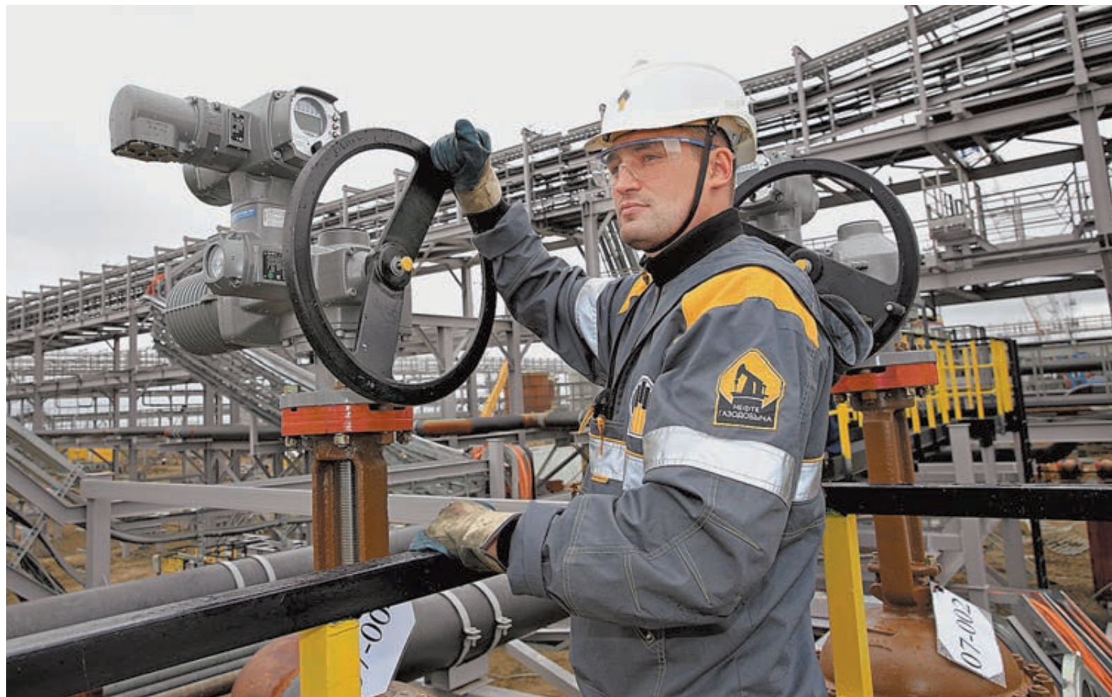
Работы на Сузунском месторождении.

В настоящее время «Роснефти» принадлежат 28 лицензионных участков на арктическом шельфе с суммарными ресурсами