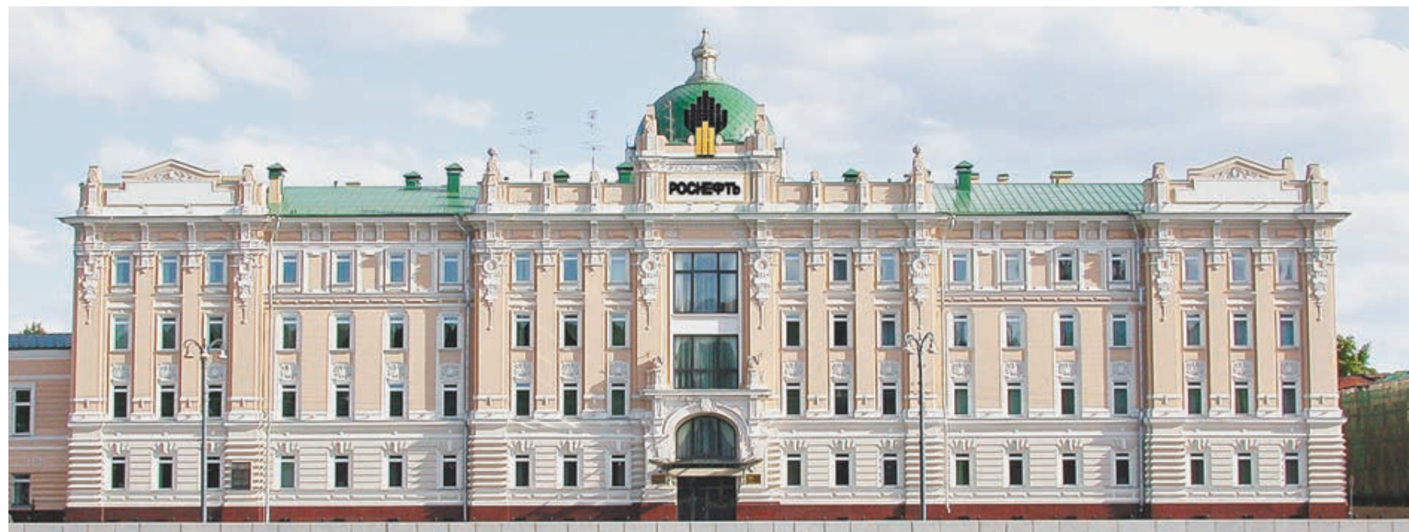
Штаб-квартира «Роснефти» на Софийской набережной в Москве.

Продолжается опытно-промышленная разработка Юрубчено-Тохомского месторождения, которое готовится сейчас к запуску