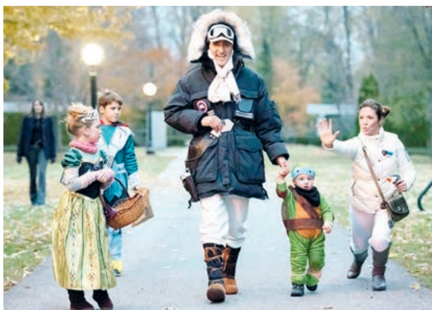
Премьер-министра Канады на прогулку может встретить каждый.

Во время пути в сумерки стараемся вести оживленную беседу, помогаем водителю отогнать дремоту. Впрочем, на тот случай, если его сморит сон и машину поведет к встречной полосе, по обоим краям нанесена сплошная рифленая «линейка»: она сразу даст знать о себе хорошей встряской автомобиля. До мелочей продумана безопасность водителя и пассажира. Бросаются в глаза предупредительные знаки о возможной встрече с лосями и оленями.