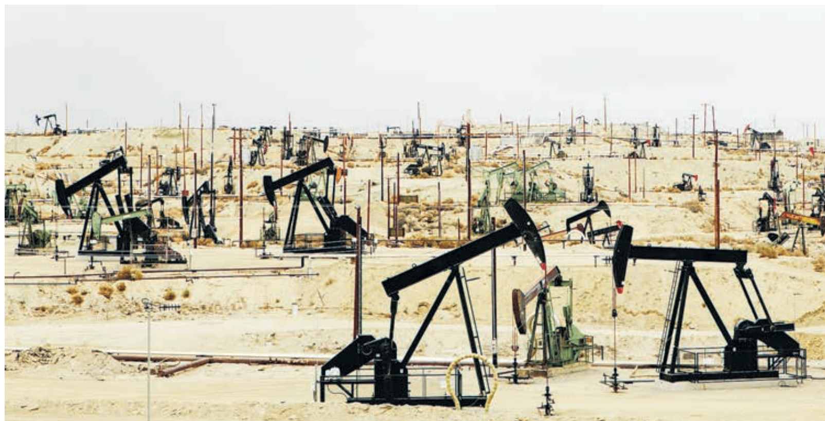
Калифорния. Американцы революцию на рынке добычи сланцевой нефти делают за чужой счет.