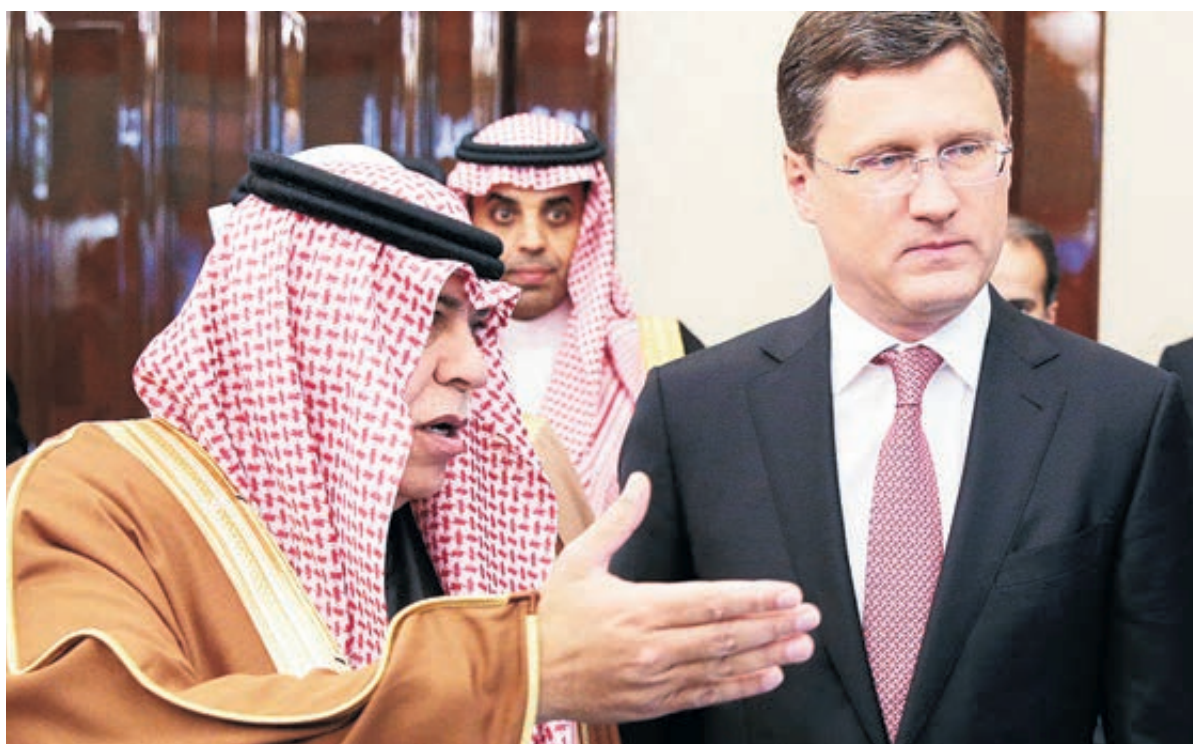
Российские договоренности в рамках ОПЕК+ действуют до июля 2019-го.