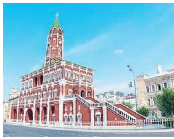
ФОТО ПРОЕКТА «МОСКВА ГЛАЗЫМИ ИНЖЕНЕРА»

Отсюда перенесемся в Китай-город. Надевая очки VR на Ильинской площади, видим снесенный в 1934-