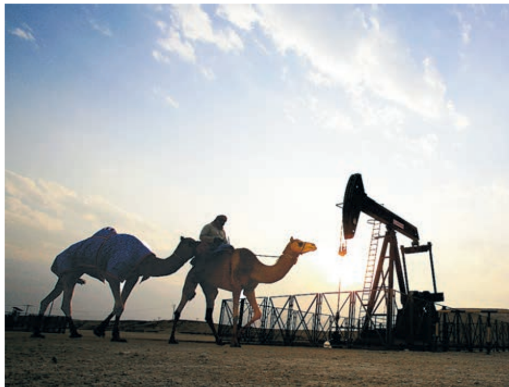
Саудовская Аравия готова регулировать добычу в интересах США.