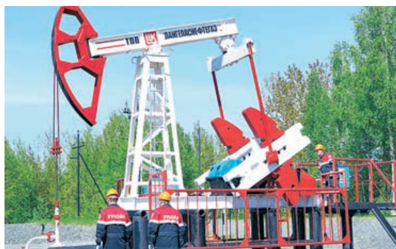
«ЛУКОЙЛ» ничем не рискует, поддерживая ОПЕК+, поскольку у компании уже идет естественное сокращение добычи нефти.