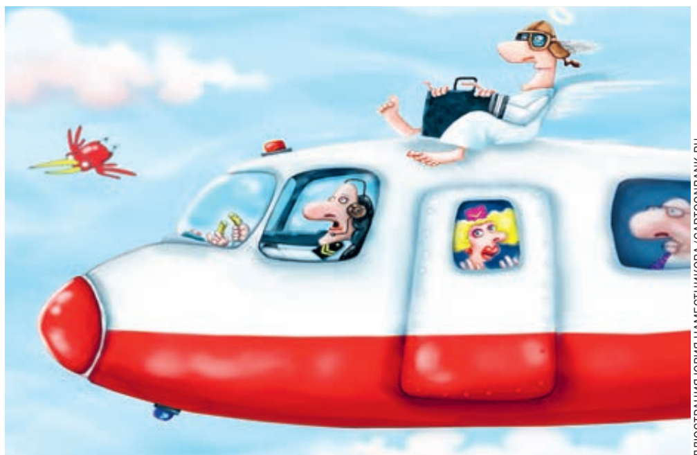
ИЛЛЮСТРАЦИЯ ЮРИЯ НАМЕСТНИКОВУ CARTOONBANK.RU

Чудесное спасение 226 пассажиров Airbus A321, совершившего посадку на кукурузное поле в Подмосковье, затмило все августовские события. Экипаж «Уральских авиалиний» мгновенно стал ньюсмейкером мировых СМИ. И друзья, и недруги сходятся в одном: русские летчики проявили высочайший профессионализм, это повторение нашумевшего, воспетого в книгах и фильмах «чуда на Гудзоне». Герои! Но у каждого подвига есть обратная сторона. И нынешние чудеса не исключение.