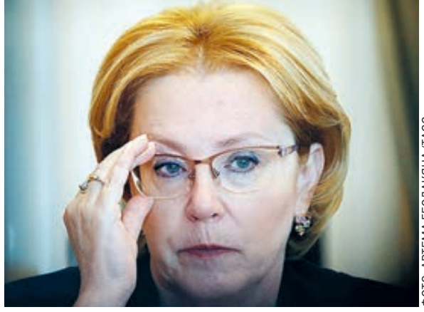
Не Вероника Скворцова затевала эти реформы...