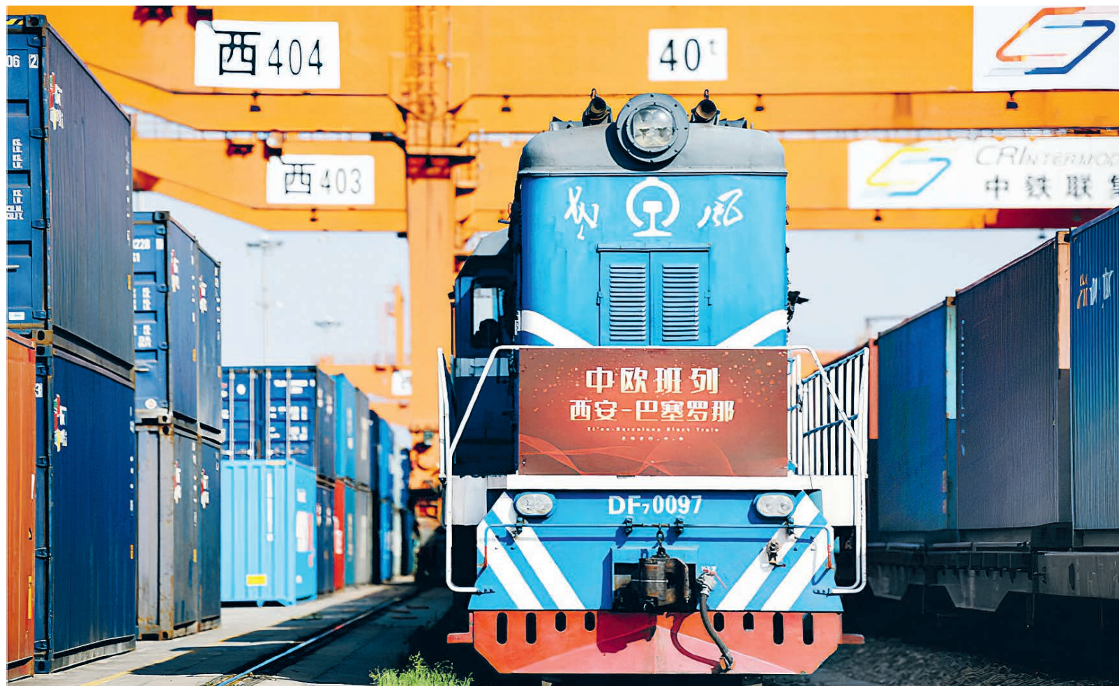
Китайско-европейский экспресс по маршруту Сиань – Барселона перед отправлением на станции Синьчжу в Сиане 8 апреля 2020 года. Общая протяженность маршрута – около 12 тысяч километров.

ния производства и деловой активности по нашей инициативе запущены «экспресс-коридоры» для поездок людей и «зеленые коридоры» для грузоперевозок, обеспечено устойчивое и бесперебойное функционирование производственно-логистических цепочек для возобновления социально-экономического развития. Народ в центре нашего внимания, нашей заботой окружен каждый находящийся за границей соотечественник. Специальные операции по консульской защите охватывают все уголки мира. Наши диппредставительства в тесном взаимодействии с правительствами стран пребывания уделяют должное внимание решению проблем, с которыми сталкиваются находящиеся на их территории китайские граждане. Функционирует дистанционная онлайн-площадка для своевременного оказания медицинской помощи заразившимся соотечественникам. Розданы порядка 1,2 млн «посылок здоровья», доставлены в более чем 100 стран разные виды противозидемических средств зарубежным соотечественникам, организованы более 350 чартерных рейсов для вывоза граждан. Круглосуточно работает горячая линия по оказанию консульских услуг по номеру 12308. Мост любви, связывающий Родину и зарубежных сограждан, тянется до любой точки земного шара и передает теплую заботу ЦК КПК и Госсовета каждому китайцу.