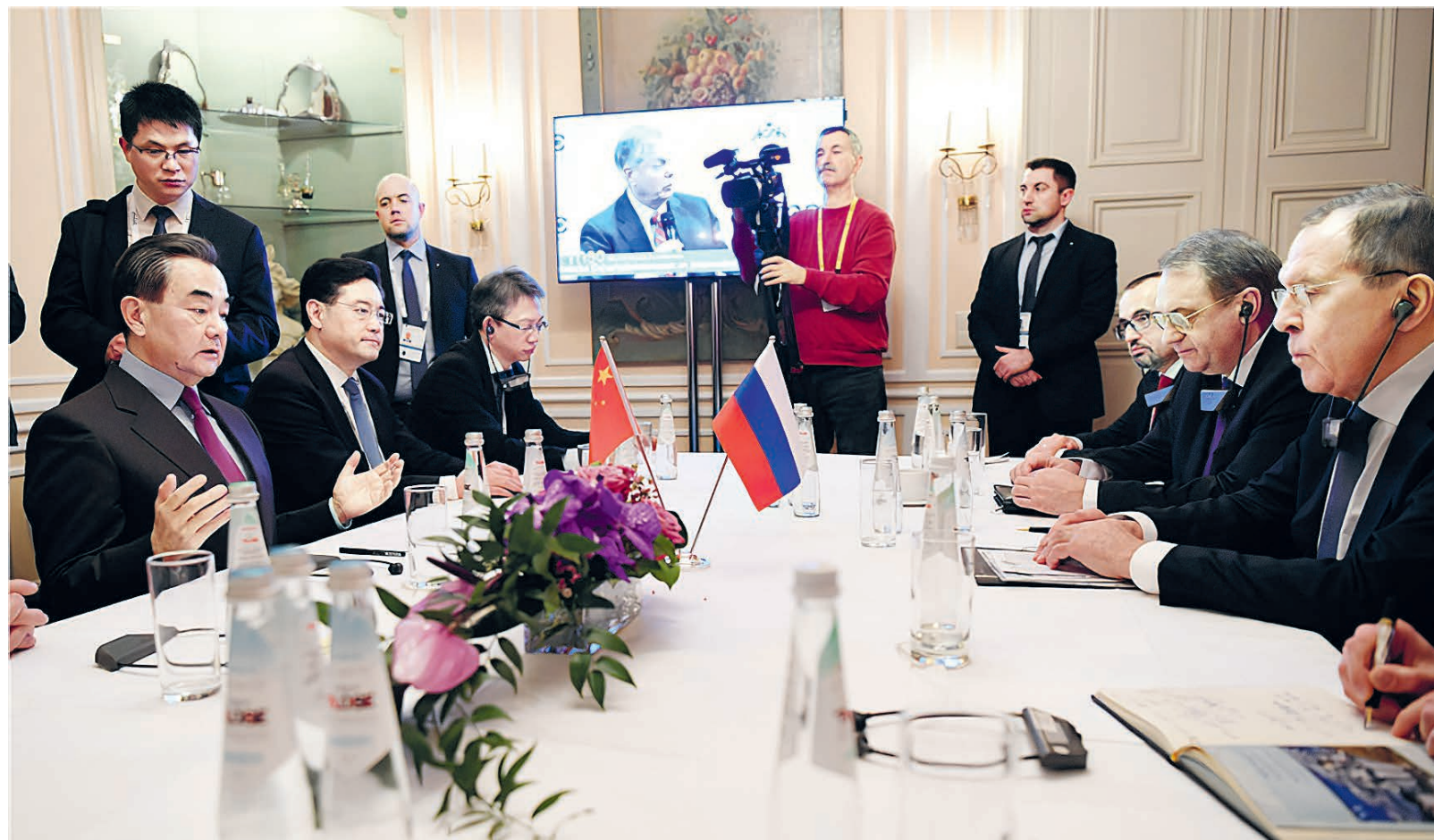
Переговоры министров иностранных дел КНР и России на полях Мюнхенской конференции.

Беззаветный труд на дипломатическом поприще служит развитию страны и интересам народа. Китайские дипломаты идут туда, куда зовет народ. В первые дни после вспышки коронавирусной инфекции МИД развернул глобальную кампанию по сбору медицинских средств, чтобы покрыть острый дефицит в стране. На фоне затяжной пандемии мы, объединив усилия всех союзников как в стране, так и за ее пределами, старались максимально переключить каналы завоза вируса для достижения победы над недугом. С момента начала восстановле-