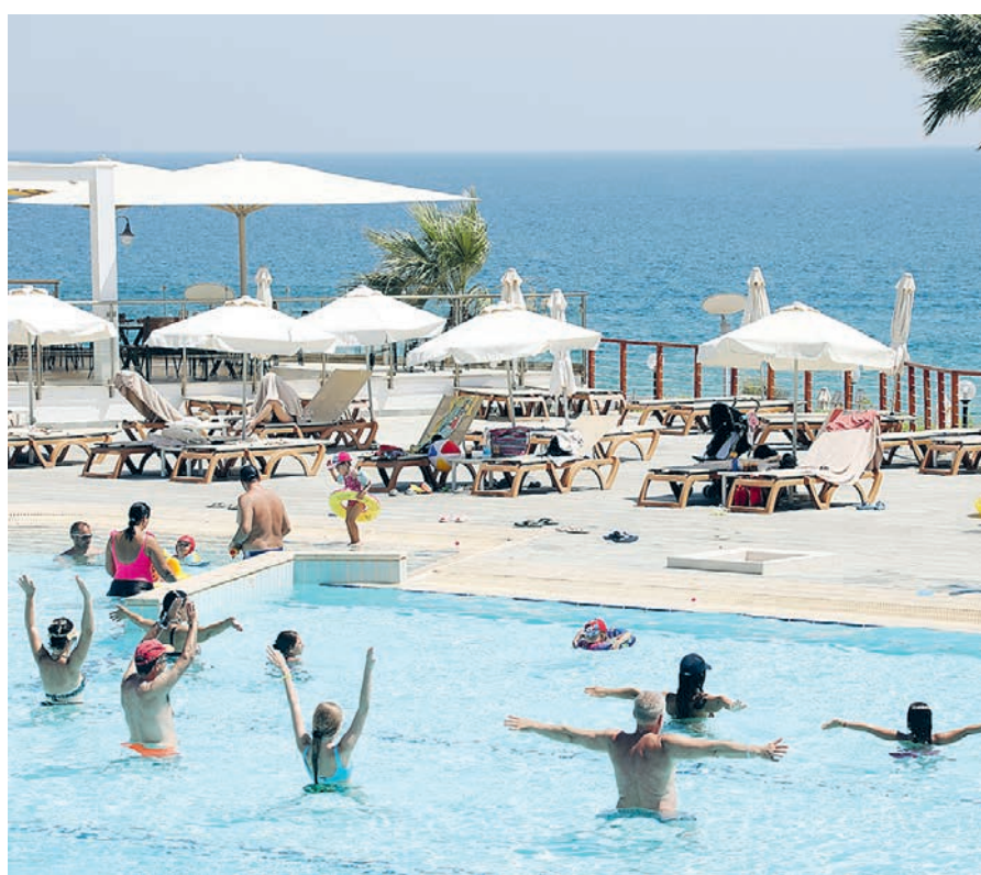
Этот Кипр по-прежнему остается только мечтой. Действительность куда суровее.