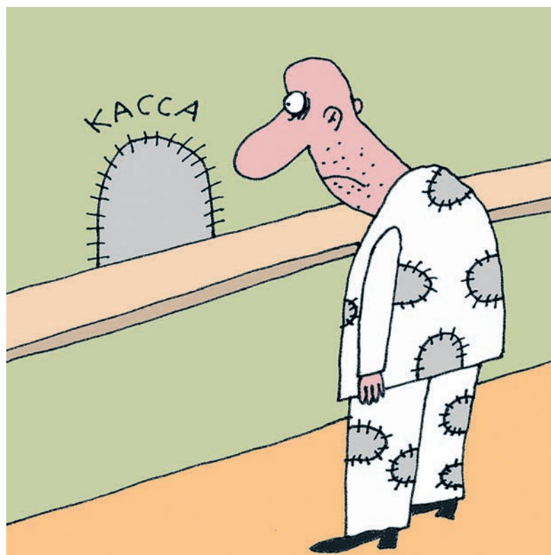
ИЛЛЮСТРАЦИЯ: ЕВГЕНИЙ ШИЛОВ / CARTOONBANK.RU

в месяц достаточно среднестатистическому россиянину для счастья, показали результаты январского исследования. В США это зарплата таксиста или сантехника, треть заработка металлурга, две трети – повара. А в Германии столько платят мойщику стекол зданий, работнику прачечной, официанту или чистильщику рыбы