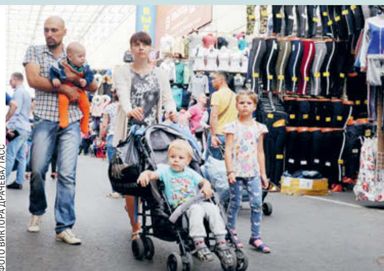
Многочленным семьям государство пообещало оказывать существенную помощь.

К слову, недавно Верховный суд постановил, что теперь пенсионеры вправе