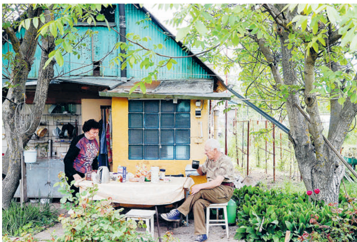
Такие фото есть в каждом семейном альбоме.

расовке сдавалась за 80 рублей. Такая аренда была по карману преуспевающим юристам, инженерам, чиновникам. Студенты и конторщики снимали комнаты за 10–15 рублей.