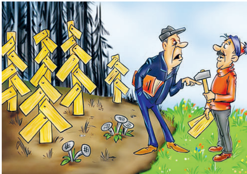
ИЛЛЮСТРАЦИЯ СЕРГИЯ САРГОТА