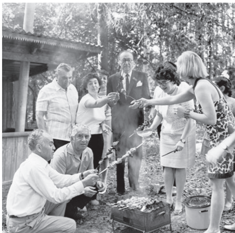
Композитор Арам Хачатурян принимает гостей на даче.

Вывезти семью летом за город считалось обязательным, невозможность снять дачу считалась признаком безнадежной нужды. Старинные барские усадьбы превращались в дачные местности. Многие помещики, в отличие от чеховской Раневской, не считали зазорным разбить свои земли на участки и отдать в аренду под дачи. Жилье строили в русском стиле, с резными наличниками, коньками и террасой для вечерних чаепитий. В те времена в Павловске под Петербургом дача с обстановкой из пяти комнат стоила 300 рублей за лето, а трехкомнатная дача с остекленной верандой в подмосковных Малаховке и Та-