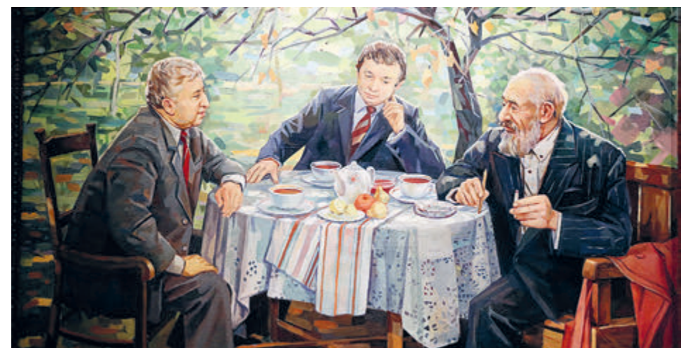
Расул Гамзатов (слева) запечатлен и в живописи.