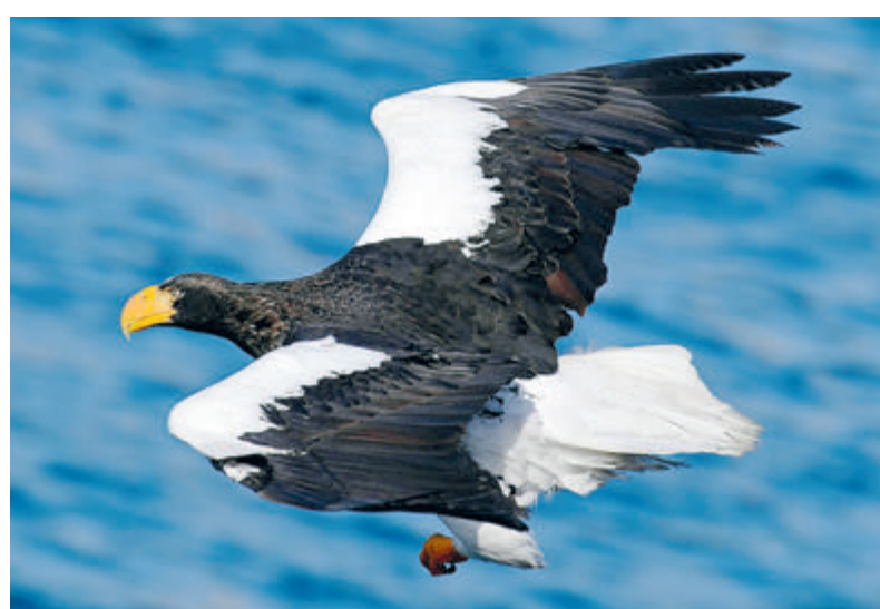
В Тюменской области стартовал грантовый проект, цель которого – изучение и мониторинг популяций редких и охраняемых видов птиц, которые включены в Красные книги региона и России.