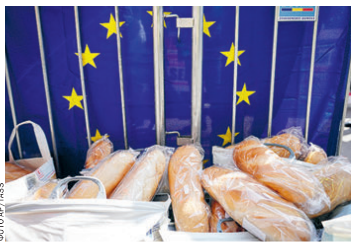
Так свой протест против импорта украинского зерна выразили румынские фермеры в Бухаресте.

Протесты фермеров в Восточной Европе против зернового цунами с территории Украины и отказ Еврокомиссии защитить рынок от демпинга вынудили младевропейцев ввести односторонние ограничения на импорт украинской аграрной продукции. Осажденные манифестантами правительства Венгрии и Польши 15 апреля запретили весь импорт зерновых, масличных культур и других сельхозпродуктов из Незалежной до 30 июня. Причиной стало заговаривание дешевой украинской продукцией собственных рынков и угроза разорения местных производителей. После выполнения призывов Брюсселя и США о поддержке вывоза украинского хлеба для спасения Африки реальность на местах оказалась менее возвышенной.