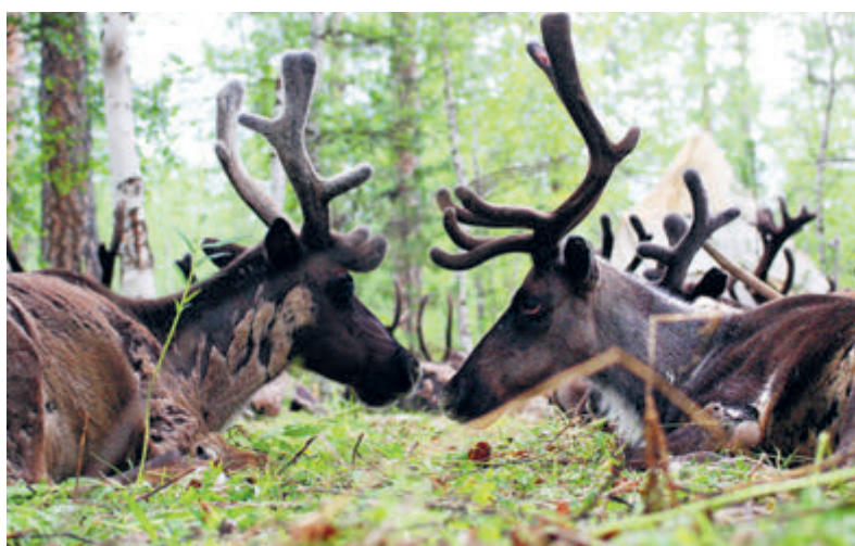
Учет численности диких северных лесных оленей не проводился более 20 лет! В настоящее время насчитывается около 77 тыс. особей парнокопытных.

В Тюменской области в этом году стартовал еще один грантовый проект, имеющий важное значение для сохранения биоразнообразия региона. Инициаторы проекта – предприятие «Роснефти» «РН-Уватнефтегаз» и Тюменский государственный университет. Основная его цель – изучение и мониторинг популяций редких и охраняемых видов птиц, которые включены в Красные книги Тюменской области и России. В полевой сезон 2022 года экологи провели маршрутные исследования в долине реки Иртыш. Специалисты фиксировали визуальные встречи птиц, их голоса и