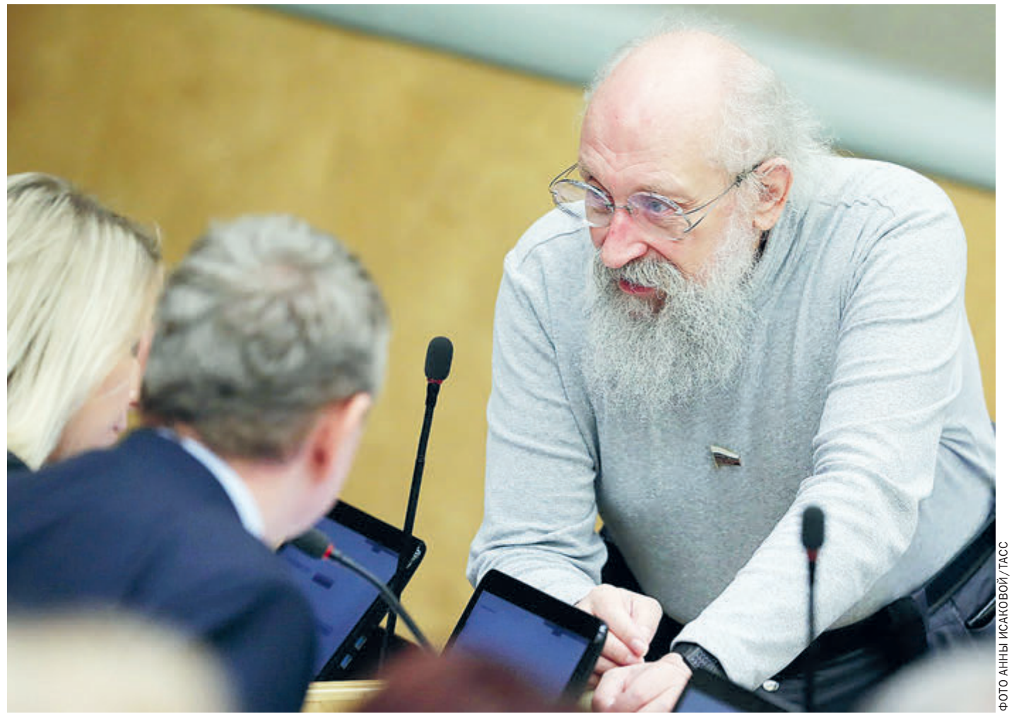
Анатолий Вассерман умеет удивить публику даже в Госдуме.

Тут уж взвились не только депутаты, но и члены правительства. Министерство финансов сообщило, что не обсуждает и не рассматривает введение декларирования наличных средств в размере более миллиона рублей: «Данная инициатива не соответствует финансово-экономической политике и не отвечает интересам граждан, которые вправе самостоятельно выбирать, каким образом хранить свои сбережения». Позиция объяснима: под этот закон, будь он принят, попали бы не только бабушки-пенсионерки, которым удалось скопить на старость в чулке скромную сумму, но и чиновники, и те же депутаты, для которых миллион – тьфу, карманные деньги.