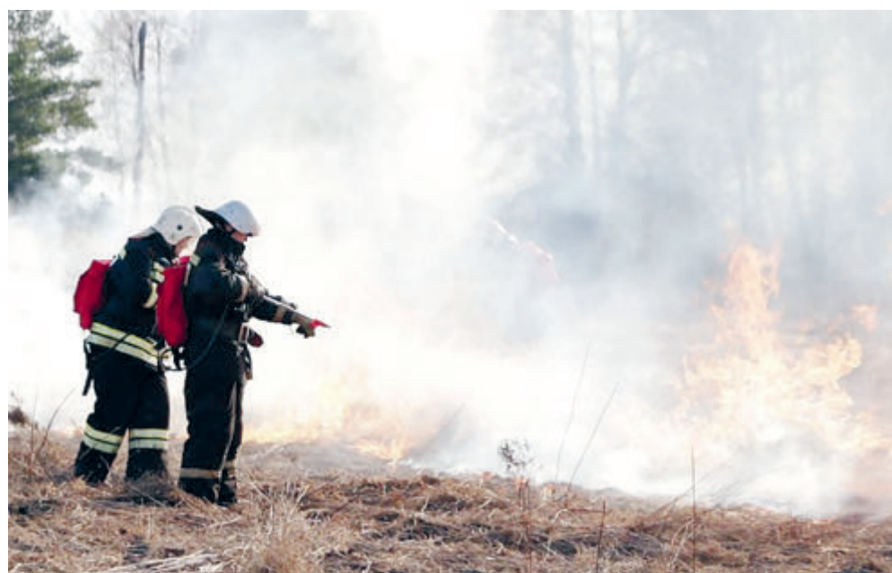
На этой неделе горело и во владимирских лесах.

В Якутии глава республики Айсен Николаев объясняет прошлогодний успех – снижение площади лесных пожаров в 14 раз в сравнении с 2021 годом – серьезной и хорошо оплачиваемой работой по противопожарной защите. «В 2023 году объем субвенций из федерального бюджета на осуществление отдельных полномочий в области охраны лесов сохранен на уровне 2022 года, – рассказывает глава Якутии. – Из республиканского бюджета выделено на 70 млн больше – 990 млн рублей».