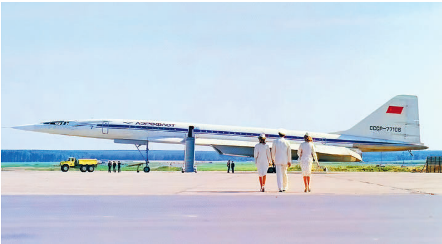
Вот он, самолет-мечта, ставший одним из героев фильма «Мимино».

Что же касается Ту-144, то судьбу уникального проекта подкосила катастрофа, погубившая жизни шести человек экипажа во время показательного полета на авиасалоне в Ле Бурже в 1973 году. Причина произошедшего до сих пор не-