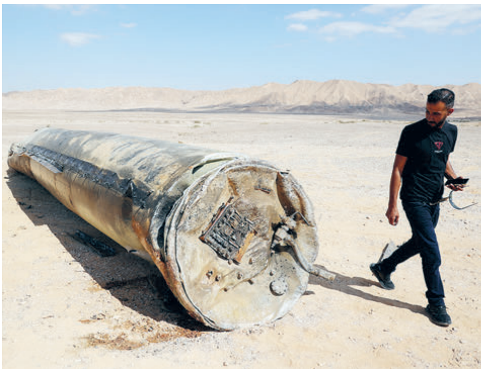
Баллистическая ракета, выпущенная со стороны Ирана, на юге Израиля.

Тегеран настаивает: удар наносился исключительно по военным объектам, о чем говорит отсутствие жертв среди мирных жителей, однако в следующий раз Израилю может прилететь уже по инфраструктуре и гражданскому населению. Иранцы утверждают, что в результате ударов была взорвана штаб-квартира МОССАД, организовавшей операцию со взрывами пейджеров и охоту на Хасана Насраллу. Болезненным политически и финансово для американских