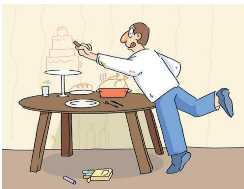
ИЛЛЮСТРАЦИЯ НАСТАСЬИ НОВАКОВСКОЙ

Это, конечно, замечательно, что наша страна кроме нефти и газа может поставлять за рубеж и другую жизненно важную продукцию. И бюджет пополняется за счет налоговых и таможенных платежей. Но как это отражается на кошельках граждан и на разнообразии и доступности продуктов питания россиян?