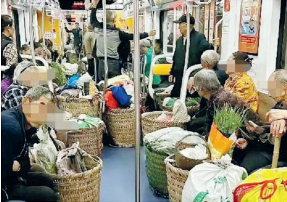
Китайские крестьяне в метро везут на продажу дары земли.

Эту продукцию с удовольствием покупают и местные рестораны, коих