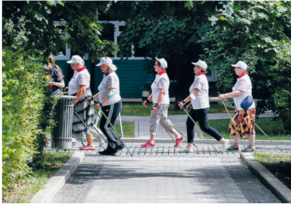
Московские пенсионеры во время занятия скандинавской ходьбой.

Кстати, знаете ли вы, что в нашей стране существует общероссийская общественная организация «Союз пенсионеров России» с 2 тысячами отделе-