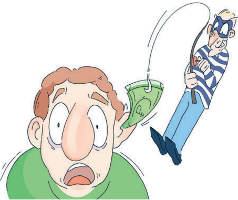
ИЛЛЮСТРАЦИЯ НАСТАСЬИ КОВАЛЕВСКОЙ

случаев краж с банковских счетов россиян зафиксировано за девять месяцев текущего года. А сколько еще незарегистрированных хищений?