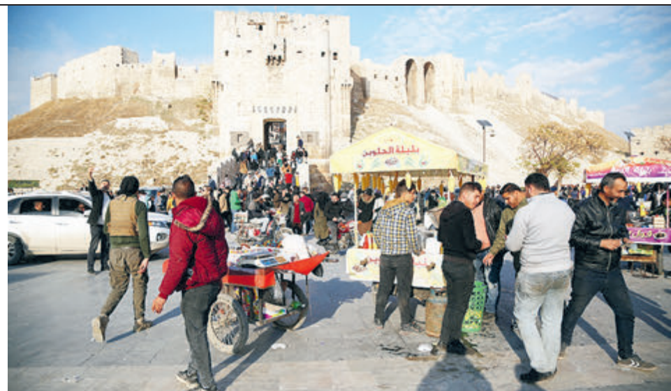
Старый город Алеппо переживает очередные потрясения...

В 2013 году, когда Крак-де-Шевалье захватили террористы, ЮНЕСКО внесла оба замка в список объектов, находящихся под угрозой. Да что там рыцарский замок, когда повредили в гражданской войне даже святая святых – мечеть Омейядов в Алеппо! Был разрушен минарет, возведенный при турках-сельджуках, взорваны двери мечети, стены изрешечены пулями. Алеппо вообще сильно пострадал, чудом не разрушен национальный музей в его центре. Экспонаты частично вывезли в укрытия, и все же сегодня от прежнего великолепия в залах одни воспоминания. Была повреждена средневековая крепость на высоком холме, историческому рынку в Старом городе нанесен непоправимый ущерб. В Сирии, как и в целом на Востоке, веками мирно уживались люди