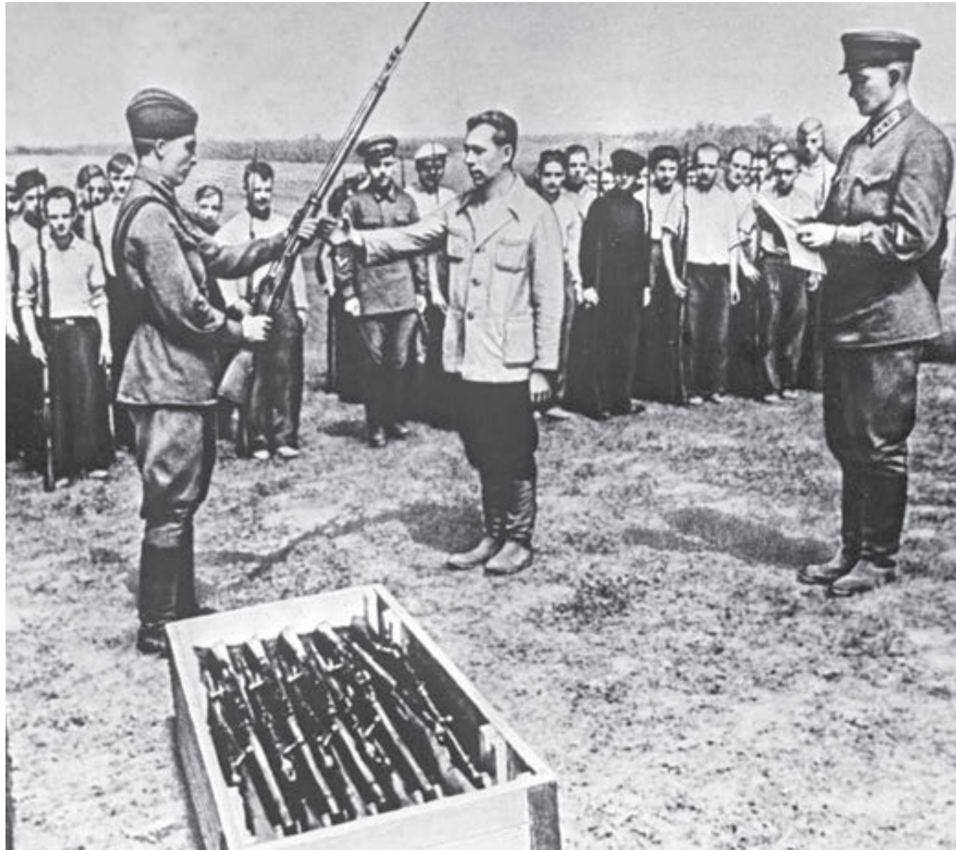
1 июля 1941 года. Офицер Красной Армии вручает московским ополченцам боевое оружие. 12 из 16 дивизий ополченцев были сформированы еще в первый месяц войны

Заглавие такое же: «Они отстояли Москву», а подзаголовок — «По зову сердца, по велению совести». Мы хотим отойти от летописно-архивной составляющей, взять за основу воспоминания выживших ополченцев, их письма. Посмотреть на войну их глазами. И мы бросили клич: если кто-то из ваших родственников воювал в ополчении и у вас хранятся материалы о них (в том числе фотокарточки, личные вещи), пришлите их в наш музей. Неужели у вас собрано недостаточно материала? В принципе мы могли бы написать эту книгу и только на основе наших фондов. Но