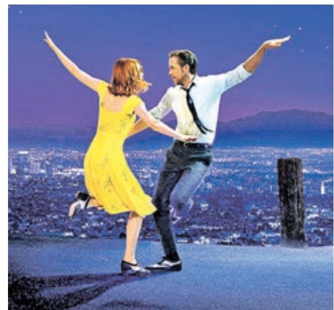
Кадр из фильма «Ла-Ла Ленд» Дэмьена Шазелла

То, что это не просто «западная тенденция», а тенденция всеобщая, ясно хотя бы по тому, что что-то подобное уже несколько лет происходит и в России. Голливуд, нам, конечно, ничем — мы сами сусами. Но у нас эти давно уже размочены в «Стилягах», «Оттепели», «Таинственной страсти» и в прочих ностальгических киноплотнах. И, кажется, чем дальше, тем больше все это приобретает масштабные очертания. При этом сопротивляться данной тенденции нет никакого желания. Да и незачем, по правде говоря.