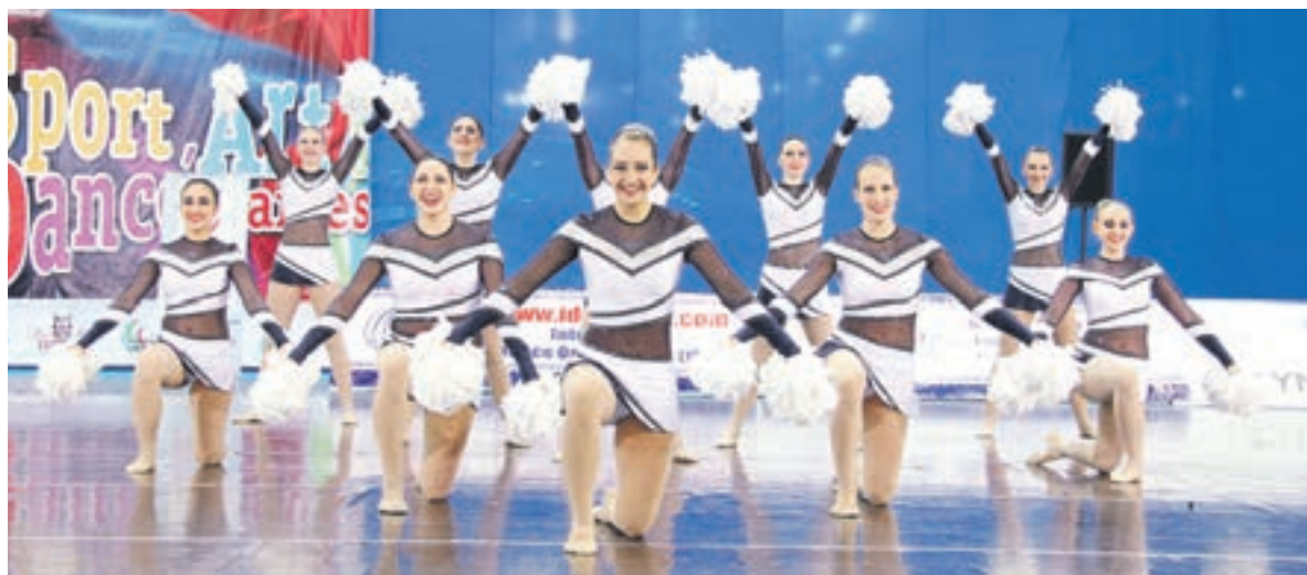
Октябрь 2016 года. Команда Neo dance с блеском выступила на первенстве России по чирлидингу, который проходил в городе Сочи