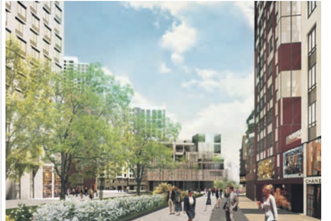
Проект нового жилого квартала, который построят по соседству с деловым центром «Москва-Сити». Жилые высотки появятся на месте мукомольного завода

ВАСИЛИСА ЧЕРНЯВСКАЯ v.chernyavskaya@vm.ru