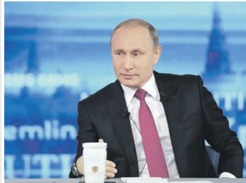
Вчера 13:45 Президент России Владимир Путин ответил на 73 вопроса жителей нашей страны

О протестах оппозиции Я готов разговаривать со всеми, кто нацелен на улучшение жизни людей, нацелен на то, чтобы решать стоящие перед Россией проблемы, а не использовать имеющиеся трудности, которых всегда и везде достаточно, для собственного политического пиара и собственной раскрутки.