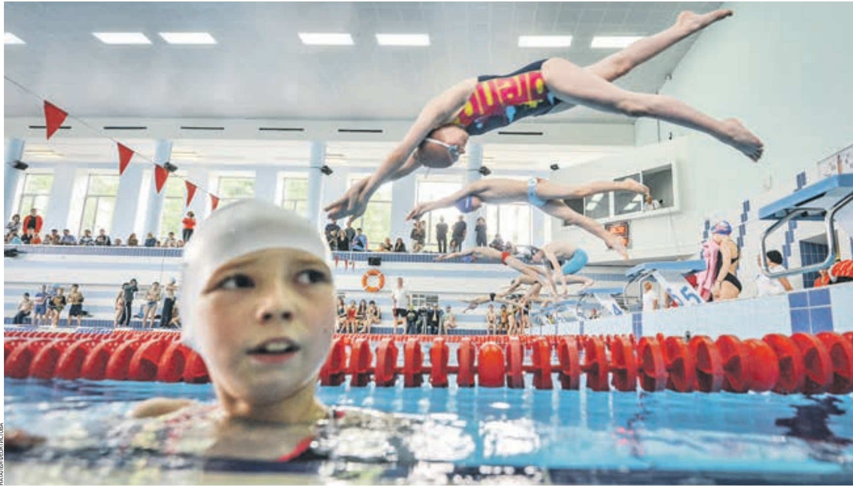
Вчера 15:30 Бассейн «Воробьевы горы». Воспитанники столичных детско-юношеских спортивных школ начинают массовый заплыв. В рамках акции «Научись плавать» школьникам продемонстрировали различные стили плавания и обучили их спасению людей на воде