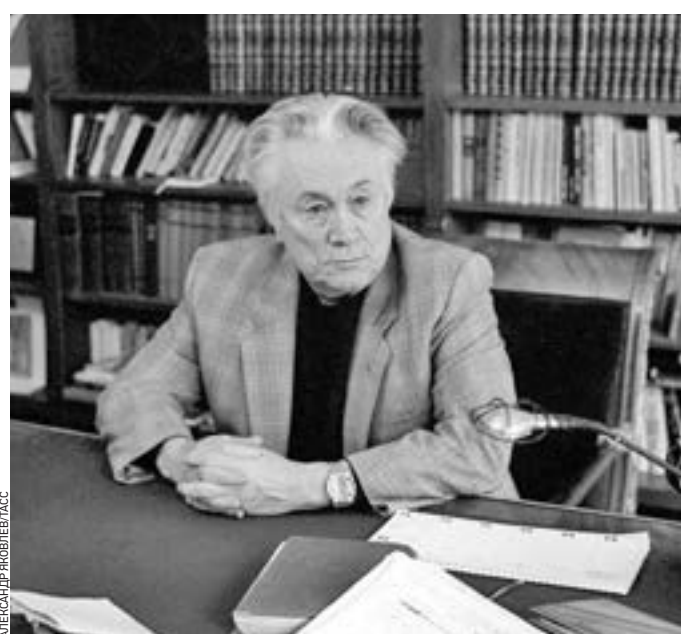
1991 год. Писатель Юрий Нагибин во многих своих произведениях описывал жизнь Москвы

Нагибин печатался в «Вечерней Москве» как минимум с 1942 года. Публиковал и статьи, и художественные произведения. Например, 10 августа 1960 года была напечатана глава из будущей книги «Чистые пруды» с пометой «Из рассказов, присланных на конкурс «Вечерней Москвы». Отношения Нагибина с нашей газетой не всегда складывались гладко. Вот отрывок из одного интервью писателя: «Один из главных редакторов старой «Вечерки» решил вдруг ее сделать намного более литературной: «Нам надо быть выше проблем дворника». Но эксперимент оказался неудачным: это не ампула вечерней газеты, у нее свое место. А уж сейчас что может быть выше проблемы дворника <...>? Хороший дворник — добрый гений дома...» Эти слова были напечатаны в «Вечернем клубе» — дочернем издании «Вечерки», которое выходило с 1991 по 2004 год. Во втором номере появилось интервью с Нагибиным. На вопрос, какой он хотел бы видеть новую газету, Нагибин ответил: «В том не легком труде «реанимации» Москвы <...> у всех, радующихся за такое, должно присутствовать это ощущение себя дворником — человеком, который встает раньше всех и посылкой наводит порядок. И у мэра, и у участковых, и у газетчиков...»