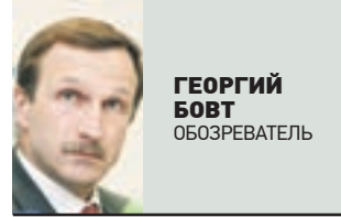
ГЕОРГИЙ БОБТ ОБОЗРЕВАТЕЛЬ ИНИЦИАТИВА