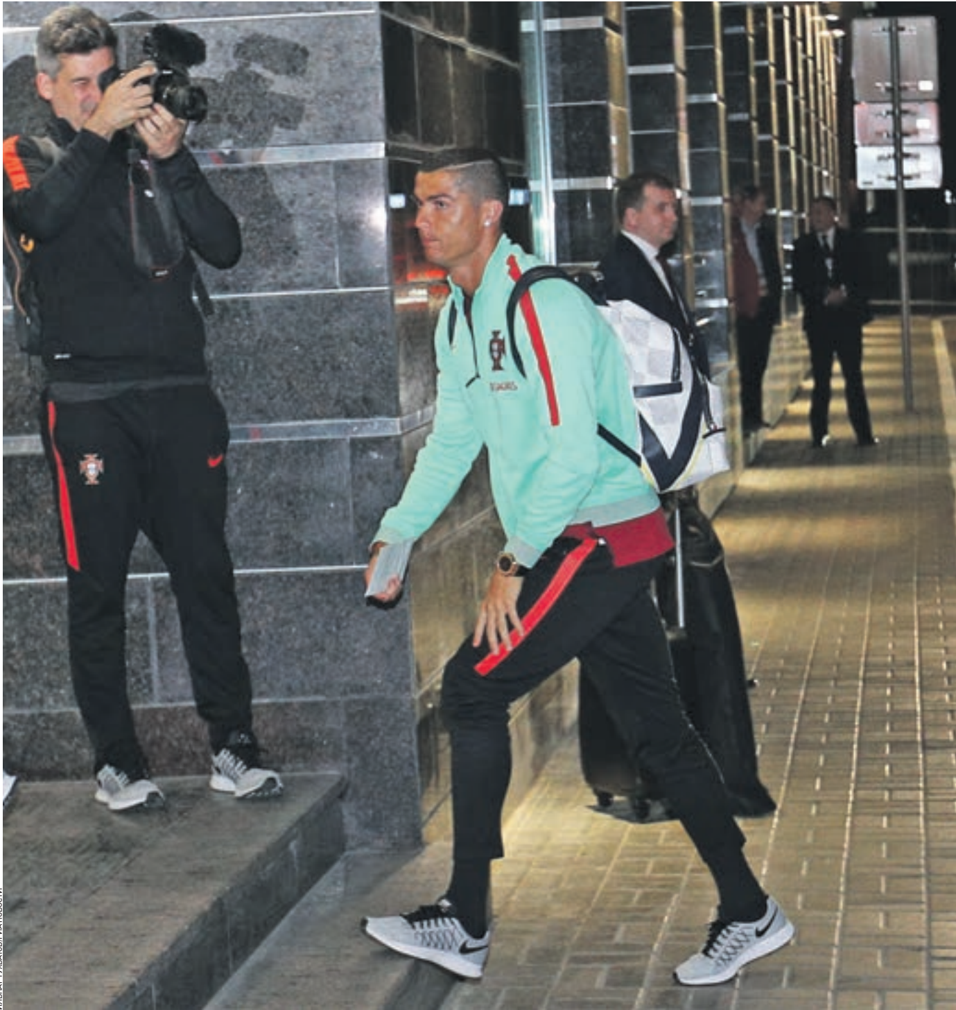
14 июня 20:45 Футболист сборной Португалии Кристиану Роналду вместе с командой заселяется в гостиницу в Казани. Впереди у команды игра в столице Татарстана, а затем переезд в Москву, где она встретится со сборной России