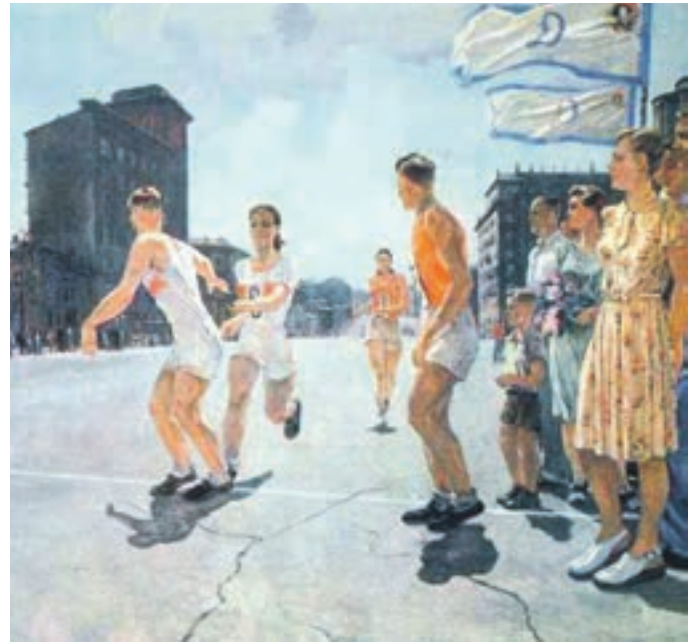
Картина Александра Дейнеки «Эстафета по кольцу Б», написанная в 1947 году

и количество участников все время были разными. Не отменялись состязания даже в дни войны. В 1944 году эстафета проводилась 7 мая. В тот день «Вечерка» опубликовала стихи Самуила Маршак: «Участник бега прошлогодней! / на фоне нынче побед врагов./ А завтра в бой