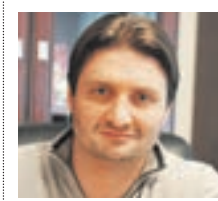
ЗДГАРД ЗАПАШНЫЙ Артист цирка

прошел праздник святого Трифона-мышегона, который помог объединиться любящим сердцам.