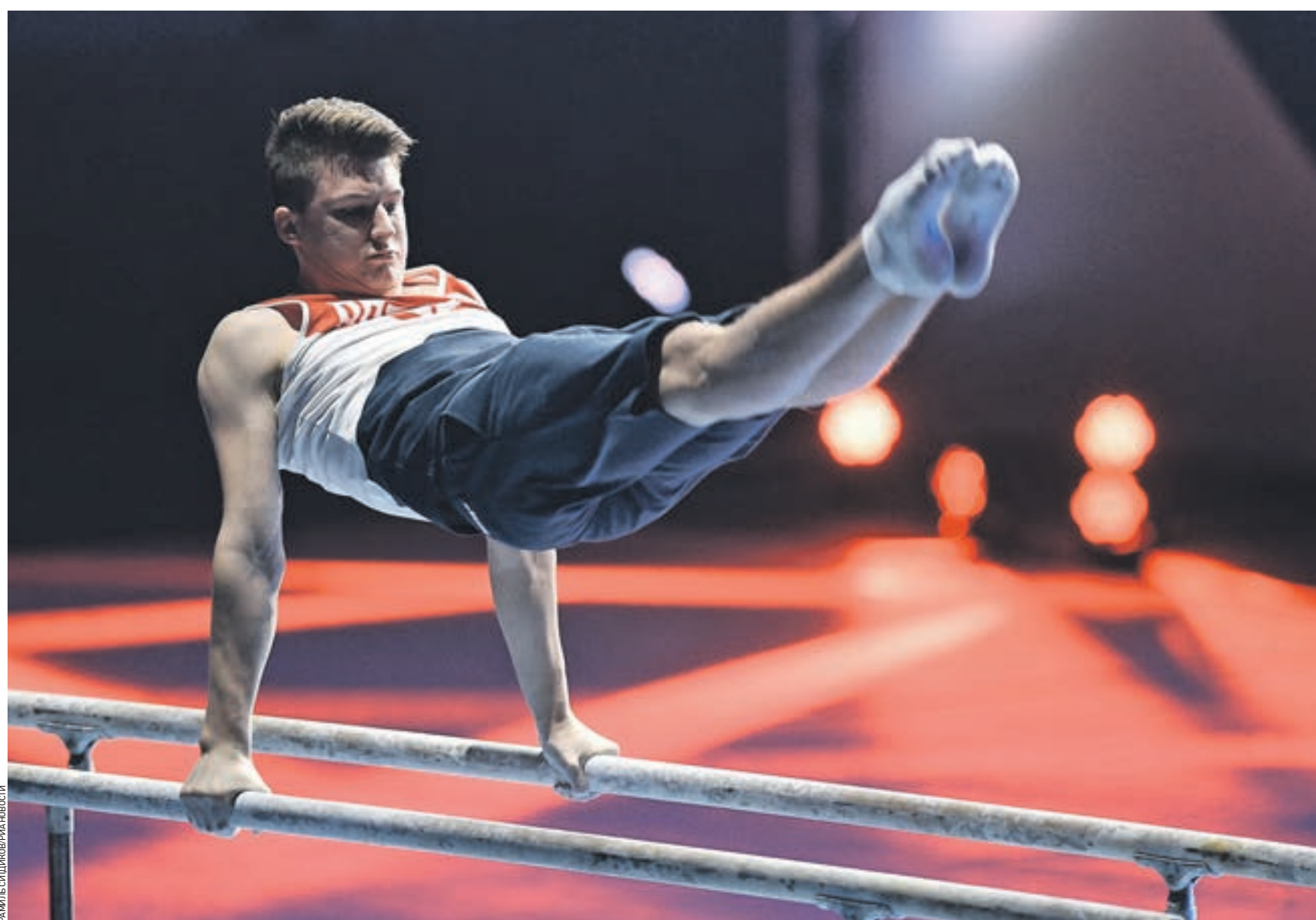
16 сентября 2017 года 20:32 Олимпийский чемпион Алексей Немов выступает на одном из предыдущих спортивных шоу «Алексей Немов и легенды спорта»

по спортивной и художественной гимнастике. Благодаря ледовым шоу полстраны встало на коньки. Гимнастическое шоу может иметь такой же эффект? Собственно, ради этого мы и создавали шоу «Легенды спорта». Наша главная цель — популяризация спортивной и художественной гимнастики, да и здорового образа жизни в целом. Надеюсь, что, увидев это шоу, многие мальчишки и девчонки захотят записаться в спортивные секции. Я за то, чтобы как можно больше детей занимались гимнастикой, поскольку она закладывает базу владения собственным телом — это тоже очень важно в жизни. А для тех ребят, кто уже занимается спортом, это шоу станет стимулом продолжать упорные тренировки, которые рано или поздно приведут их к заветной победе.