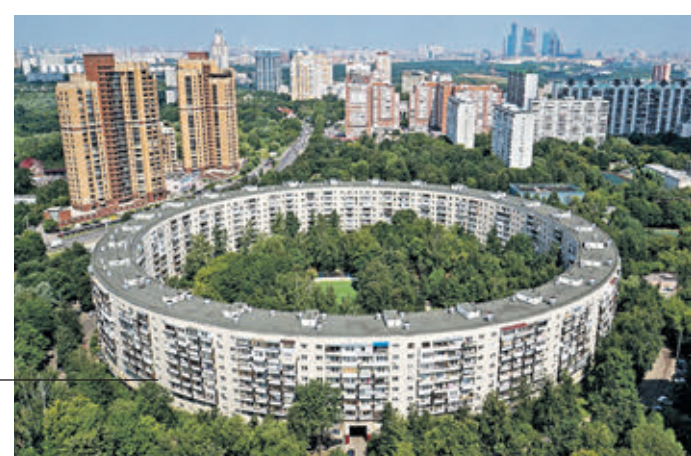
ДОМ-КОРАБЛЬ Ул. Б. Тульская, 2 Этажность: 14 Год постройки: 1981

Один из самых больших домов Москвы за Садовым кольцом — 14 этажей. Уникален своим оригинальным проектом в стиле брутализм. Я слышал много его других названий: Титаник, Дом атомщиков и т.д. Несмотря на огромную протяженность фасада (более 400 метров), дом обладает высокой сейсмической устойчивостью, его углы не в 90 градусов, а 87, чтобы здание «не сползло».