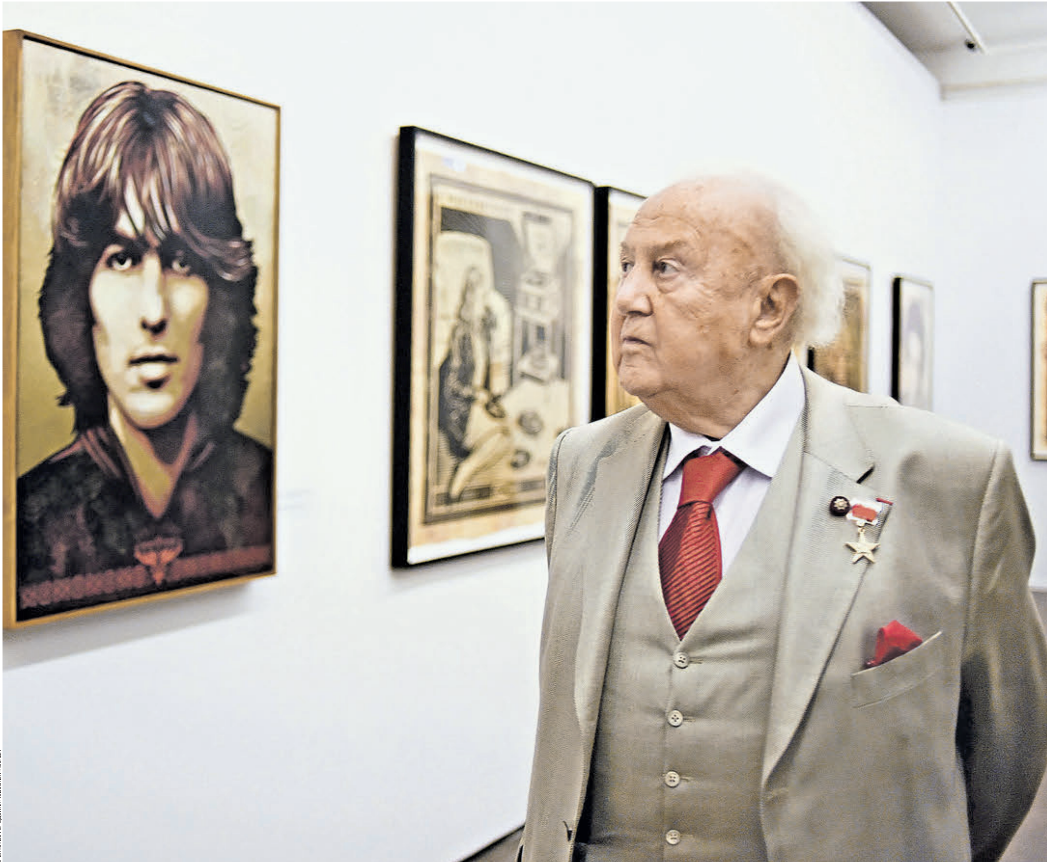
АГЕНТСТВО ПРОДЮСИНГОВЫХ УСЛУГ