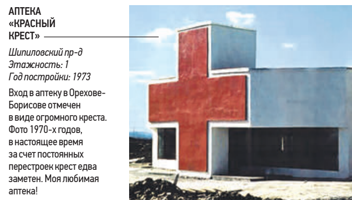
АПТЕКА «КРАСНЫЙ КРЕСТ» Шилловский пр-д Этажность: 1 Год постройки: 1973

Экспериментальный дом нового быта в Черемушках. Проектировался в соответствии с пожеланиями будущих жильцов — молодых семей и холостых, одиноких специалистов.