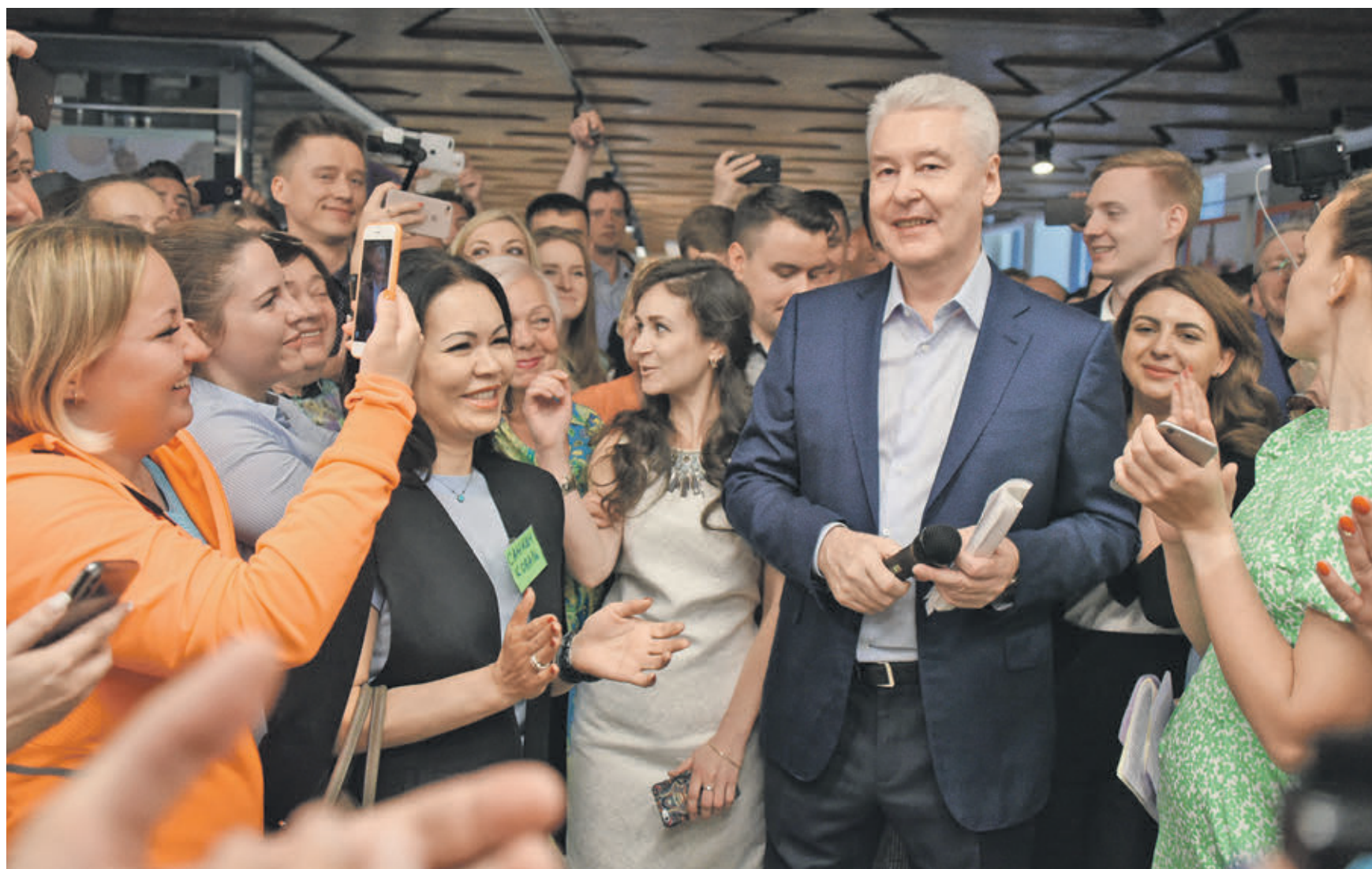
16 июня 2018 года 15:08 Мэр Москвы Сергей Собянин в предвыборном штабе фотографируется с командой волонтеров. Они в ходе предвыборной кампании собирали наказы горожан. На инаугурации Сергей Собянин пообещал реализовать все полученные пожелания москвичей. Для этого понадобились кадровые перестановки в правительстве столицы

Назначены заместители мэра Москвы. Управленцы займутся воплощением в жизнь наказов горожан