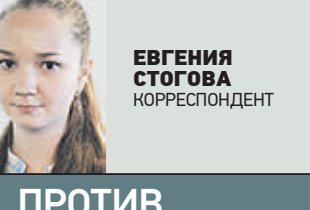
ЕВГЕНИЯ СТОГОВА КОРРЕСПОНДЕНТ

К омитет Госдумы по безопасности и противодействию коррупции не принял законопроект о декриминализации ряда статей за публикации в интернете. А некоторые депутаты и вовсе заявили, что наказывать за репосты «полезно». Отлично. Вчера нас наказывали за неудобные посты, сегодня — за репосты, то есть даже не за собственные слова! А завтра что? За в сердцах брошенные фразы? За показавшиеся кому-то неправильными мысли? Давно ли комитет по безопасности превратился в полицию мыслей из Джорджа Оруэлла? Интернет с самого начала воспринимался обществом как место максимальной демократии и свободы слова, единственная платформа, где можно быть собой, не боясь критики со стороны. Постепенно социальные сети, захватившие в считанные годы миллиардную аудиторию, оказались под контролем мнений и стереотипов. Те, кто переживает за свою карьеру, усиленно постят популистские публикации о своих профессиональных достижениях. Строящие личную жизнь старательно поддерживают имидж красоток, хозяек и мастериц на все руки. Студенты соревнуются за звание самого успешного автора мемов, модели делятся страданиями по поводу диеты, а пиар-менеджеры делают из себя ходячую рекламу заплатившей им компании.