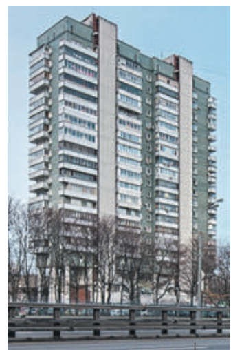
ДОМ «ЛИБЕДЬ» Ленинградское ш., 29–35 Этажность: 16 Год постройки: 1967–1973

Вчера москвичи и историк Александр Васнин прогулялся с «ВМ» по спальным районам и специально для читателей газеты составил рейтинг необычных и интересных зданий, расположенных на окраинах столицы.