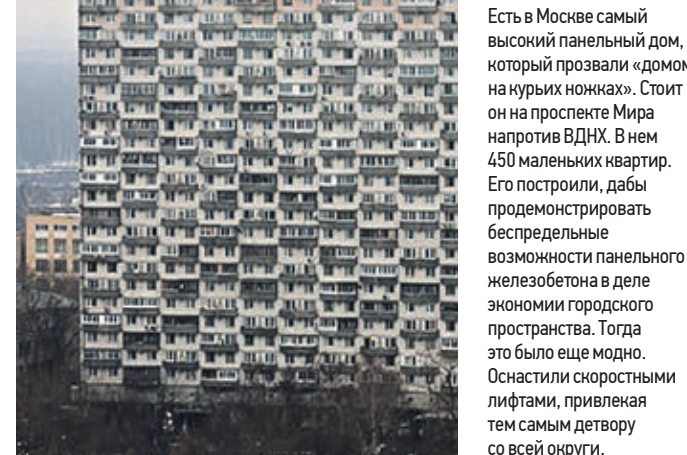
ДОМ НА КУРЬИХ НОЖКАХ Пр-т Мира, 184, корп. 2 Этажность: 25 Год постройки: 1968

Вход в аптеку в Орехово-Борисове отмечен в виде огромного креста. Фото 1970-х годов, в настоящее время за счет постоянных перестроек крест едва заметен. Моя любимая аптека!