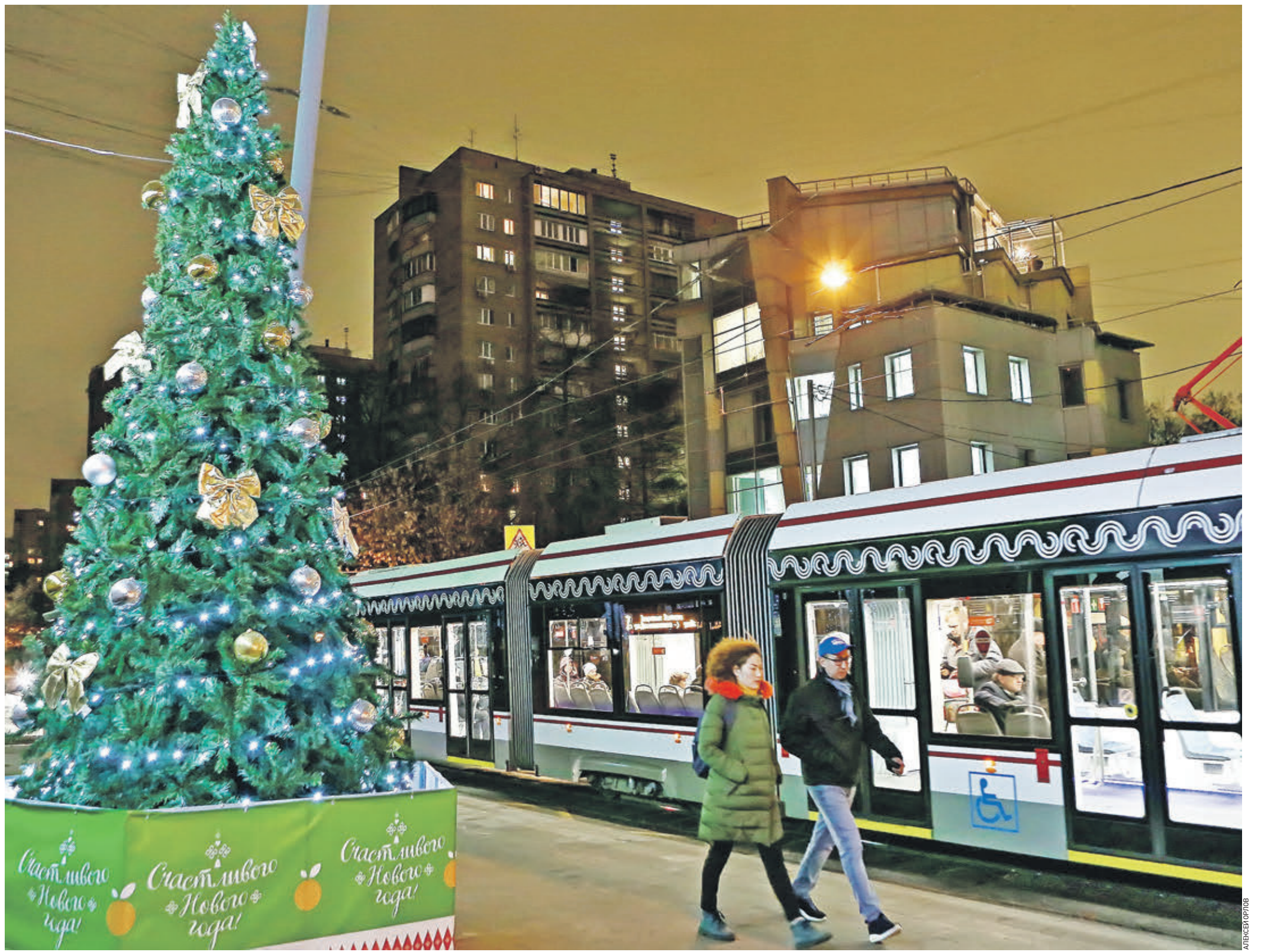
Вчера 18:15 «Новогодний проспект» — объявили по громкой связи, и трамвай направился в сторону станции метро «Проспект Мира». Может, показалось? Но трамвай подъехал к остановке, а там... зимняя сказка: в свете гирлянд кружат снежинки, падая на ветки нарядной елки