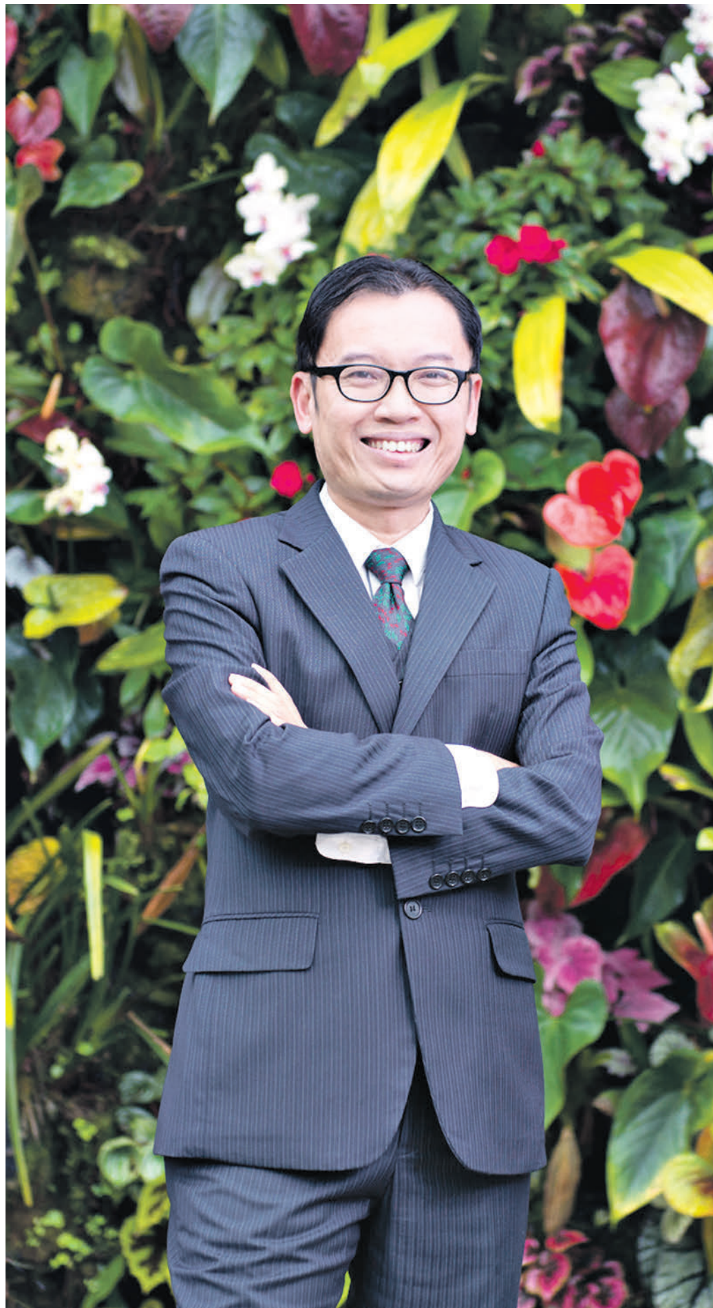
5 июля 2019 года 13:10 Директор всемирно известного сингапурского парка «Сады у Залива» Феликс Ло позирует для фотографа на фоне цветочной композиции тропических растений

Как вы следите за безопасностью? Мы делаем все возможное, чтобы обеспечить безопасную среду. Все растения, кустики — до них можно дотронуться рукой. Кто-то действительно считает, что выразить свое восхищение можно, сорвав растение. Но отмечу, что у нас в Сингапуре очень строгие законы против вандализма, поэтому такие случаи происходят редко. Безусловно, мы серьезно относимся к безопасности посетителей. У нас есть охрана, территорию патрулирует полиция, а во время мероприятий