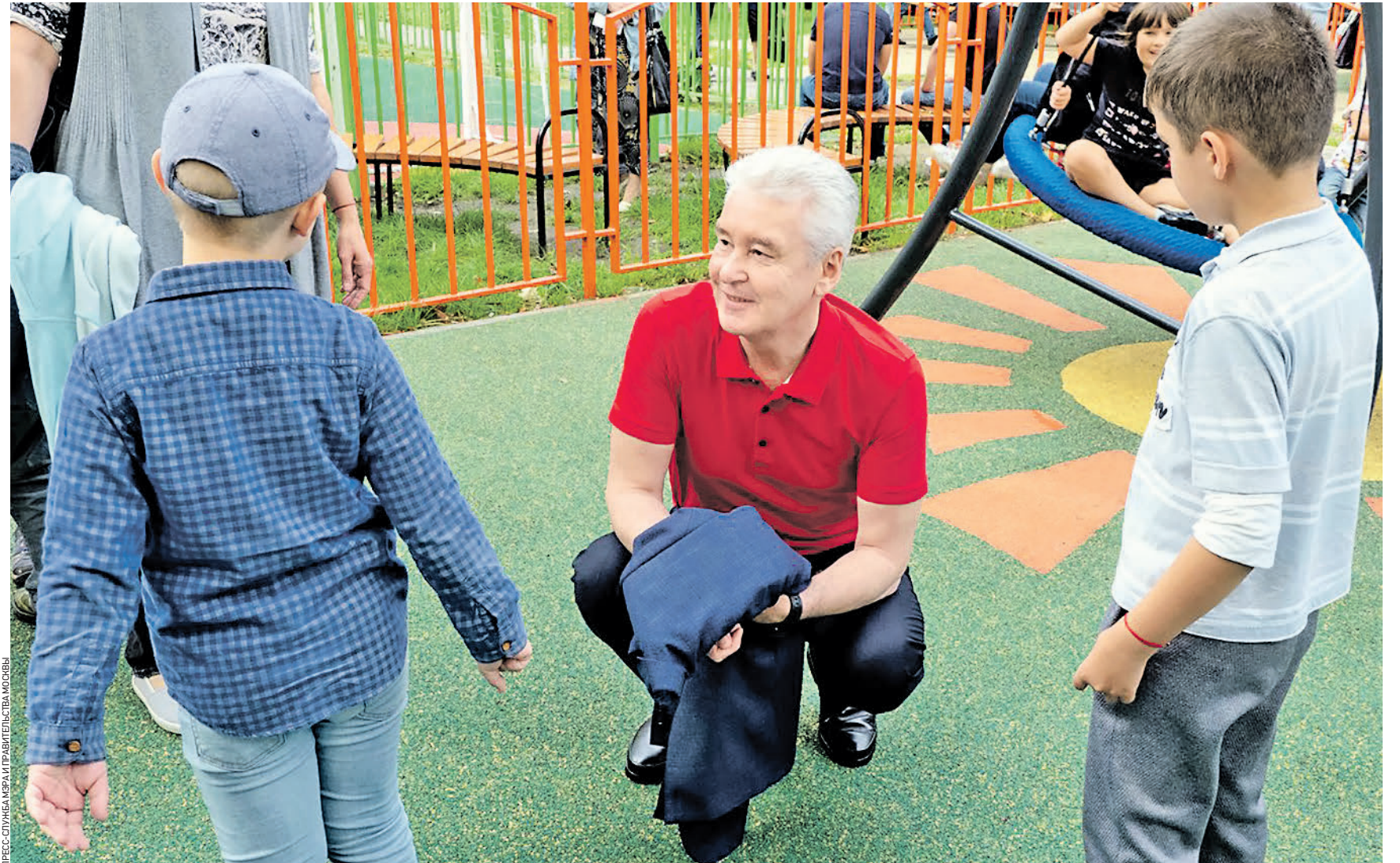
19 августа 14:42 Мэр Москвы Сергей Собянин общается с детьми на игровой площадке, реконструкция которой провели в рамках благоустройства Школьной улицы. Сегодня при обновлении городских пространств в столице применяют комплексный подход...