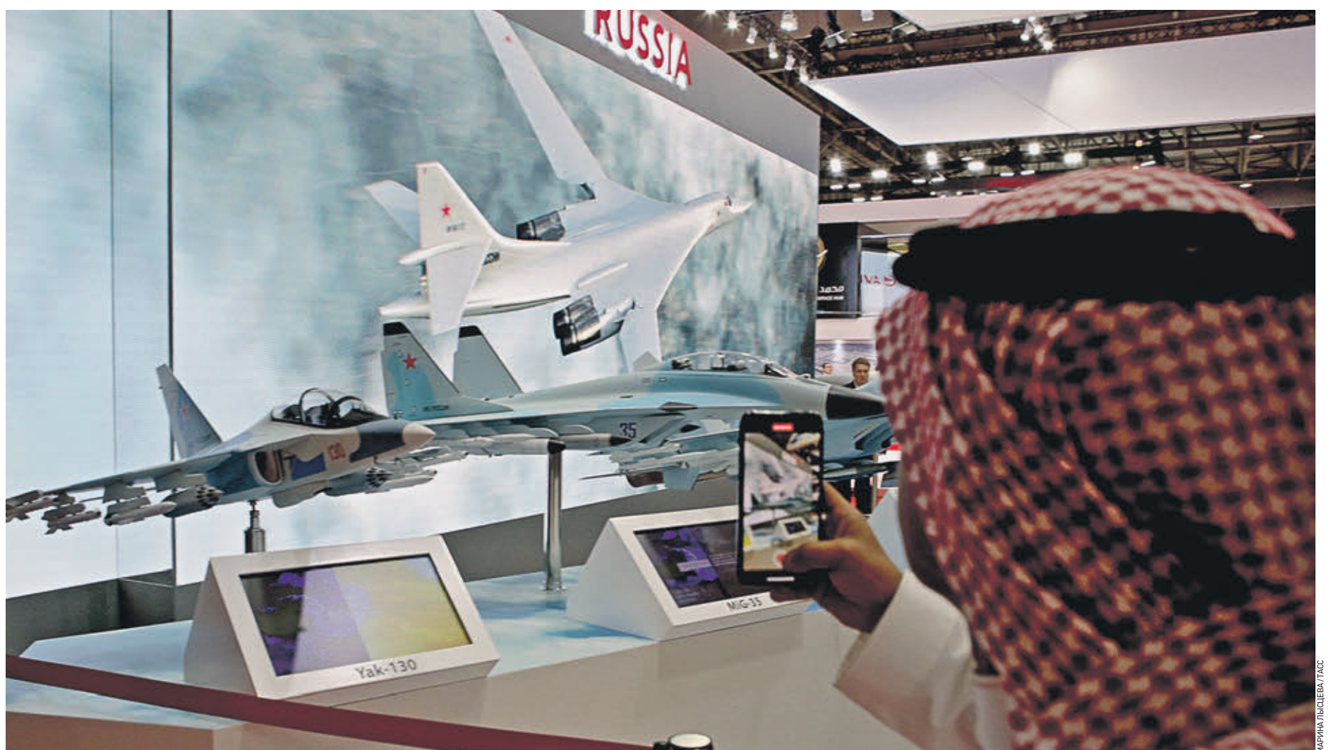
17 ноября 2019 года. Объединенные Арабские Эмираты, Дубай. Стенд российской Объединенной авиастроительной корпорации на Международной авиационно-космической выставке Dubai Airshow. Сейчас Россия прежде всего экспортирует вооружение

США давно нас обогнали в гонке вооружений. Сравните оснащение их армии с нашей и бюджета, которые они тратят на это. Все станет понятно.