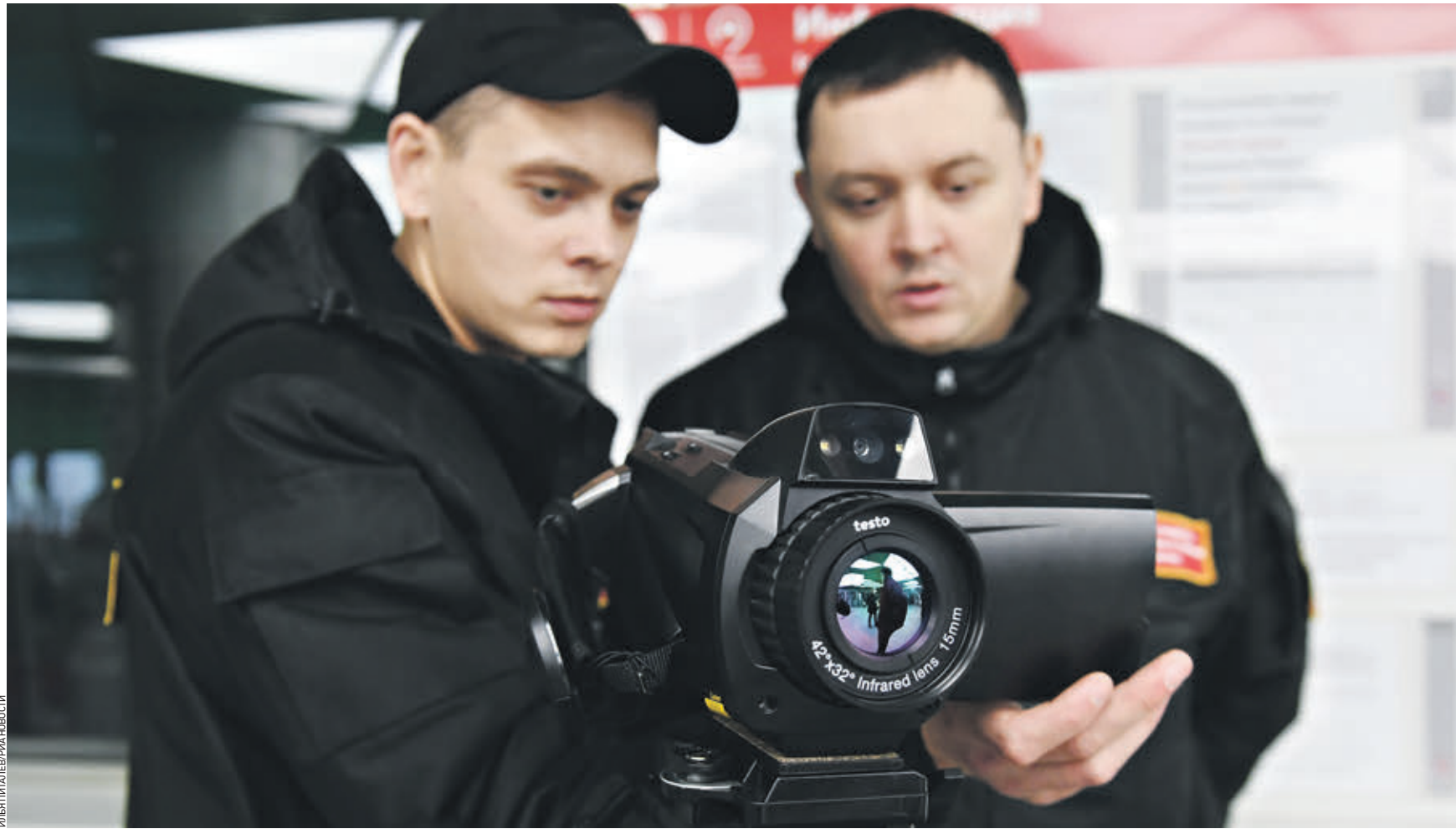
16 марта 13:23 Сотрудники метрополитена проверяют у пассажиров московского метро температуру с помощью тепловизора. В связи с коронавирусом в метро усилены меры санитарной безопасности

Новая коронавирусная инфекция COVID-19 наиболее опасна для людей старшего возраста. Такого мнения придерживается академик Российской академии наук, профессор Александр Чучалин. По его словам, в основную группу риска по заболеваемости входят люди старше 65 лет, особенно если у них есть сопутствующие хронические заболевания. — Дело в том, что с возрастом иммунная система человека ослабевает и становится более восприимчива к инфекциям, — пояснил Чучалин. — Поэтому все вирусные инфекции крайне опасны для пожилых людей. Профессор отметил, что хронические заболевания могут быть причиной развития осложнений. Особую опасность коронавирус представляет для тех, у кого имеются болезни сердца и легких. Еще одна группа риска — больные со злокачественными новообразованиями. Онкозаболевания наносят большой удар иммунной системе, за счет чего организм просто теряет свои защитные свойства и перестает сопротивляться.