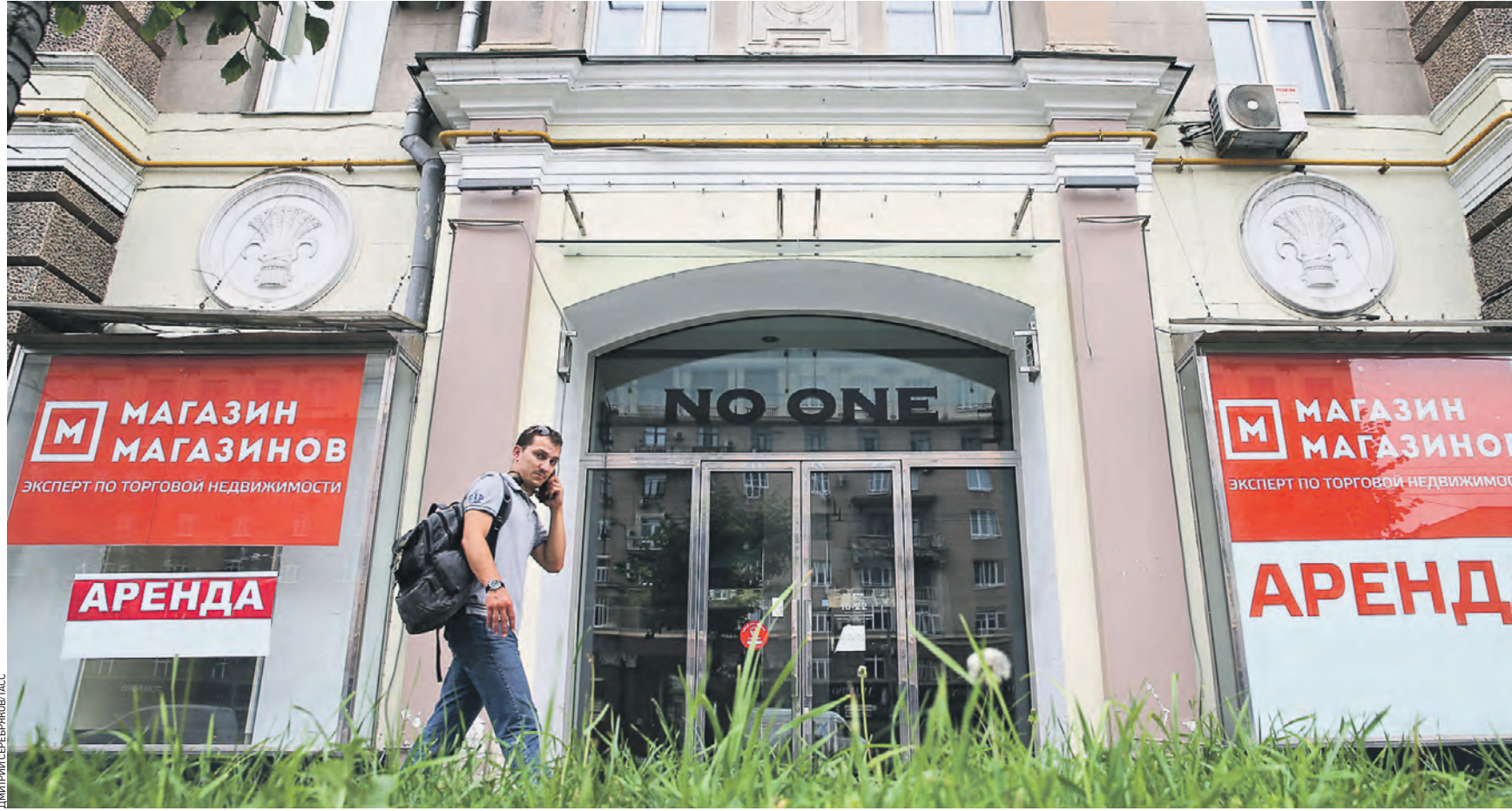
3 августа 2020 года. Аренда торговых площадей на Кутузовском проспекте. Из-за пандемии коммерческие площади в популярных местах Москвы меняют арендаторов