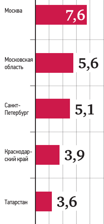
По данным autostat.ru

Количество автокредитов на рекордный апрель 2021 г., ТЫСЯЧ