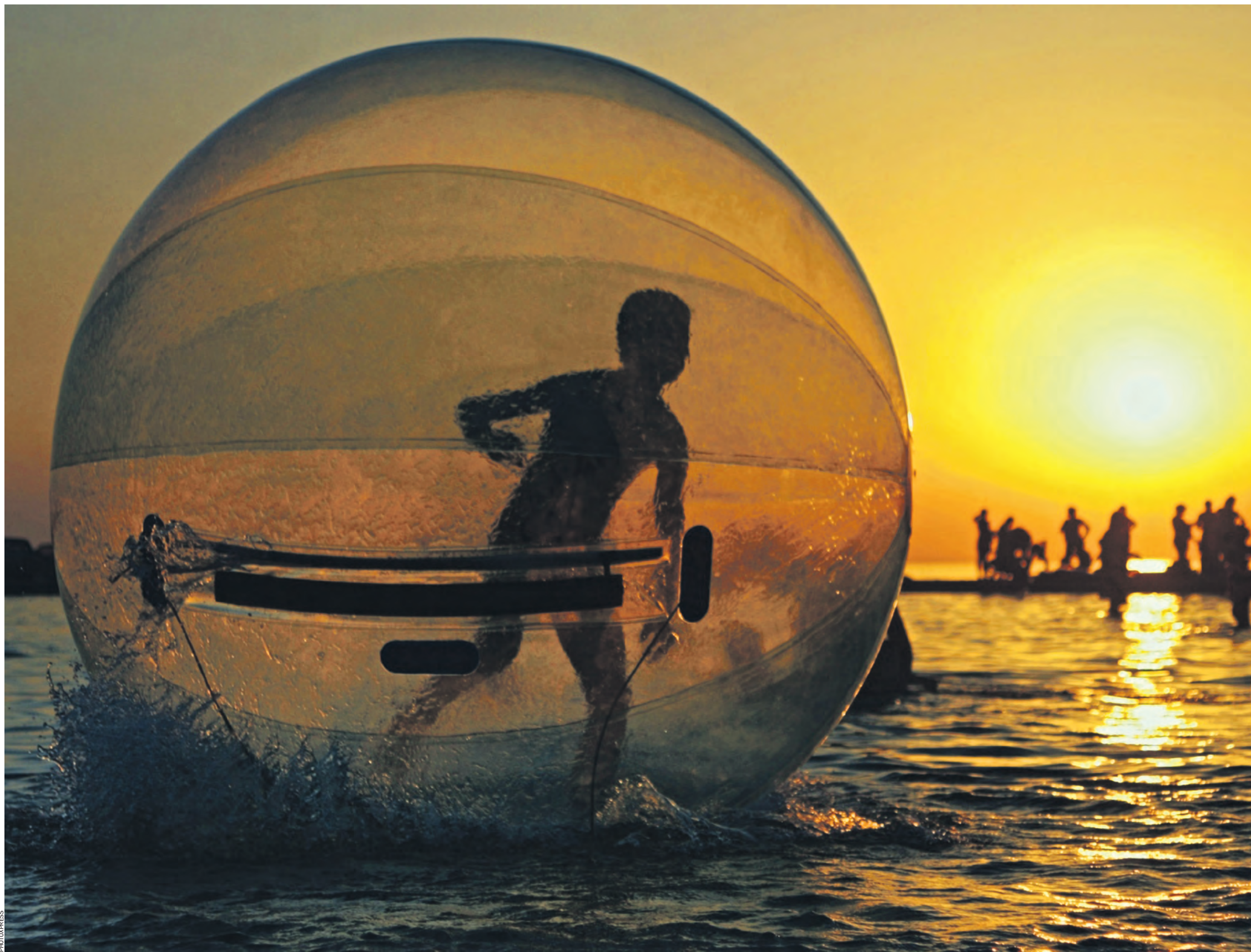
13 июля 2019 года. Отдыхающий занимается зорбингом на водах Азовского моря. Судя по наплыву отдыхающих со всей страны, местное побережье скоро поспорит с Анталей за звание туристической Мекки

На Азовском побережье Кубани можно отдохнуть на любой вкус и кошелек