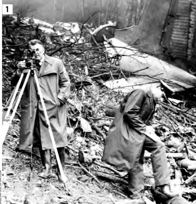
20 октября 1964 года, гора Авала. Следственная группа работает на месте катастрофы Ил-18 под Белградом (1) Камень с горы Авала недалеко от Белграда (2)

— Тут советский самолет разбился в 1964 году. Мы память о летчиках чтим. В Белграде знают, что такое горе... Вот тогда-то все и встало на место. Это место гибели Ил-18! Катастрофа, унесшая жизни людей в октябре 1964 года, не очень афишировалась в СССР. И хотя маршал Бирюзов похоронен в Кремлевской стене, а остальные члены делегации — на Новодевичьем кладбище, сегодня о трагедии вспоминают не часто. А сер-