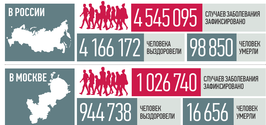
По данным стопкоронавирус.рф на 11:00 31 марта