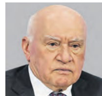
ЛЕО БОКЕРИЯ главный внештатный специалист, сердечно-сосудистый хирург, министр здравоохранения России

Уже много лет в рамках всероссийского форума «Здоровье нации — основа процветания России» мы проводим выставку, которая называется «Здоровье для всех». Собственно говоря, и другие наши проекты, такие как «Прикоснись к сердцу ребенка», «Волна здоровья», которым уже больше 15 лет, были созданы для того чтобы люди, и в первую очередь дети, в разных уголках нашей необъятной страны могли получить адекватную помощь специалистов из лучших федеральных медицинских центров. Акцией «10 тысяч шагов к жизни» мы хотим еще раз подчеркнуть, что инфраструктура — объекты, необходимые для поддержания здорового образа жизни, — должна быть доступна всем. Задача государства — дать гражданам выбор, а задача гражданина, в свою очередь, выбором воспользоваться, отнестись к нему ответственно. На сегодняшний день для большинства жителей нашей страны самая доступная и самая эффективная, с точки зрения профилактики заболеваний, физическая активность — это ходьба. Об этом говорит множество серьезных, в том числе зоокеанских, исследований. Одно из самых ярких приводит следующие данные: человек, который активно двигается хотя бы два часа в неделю, живет на шесть-восемь лет дольше того, кто ведет сидячий образ жизни. В прошлом году мы начали работу по популяризации ходьбы: создание маршрутов в муниципалитетах, формирование единого реестра, обучение инструкторов. И акция «10 тысяч шагов к жизни» стала важной частью этого проекта.