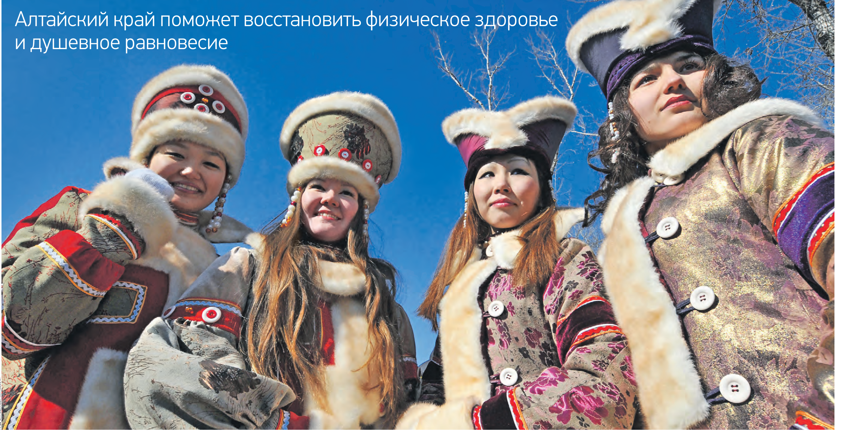
19 марта 2011 года. Гости из Алтайского края в народном одеянии, представляющие родной регион в Абакане, на хакасском обрядовом празднике Чыл Пызы. Праздник этот привязывают к дню весеннего равноденствия. Хакасская культура схожа с алтайской. В крае тоже есть похожий праздник — его называют Дылгайак. Он символизирует наступление весны. В эти дни принято совершать обряды для очищения души, провожать зиму и встречать весну гуляниями с ярмарками, песнопениями и аттракционами

Алтайский край поможет восстановить физическое здоровье и душевное равновесие