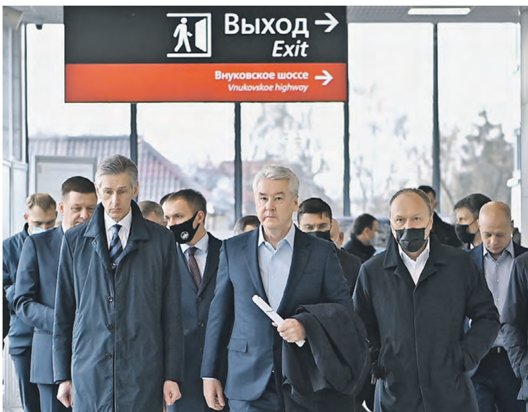
Вчера 10:08 Слева направо: заместитель гендиректора «РЖД» Олег Тони, мэр Москвы Сергей Собянин и заммэра Москвы по вопросам градостроительной политики и строительства Андрей Бочкарев на открытии станции «Внуково»

спорта рядом со станцией организуют разворотное кольцо. Появятся дополнительные наземные пешеходные переходы и светофоры, площадки для парковки и проката велосипедов, стоянка такси, перехватывающие парковки на 805 машино-мест и многоуровневый гараж. — Теперь доехать от «Внуково» до Киевского вокзала можно всего за 35 минут, что сопоставимо с временем поездки на машине. Мы понимаем, что площадь остановочного пункта 4 тысячи квадратных метров рассчитана на перспективу. И мы считаем, что в 2025 году где-то пять с половиной тысяч человек в сутки будут пользоваться этой инфраструктурой, — рассказал Олег Тони, заместитель генерального директора ОАО «Российские железные дороги». Ежедневно станцией «Внуково» пользуются почти две тысячи пассажиров. С учетом интенсивного жилищного строительства в этом районе к 2025 году пассажиропоток