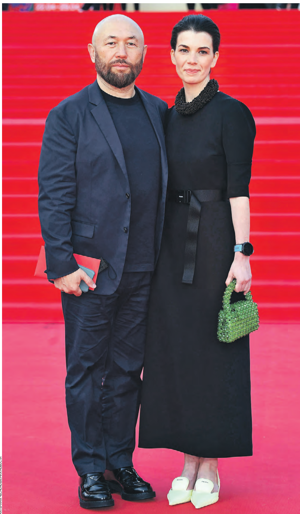
Вчера 18:45 Известный режиссер Тимур Бекмамбетов с супругой Наталией Фишман-Бекмамбетовой на красной дорожке ММКФ. Фильм Бекмамбетова «Девятаев», посвященный судьбе легендарного летчика, Героя Советского Союза, открыл фестиваль