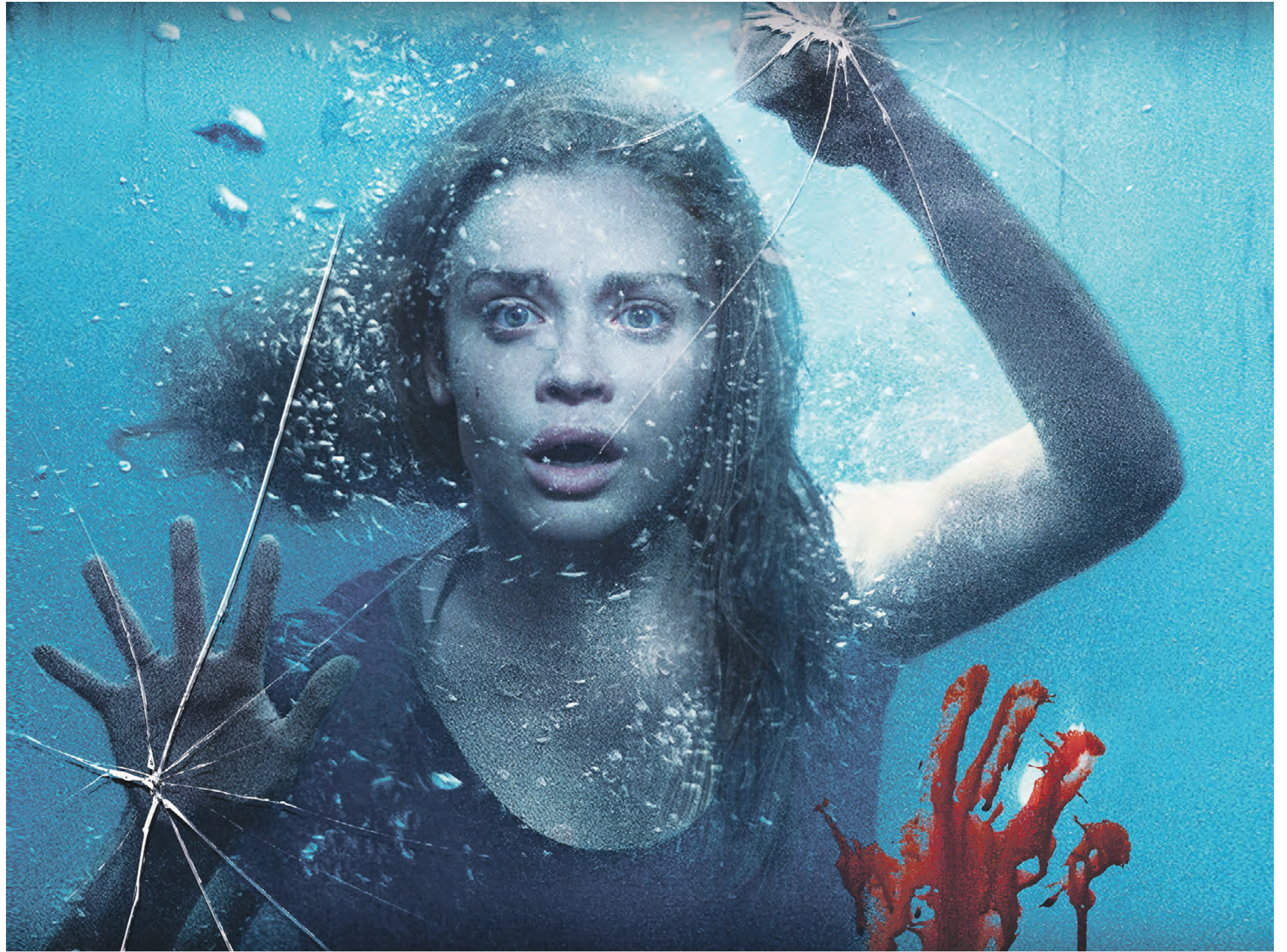
Постер фильма «Клаустрофобия: Квест в Москве» (2020 год). Порой страхи, фобии и тревоги превращаются для нас в непреодолимую преграду, но это нам лишь кажется — сломать ее под силу каждому

— Мегаполисы отличаются от периферийных городков еще и тем, что «перепады высот» от благополучия к провалу тут воспринимаются гораздо болезненнее. Скажем, человек развивает бизнес, берет под него дополнительное финансирование, и тут — кризис, пандемия, еще что-то. У человека не просто падает уровень дохода, когда он, скажем, переходит на потребление более дешевых продуктов и меняет Мальдивы на отдых в Геленджике. Человек может уйти в минус, который заставит распродать недвижимость и предпринимать другие кардинальные меры. У меня в этом году был клиент в коучинге, у которого был огромный бизнес. Почти в одночасье он разорился так, что был вынужден распродать буквально все, оставшись ни с чем. Разумеется, такие ситуации возможны и в других регионах. Но там разорение воспринимается во многом не так остро. Человек оглядывается вокруг и видит, что большинство людей живут скромно и вполне счастливы при небольших доходах. В Москве концентрация успешных людей больше, и оказываясь на их фоне неудачником гораздо страшнее. Неудивительно, что страх потери преследует многих жителей мегаполисов.