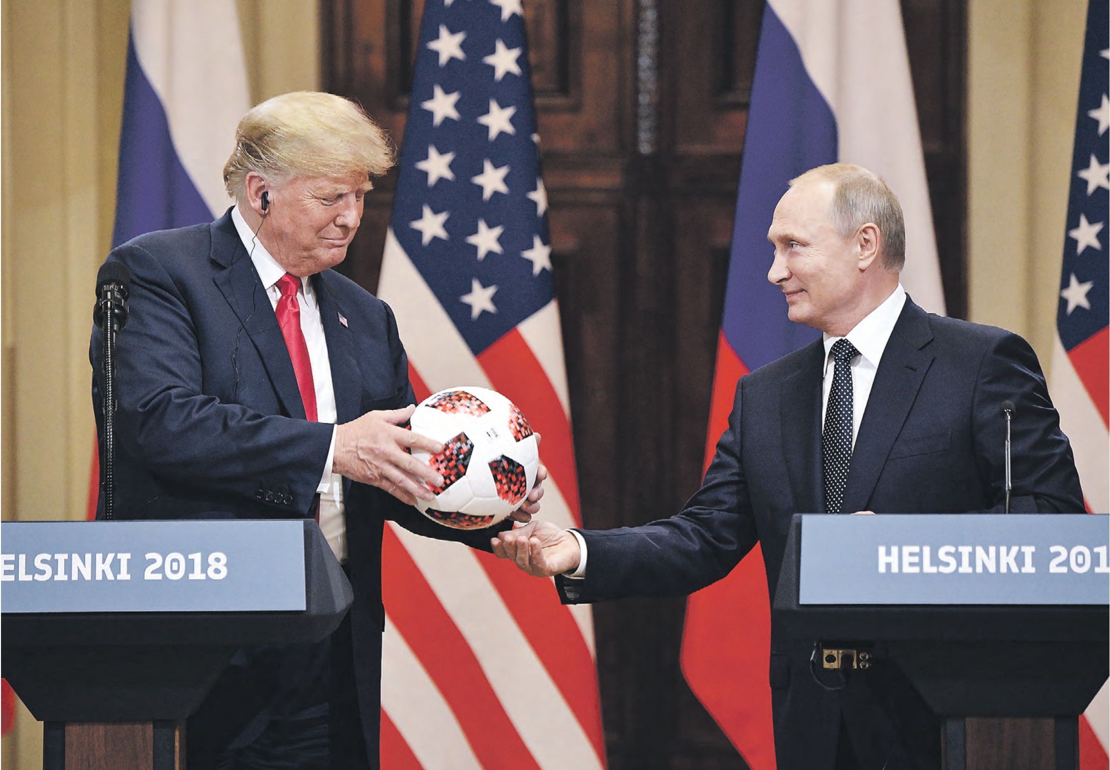
16 июля 2018 года. Президент США Дональд Трамп принимает в подарок от президента России Владимира Путина футбольный мяч на совместной пресс-конференции в Хельсинки

После утвердительного ответа на вопрос журналиста, считает ли господин Байден президента РФ «убийцей», за нынешним президентом США закрепились репутация лидера, делающего нелицеприятные заявления в адрес своих коллег. Это лишает его возможности установить хорошие личные связи, которые способствовали бы развитию двусторонних отношений между двумя странами. Поскольку многое, если не все, в дипломатии строится на доверии и взаимности, такие заявления сильно обедняют арсенал средств внешнеполитического воздействия США на своих зарубежных партнеров. К сожалению, многие западные политики становятся все менее осторожными в заявлениях. Это тенденция последнего времени. Отчасти