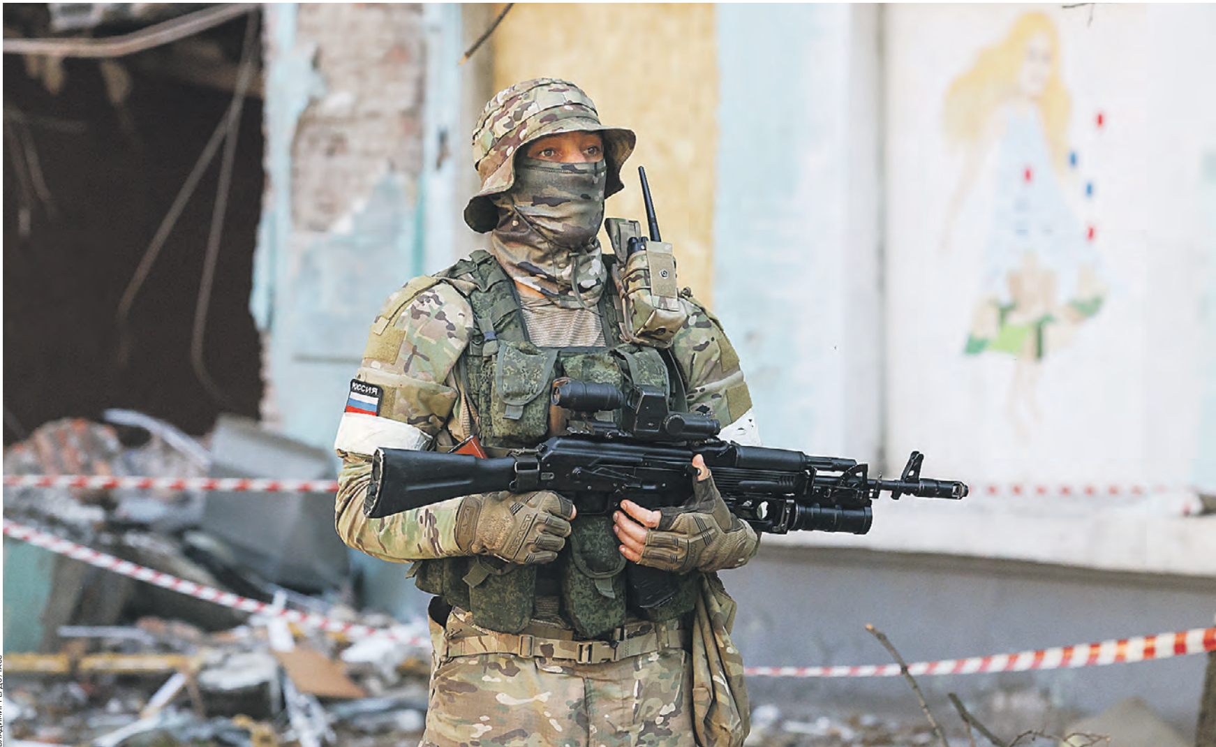
13 июня 2022 года. Российский военнослужащий у школы на Зеленой улице, здание которой пострадало в результате обстрела Вооруженных сил Украины. В ответ на обращение руководителей республик Донбасса с просьбой о помощи ВС РФ проводят спецоперацию на Украине

Несмотря на активные боевые действия, на территориях Донбасса готовятся к началу осенне-зимнего периода. К 15 октября необходимо подготовить тепло- и газоснабжение всех жилых домов.