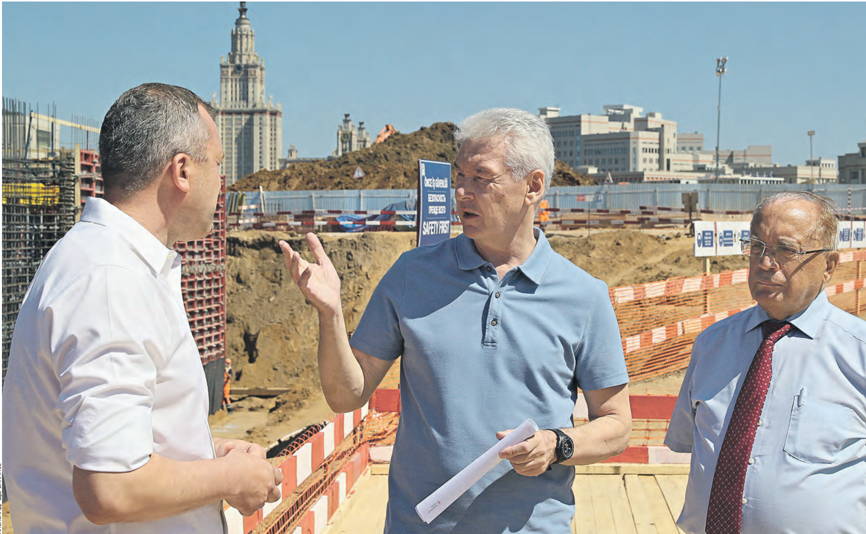
12 июля 2021 года 11:42 Мэр Москвы Сергей Собянин (в центре) и ректор МГУ им. Ломоносова Виктор Садовничий (справа) во время посещения строительства Инновационного научно-технологического центра «Воробьевы горы»

— Но уже сегодня мы получили порядка 200 заявок на размещение. Статус участника проекта присвоено девяти высокотехнологичным компаниям, — поделился мэр. Сами Воробьевы горы тоже переживают сегодня свое вто-