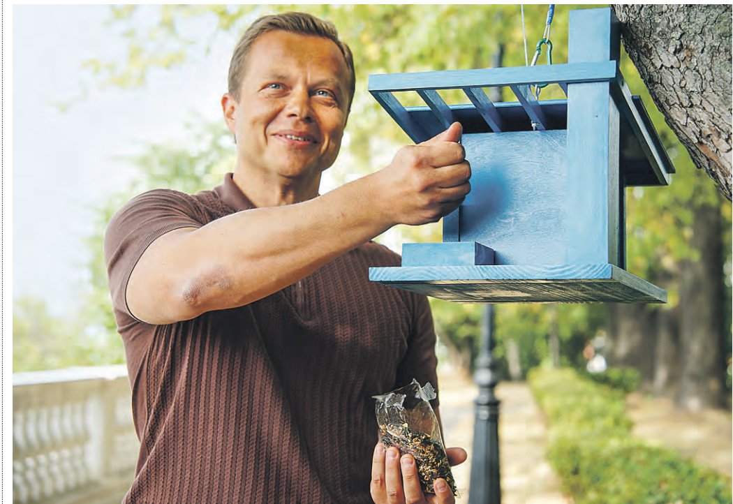
Вчера 12:17 Заммэра Москвы Максим Ликсутов насыпает корм для птиц в скворечник-кормушку, который он только что сам повесил на дерево в парке Северного речного вокзала

Универсальная еда для птиц — семечки, орешки, крупы, свенные плоды и ягоды, несоленое сало, сливочное масло. Но, например, свистели не едят семечки, зато будут рады ягодам и фруктам, рябине. Сороки, галки, вороны — всеядны. Сало подойдет для синиц и дятлов, а просо — для воробьев. Запрещено давать птицам хлеб, пшено, еду «со стола» — солоное, попченое и жареное.