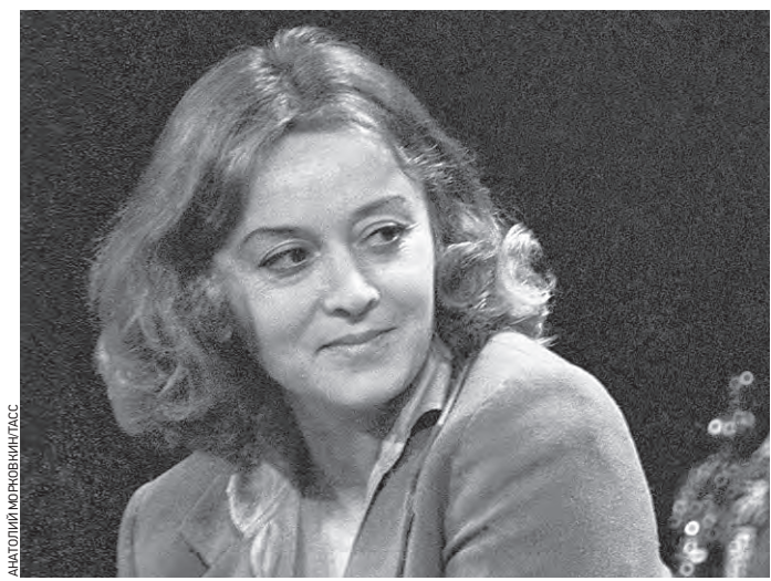
15 марта 1981 года. Народная артистка России Маргарита Терехова играет в спектакле «Тема с вариациями»