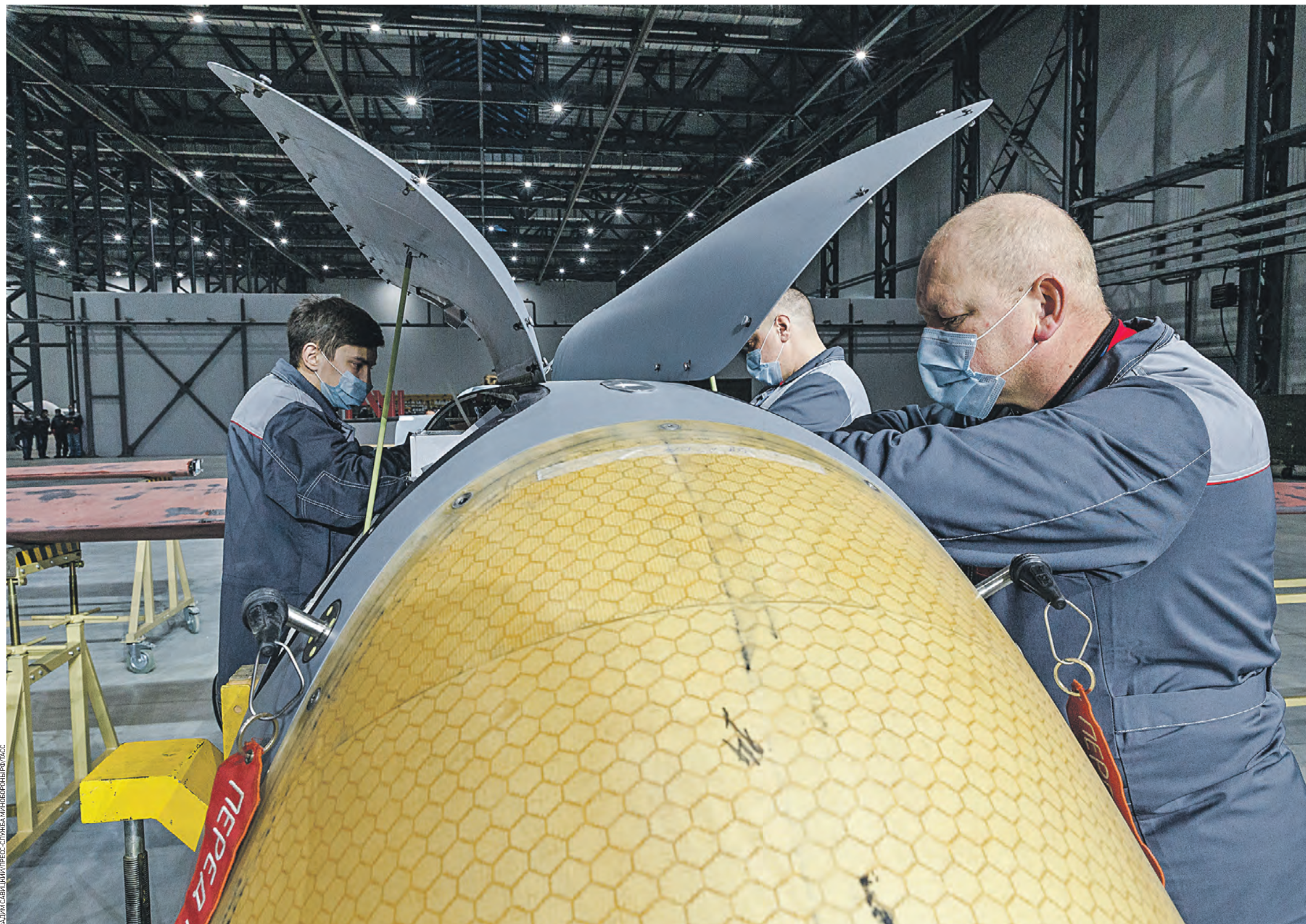
27 января 2022 года. Дубна. Производство разведывательно-ударного беспилотника «Орион» на первом в России специализированном заводе по выпуску крупногабаритных военных беспилотных летательных аппаратов

Экономику страны необходимо подчинить задачам спецоперации