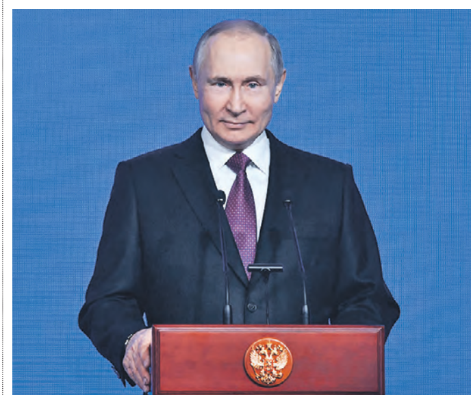
4 ноября 16:14 Президент России Владимир Путин на встрече с историками и религиозными представителями

В День народного единства президент РФ Владимир Путин встретился с историками и представителями традиционных религий России.