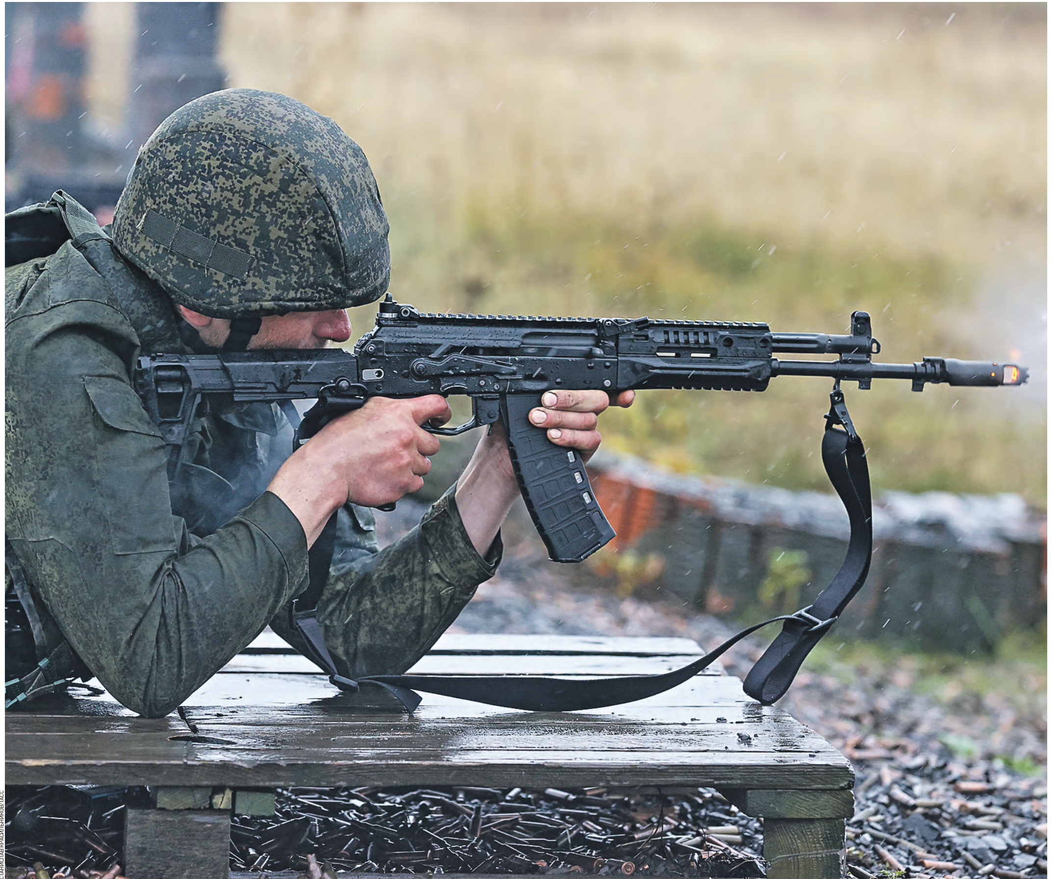
20 октября 2022 года. Военнослужащий, призванный в рамках частичной мобилизации, практикуется в стрельбе из автомата Калашникова

— Например, автомат АК-12, который мы выпускали до начала спецоперации, и тот, который сейчас с конвейера, несколько отличаются как конструктивно, так и по ряду боевых характеристик, — сообщил Алан Валерьевич. — АК-12 калибра 5,45 миллиметра изначально был лучшим в своем классе, он обладает повышенной точностью и кучностью стрельбы. У него отличная эргономика, на автомате несколько планок Пикатини для установки дополнительного оборудования. Но практика показала, что есть резервы для совершенствования. Доработки идут постоянно, наши