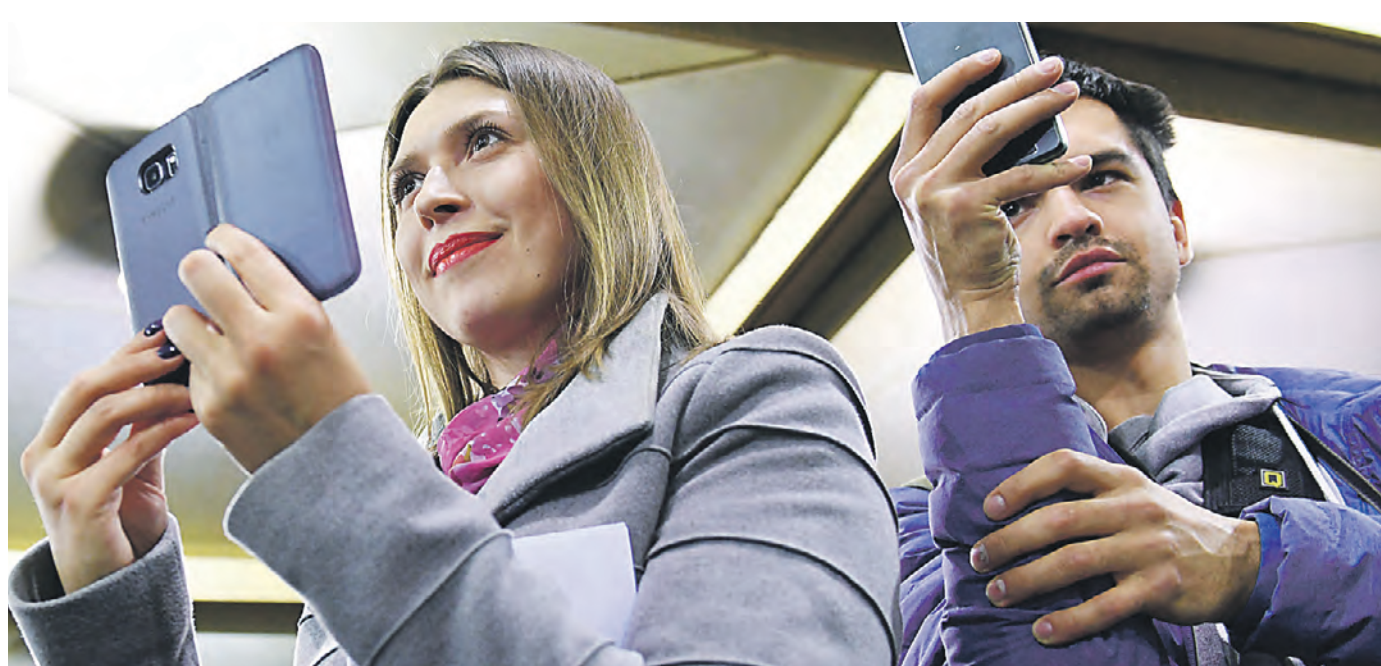
02 декабря 2022 года. Теперь во время поездки в столичном метро можно окунуться в мир литературных произведений.

— Мы хотим, чтобы наши пассажиры проводили время в дороге интересно и с пользой.