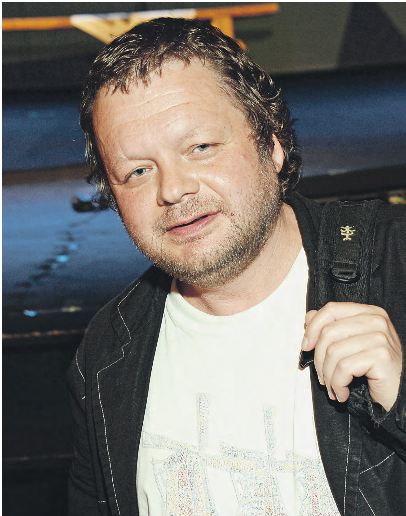
2015 год. Поэт и музыкант Вадим Степанцов на церемонии Всероссийской литературной премии «Филатов-фест» в театре «Содружество»

Потому что и в самом Киеве внутренне осознавали, что это не их регион. Там нет и никогда не было Украины. Можно что угодно говорить, но