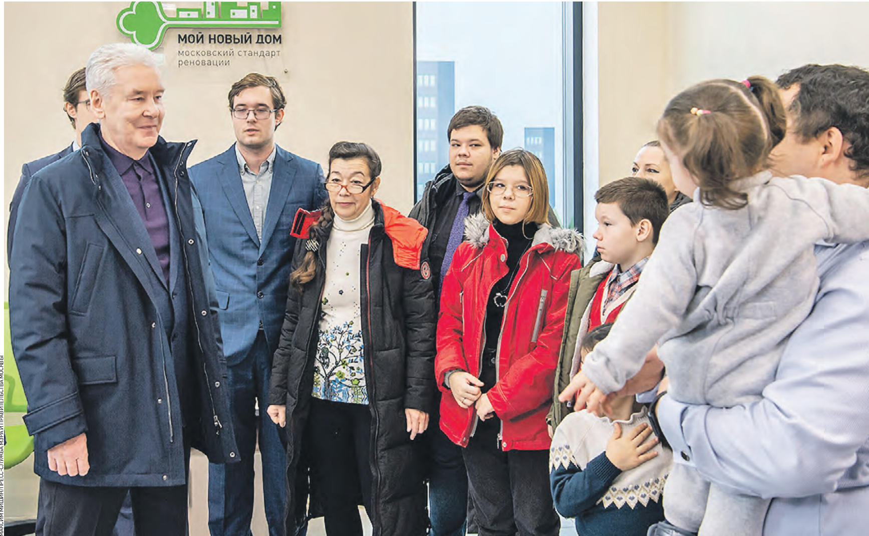
29 ноября 2022 года. Мэр Москвы Сергей Собянин (крайний слева) пообщался с жителями Таганского района, которые переезжают в первый дом, заселяемый по программе реновации. Просторные квартиры с улучшенной отделкой получили 265 семей

Программа реновации стартовала чуть больше пяти лет назад. С тех пор в Москве сдали три миллиона квадратных метров жилья. Почти 82 тысячи москвичей уже переехали в новые квартиры. — Переехали в своем же районе, в благоустроенные квартиры с отделкой, — подчеркнул Сергей Собянин. — Рядом все знакомо: школы, детские сады, поликлиники и парки. Участниками программы реновации, напомнил мэр, стали около миллиона москвичей. Для всех, кто ждет квартиры, сейчас в городе строят или проектируют 393 дома общей площадью 7,2 миллиона квадратных метров. И вот теперь в программу включили еще шесть стартовых площадок. Они находятся в районах Восточное Измайлово, Басманный, Даниловский, Нижегородский, а также в поселении Первомайское. Всего по новым адресам смогут построить 134,1 тысячи квадратных метров жилья. — В новостройки переедут жильцы 27 старых пятиэтажек, — уточнил Собянин. Комфортное жилье получат 4,9 тысячи человек.