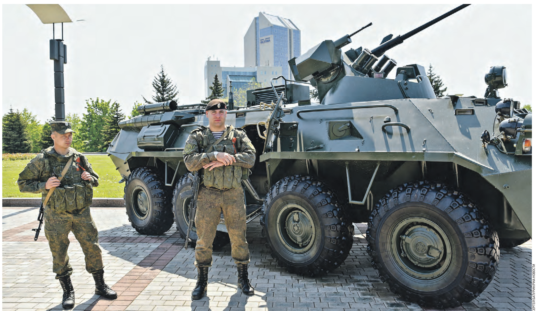
9 мая 2022 года. Донецк. Военнослужащие возле БТР-82 на выставке трофейной военной техники в парке Ленинского Комсомола