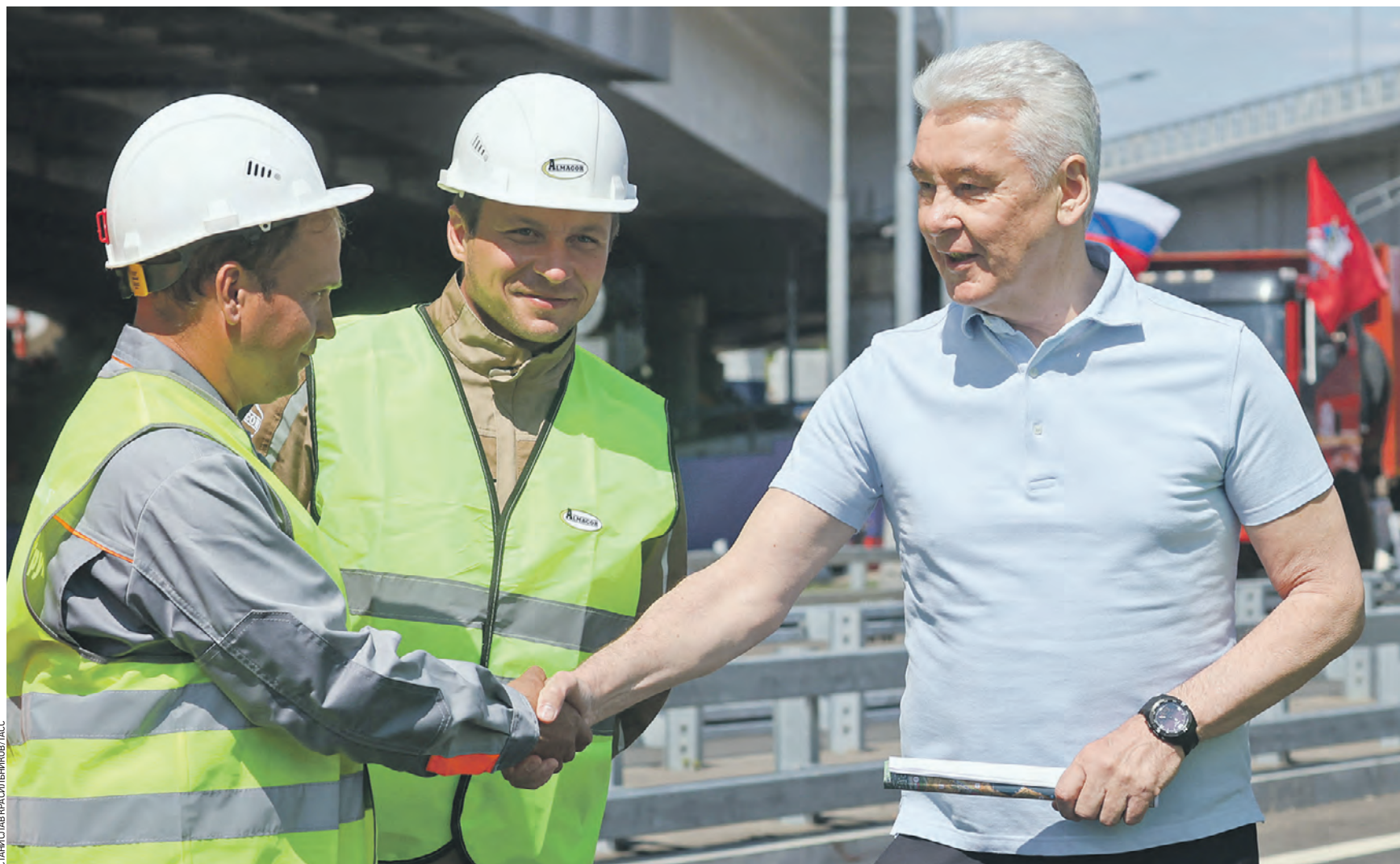
Вчера 11:29 Мэр Москвы Сергей Собянин (крайний справа) поблагодарил строителей за высокий профессионализм и качественную работу. Благодаря их навыкам и труду в городе реализуется один из сложнейших дорожно-транспортных проектов: буквально по воздуху проходит южное направление скоростного диаметра

Так, сразу два участка южного направления МСД сдали на полгода раньше запланированного срока. Шестиполосная трасса начинается у пересечения Шоссеинского проезда и Шоссеинской улицы и далее идет вдоль путей МЦД-2 по территории Печатников до микрорайона Курьяново. Протяженность дороги по прямой, без учета съездов на прилегающие улицы, составляет почти 6,5 километра. В составе новой трассы по-