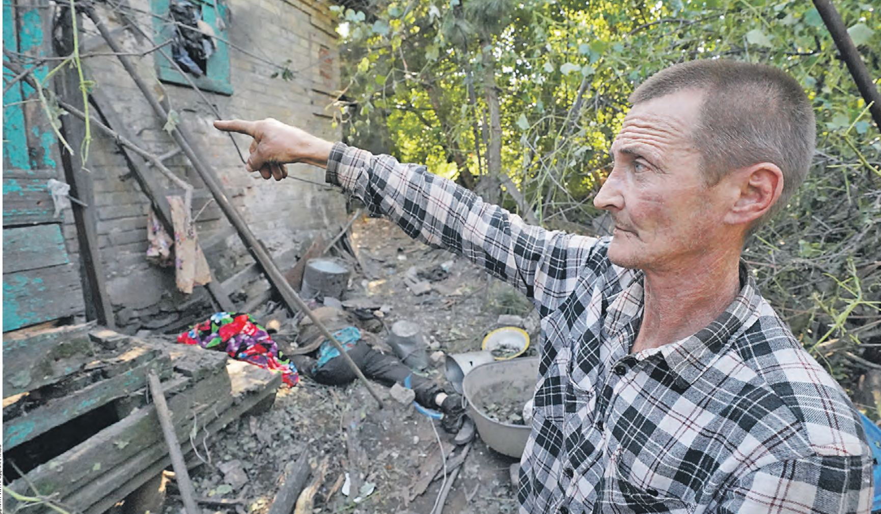
20 июня 2023 года. Житель Горловки, Донецкая Народная Республика, на территории жилого дома, поврежденного украинскими обстрелами. Вчера ВСУ вновь нанесли удары по Горловке, выпустив 10 ракет из РСЗО, сообщили в Совместном центре контроля и координации вопросов, связанных с военными преступлениями Украины