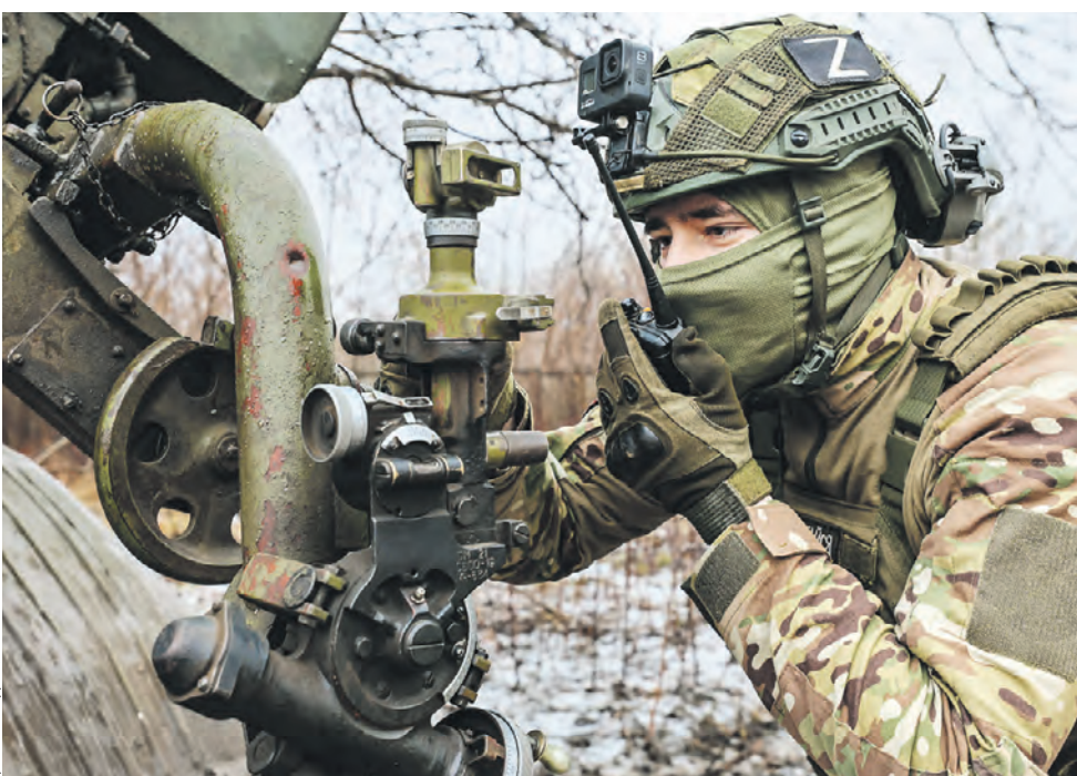
19 декабря. Боевая работа расчета реактивной системы залпового огня (РСЗО) «Град» в зоне проведения спецоперации на донецком направлении. Там, по данным Министерства обороны России, за минувшие сутки общие потери противника составили до 250 военнослужащих убитыми и ранеными, один танк и три автомобиля. В ходе контрбатарейной борьбы были поражены вражеские самоходные артиллерийские установки и гаубицы иностранного производства.