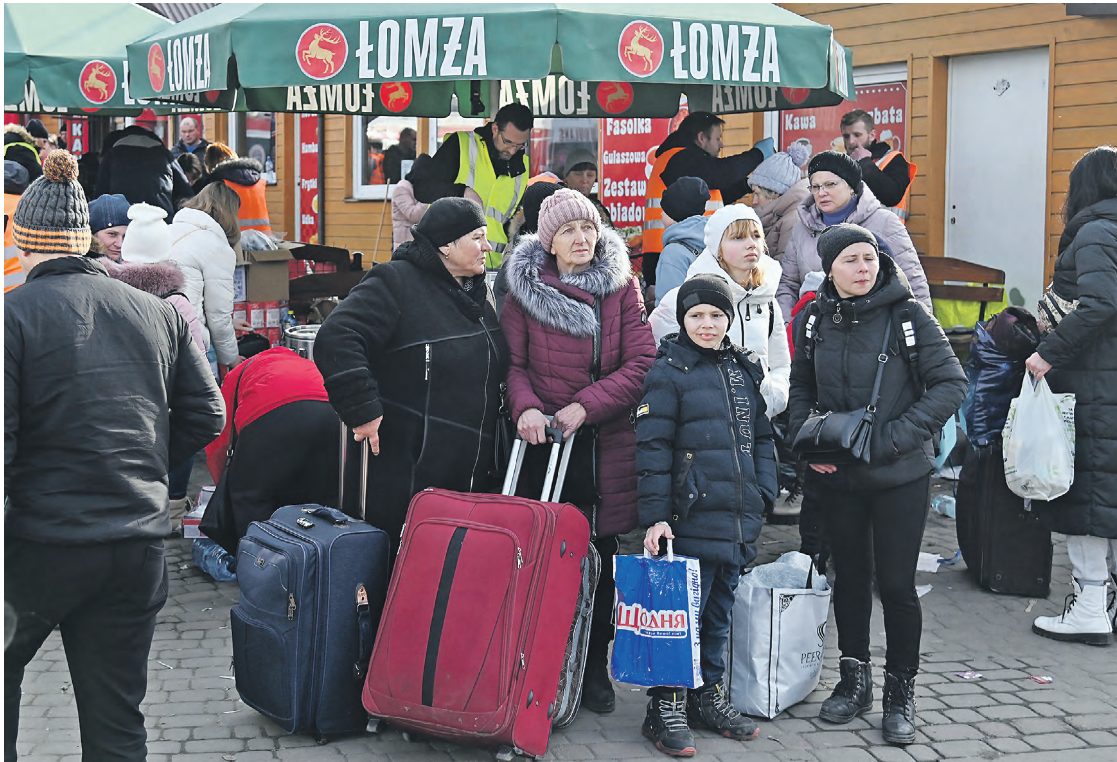
26 февраля 2022 года. Жители Украины с вещами толпятся на контрольно-пропускном пункте Медыка — Шегини на польско-украинской границе