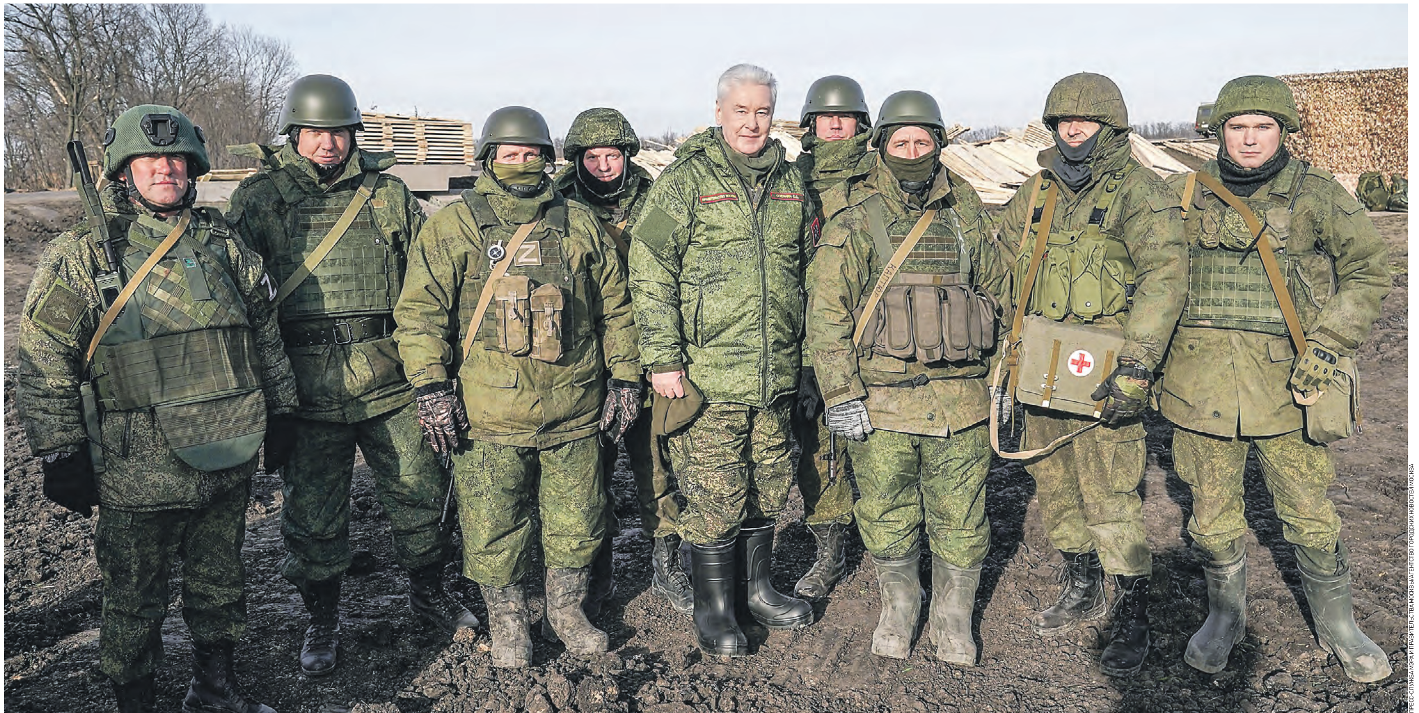
2 декабря 2022 года. Мэр Москвы Сергей Собянин (в центре) во время посещения линии обороны в зоне специальной военной операции в Луганской Народной Республике пообщался с военнослужащими, в том числе с москвичами, которые защищают нашу Родину

Мэр Москвы Сергей Собянин: Работаем на благо страны, города, москвичей