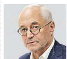
ЕВГЕНИЙ ГЕРАСИМОВ ДЕПУТАТ МОСКОВСКОЙ ГОРОДСКОЙ ДУМЫ, НАРОДНЫЙ АРТИСТ РОССИИ

ский синоним, то не надо использовать английское слово. Но становиться языковыми «пуристами» и начинать репрессировать людей, которые употребили английский термин вместо русского, — это абсурд. Каждый человек говорит так, как ему удобней. Поэтому, конечно, создавать языковую полицию и начинать всех штрафовать — мера излишняя. Такое впечатление, что у нас в стране нет других забот и проблем... По итогу замысел — правильный. Весь вопрос в том, как он будет применяться на практике. Если исполнение подкачает... то вряд ли эта идея пойдет всем нам на пользу.