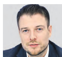
КОНСТАНТИН ДЕРЕВЯНКО ПРЕДСЕДАТЕЛЬ КОМИТЕТА ПО СВЯЗЯМ С ГОСУДАРСТВЕННЫМИ ОРГАНАМИ РОССИЙСКОГО НАЦИОНАЛЬНОГО СБОРА, ПРЕДСЕДАТЕЛЬ НЕКОММЕРЧЕСКОГО ПАРТНЕРСТВА ПО СОДЕЙСТВИЮ В ПОДДЕРЖКЕ И СОХРАНЕНИИ РУССКОГО ЯЗЫКА

что отрицать его тоже не имеет смысла. Поэтому особого обоснования в этом запрете я для себя не вижу.