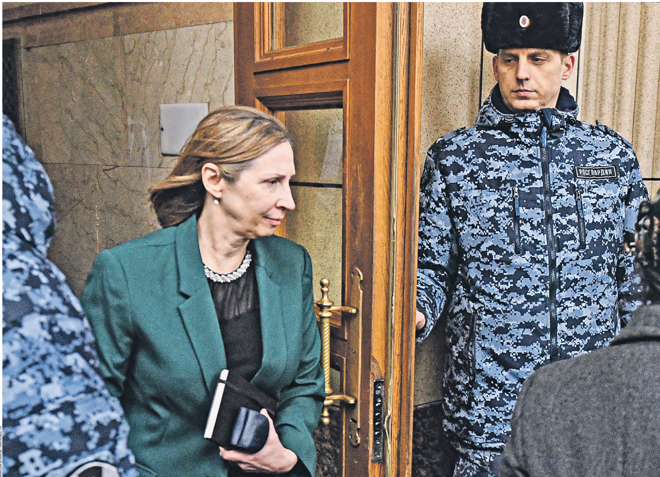
30 января 2023 года. Москва. Новый посол США Линн Трейси у здания МИД РФ, куда она прибыла для вручения копий верительных грамот

Администрацию США в России впервые представляет дама: чего ждать