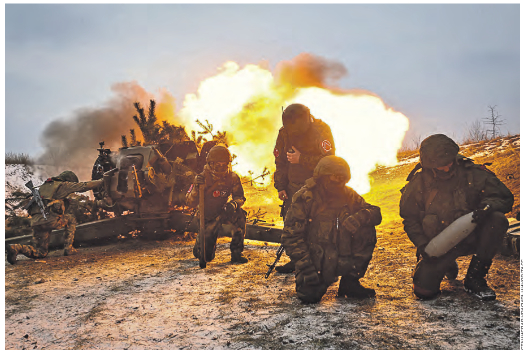
11 февраля 12:39 Боевая работа расчетов буксируемых гаубиц Д-30 Центрального военного округа (ЦВО) в зоне проведения спецоперации

Сейчас новая тактика и стратегия у командования (Вооруженных сил России. — «ВМ»). Времена изменились, изменились средства поражения, наблюдения, а также контроля. На участках фронта работает современная техника. Мы планомерно продвигаемся небольшими темпами, занимаем более выгодные рубежи, новые территории, выдвигаем противника на всех участках местности.