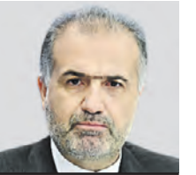
КАЗЕМ ДЖАЛАЛИ Чрезвычайный и полномочный посол Исламской Республики Иран в России

Развитию более тесного сотрудничества между нашими странами в торговле препятствуют объективные сложности. Наши железные дороги еще не соединены. Не разработаны отношения в таможене и логистике. Плюс надо расширять водное сообщение. Пока ни Иран, ни Россия в полную силу не использовали свои возможности на Каспийском море. Иран может направлять корабли, наполненные грузом на семь тонн. Но в России, на Каспии, есть только один порт, который может принять такое судно, — в Махачкале. Есть больше портов на Волге. Но по реке могут ходить только корабли с грузом до трех тонн. Рад сообщить, что более 60 процентов оплаты мы проводим в национальных валютах и, таким образом, уходим от привязки к американскому доллару.