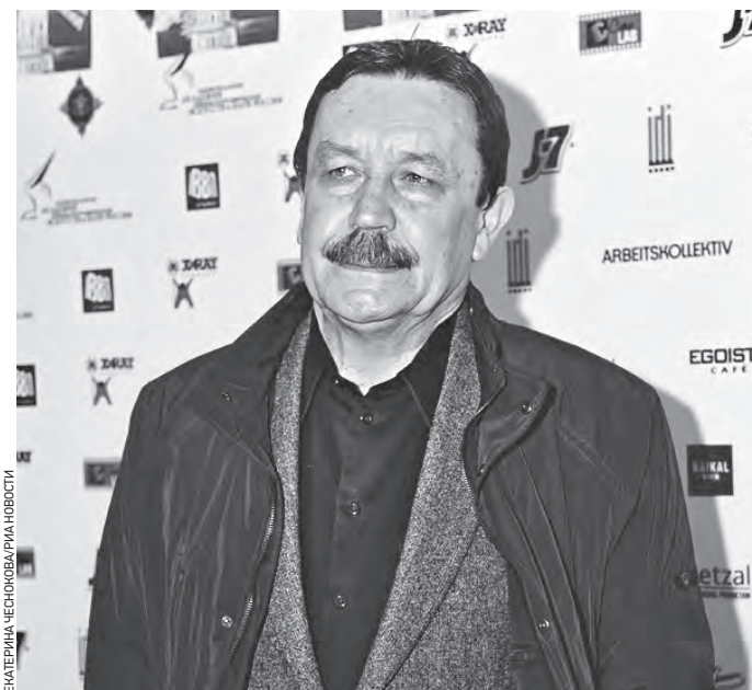
7 апреля 2014 года. Режиссер Вадим Абдрашитов на церемонии вручения премии «Белый квадрат»

На «Мосфильме» Абдрашитов начал снимать бодро и ярко. Выходе картин образовался даже некий ритм: они появлялись раз в два года. 1976 — «Слово для защиты», 1978 — «Поворот», 1980 — «Охота на лис», 1982 — «Остановился поезд», 1984 — «Парад планет», а потом — «Плюмбум, или Опасная игра» и «Слуга». Все