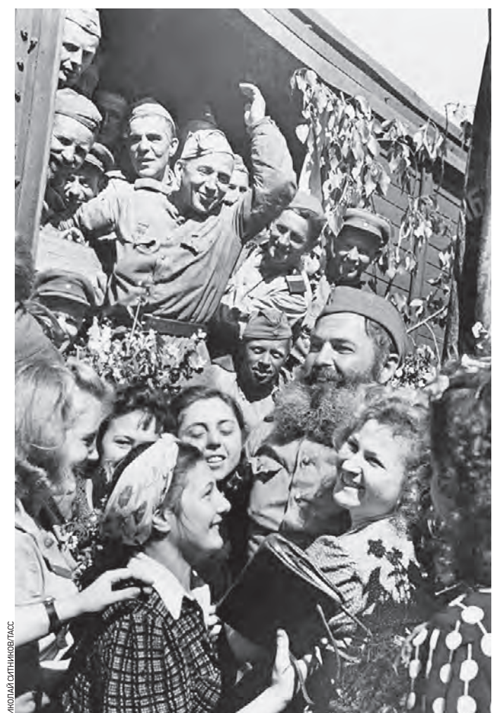
Лето 1945 года, Москва, Белорусский вокзал. Встреча воинов-победителей, вернувшихся с войны

КОЛЛЕКТИВ РЕДАКЦИИ ГАЗЕТЫ «ВЕЧЕРНЯЯ МОСКВА»