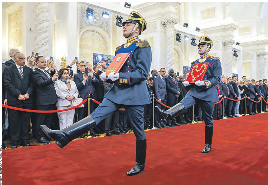
7 мая. Гвардейцы Президентского полка торжественно выносят Конституцию России и Знак президента России

Владимир Путин отметил, что в тексте принесенной им президентской присяги сконцентрирована суть высочайшего предназначения главы государства — беречь Россию и служить ее народу. — Понимаю, что это огромная честь, обязанность и священный долг. Именно это определяло мой выбор, мои обязанности, мои задачи в предыдущие годы. Заверяю вас, что и впредь интересы, безопасность народа России будут для меня превыше всего, — объявил президент страны. Он заявил, что консолидированная воля миллионов россиян — это колоссальная сила и свидетельство твердой уверенности, что судьба страны будет определять нынешнее и будущее поколения. — Вы, граждане России, подтвердили правильность курса страны. Это имеет огромное значение именно сейчас, когда мы столкнулись с серьезными испытаниями. Вижу в этом глубокое понимание наших