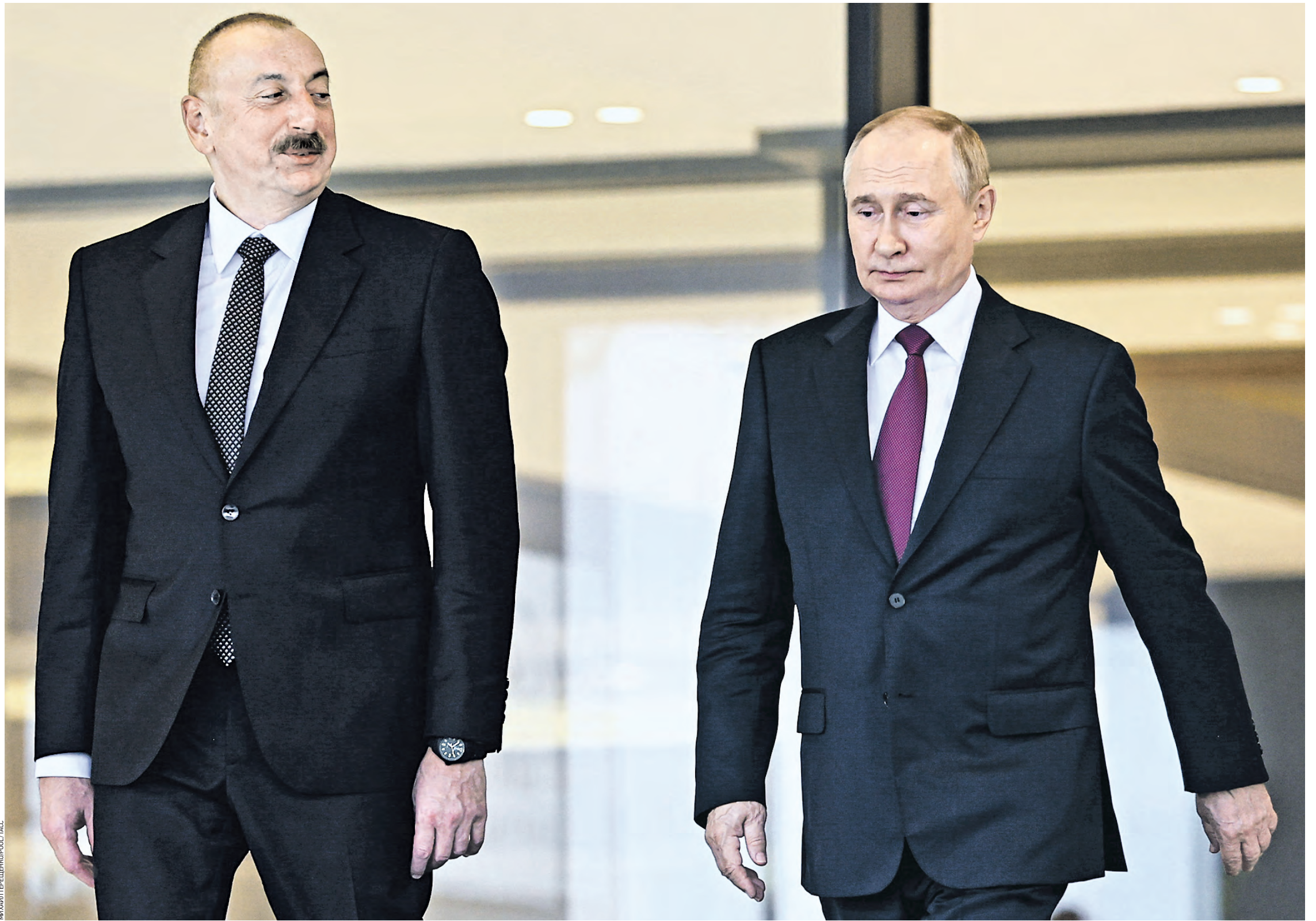
19 августа 2024 года. Азербайджан. Баку. Президент РФ Владимир Путин и президент Азербайджана Ильхам Алиев (справа налево) после государственного приема у дворца «Гюлистан»

— В сюжете журналистка безосновательно утверждает, что здесь базируются шпионы и сепаратисты. По моим данным, Ваку.tv получает финансирование от правительства Азербайджана, — сообщил руководитель организации. Примаков уточнил, что Россотрудничество подаст судебный иск о защите деловой репутации. От азербайджанской стороны ожидаются неопровержимые доказательства их заявлений или же опровержение и извинения. В общем — политический клинч. Но в чем его причина?