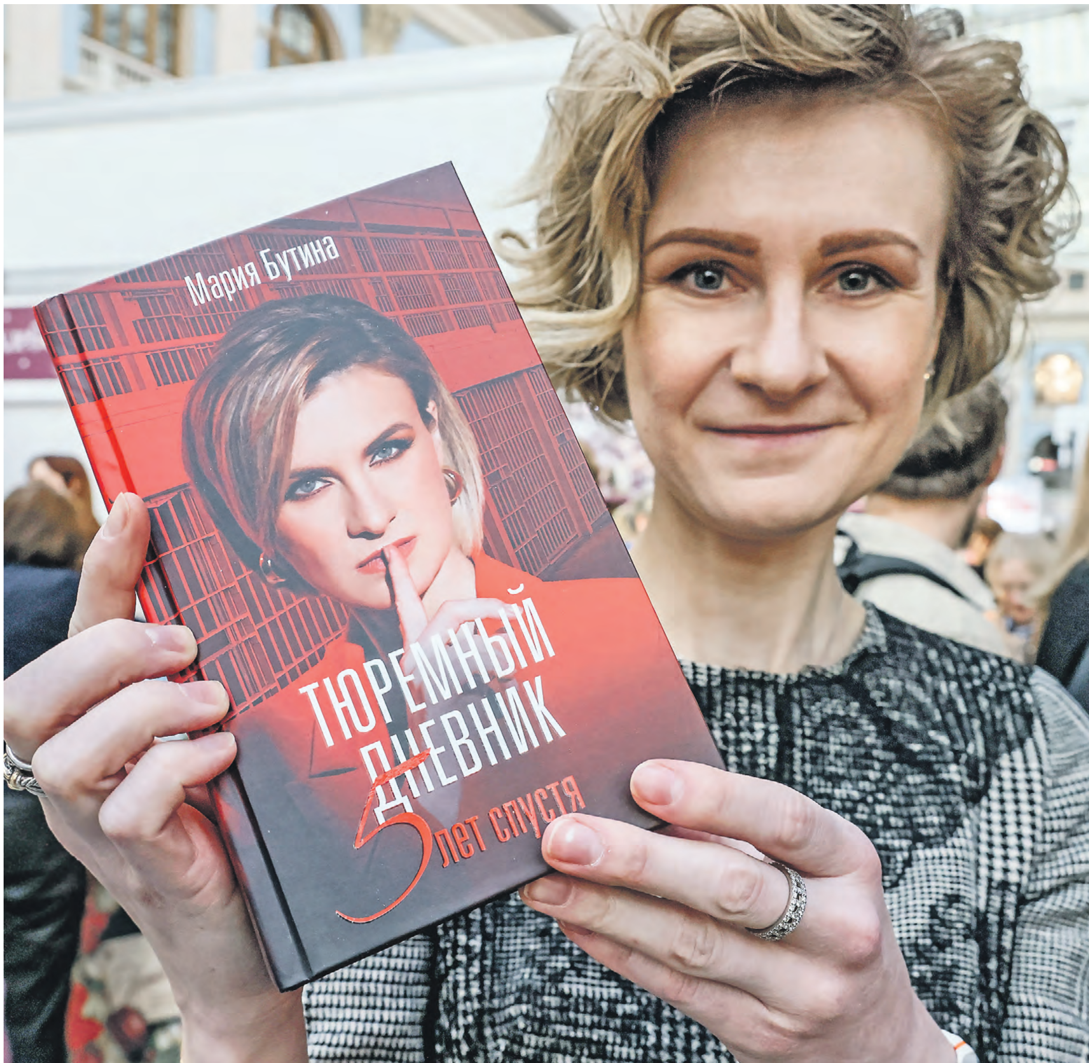
Член комитета Госдумы РФ по международным делам Мария Бутина на презентации своей книги «Тюремный дневник» на ярмарке интеллектуальной литературы Non/fiction№26. Фото: 5 декабря 2024 года

Действительно, большая часть заключенных — чернокожие или латиносы. Это интересно, по-