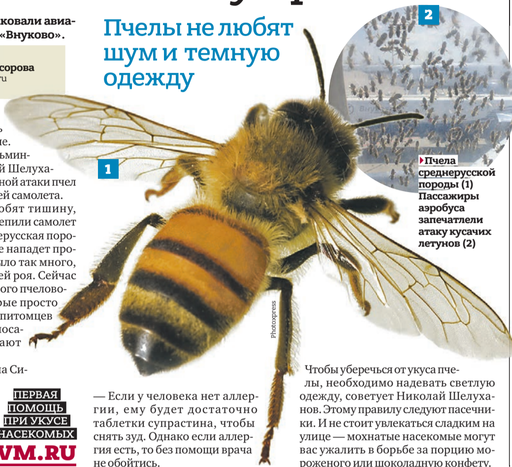
1 Пчела среднерусской породы (1) 2 Пассажиры аэробуса запечатлели атаку кусачих летунов (2)