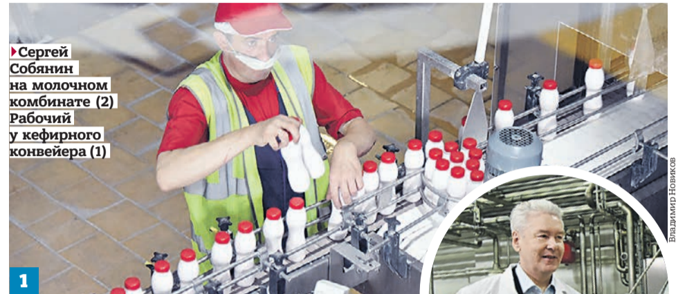
► Сергей Собянин на молочном комбинате (2) Рабочий у кефирного конвейера (1)

Неспециалисту это событие может, конечно, показаться малозначительным. А между тем это еще один кирпичик в стене импортозамещения. Потому что сывротка, как выяснилось, применяется и кондитерами, и хлебопеками, и даже производителями колбасных и прочих мясных изделий. Нельзя сказать, чтобы сывротку у нас