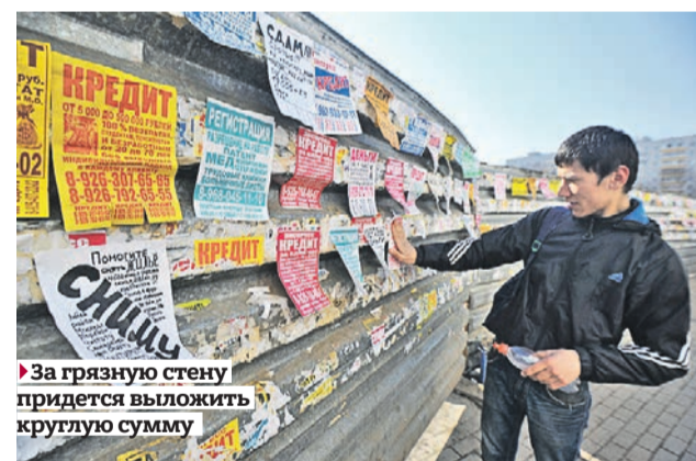
► За грязную стену придется выложить круглую сумму

— Случаи проявления вандализма на территории метрополитена нечасты, но такие факты имеются. Однажды хулиганы «разукрасили» из баллончика весь состав. Пришлось снять поезд с маршрута. Так что изменения в законе приветствуем, — сообщили «Вечерке» в пресс-службе метро.