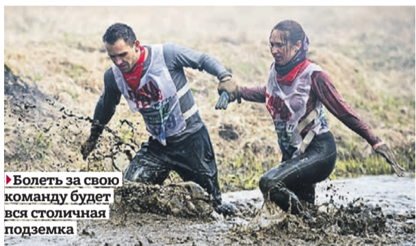
► Болеть за свою команду будет вся столичная подземка