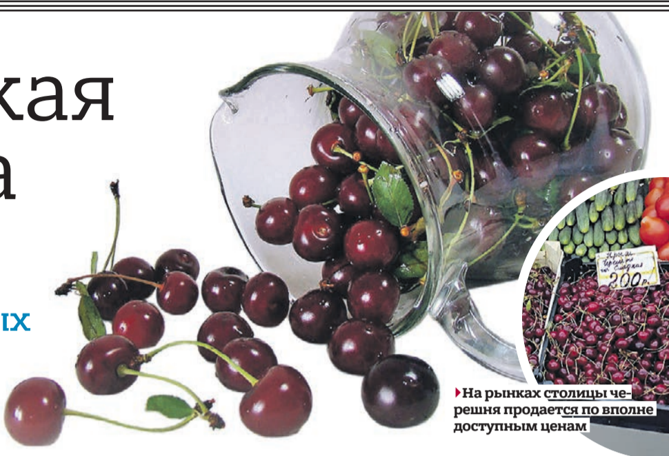
На рынках столицы черешня продается по вполне доступным ценам

Сегодня мы выясняли, каков ассортимент черешни в столице и сколько стоит килограмм спелых ягод. На