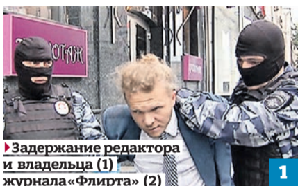
1 Задержание редактора и владельца (1) журнала «Флирта» (2)

цы. И эти журналы распространяют вблизи школ и детских садов... — Это забота родителей — следить за своими детьми. А девушки знакомятся как хотят, — кокетливо заме-